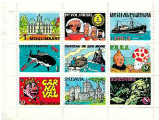
Ill. 14 : Tintimbres La Samaritaine.

Il existe aussi de vignettes qui furent émises par certaines entreprises en collaboration avec la marque de commerce Tintin, comme les Tintimbres de La Samaritaine , ce grand magasin de luxe emblématique situé à Paris (1 er arr.), entre le Pont Neuf et la rue de Rivoli. Je connais au moins quatre blocs différents de ces derniers (ill. 14 à 17).