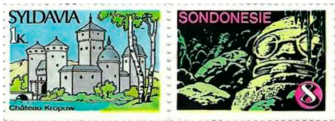
Tintimbres pour la Syldavie et la Sondonsie...

PÉ, Frank : Les timbres Spirou . Site internet consulté le 8 novembre 2025. https://www.toutspirou.fr/Lestimbres/lestimbres.html