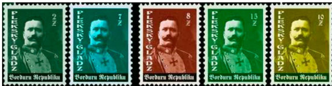
Ill. 18 : Timbres fictifs pour la Bordurie.

Des fans des aventures de Tintin ont créé leurs propres faux timbres-poste pour la Bordurie et pour la Syldavie, ces deux pays en guerre l'un contre l'autre qu'on retrouve dans les albums Le sceptre d'Ottokar , Objectif Lune , On a marché sur la lune , L'affaire Tournesol et Le Lac aux requins . Ici, seule l'imagination de leurs auteurs en limite la variété. La plupart sont très beaux (ill. 18 à 20).