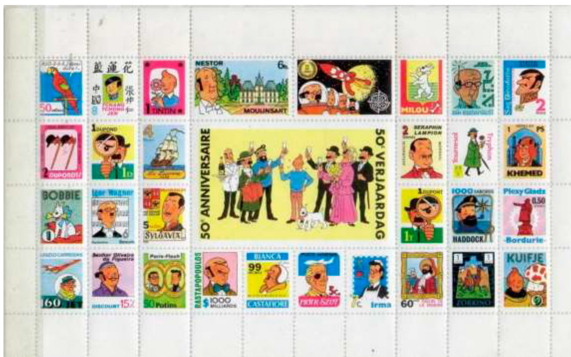
Ill. 13 : Vignettes Tintin émises à l'occasion du 50 e anniversaire de sa création par Hergé.

Ces timbres Tintin, destinés à faire de la publicité pour le magazine Tintin auprès des jeunes lecteurs, furent distribués comme suppléments au magazine en 1979 à l'occasion du cinquantième anniversaire de la création du personnage de Tintin par Hergé. Trente et un timbres illustrent différents personnages qui habitent les albums de Tintin, les bons comme le professeur Tournesol, Nestor ou les Dupondt, et les mauvais comme Rastapopoulos (ill. 13).