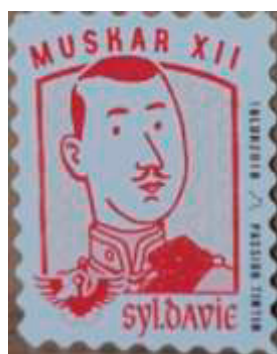
Ill. 19 : Syldavie