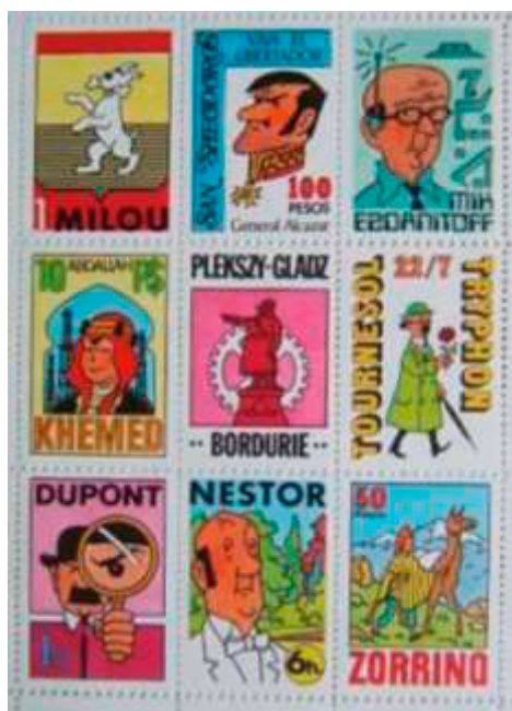
Ill. 16 : Tintimbres La Samaritaine.