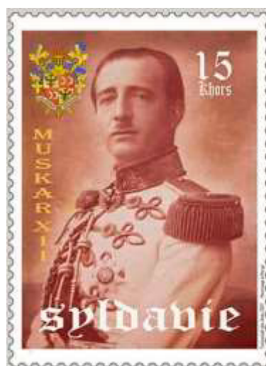
Ill. 20 : Syldavie

L'autre magazine franco-belge pour la jeunesse ayant émis des timbres est le journal Spirou.