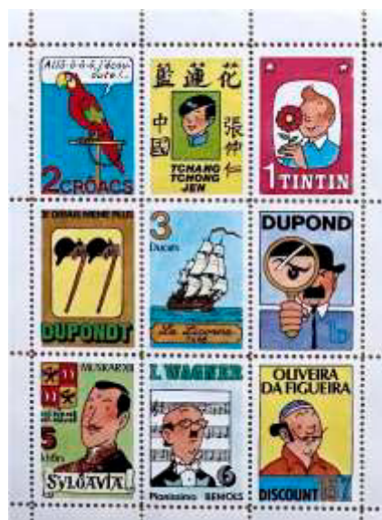
Ill. 15 : Tintimbres la Samaritaine