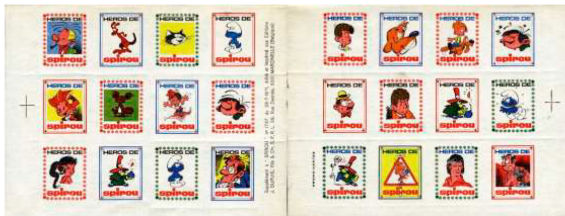
Ill. 28 : Bloc de 24 vignettes Spirou du 29 juillet 1971.

timbres n'étaient pas dentelés, mais percés en ligne. Ils portent en légende « Héros de Spirou » (ill. 28 et 29).