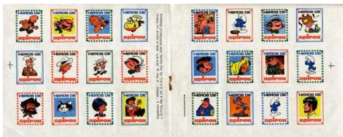
Ill. 29 : Bloc de 24 vignettes Spirou du 26 août 1971.

La troisième série de 194 timbres (rien de moins !) a été livrée dans quatre numéros successifs ; les numéros 3279, 3280, 3281 et 3282 des 14, 21, 28 février et 7 mars 2001. Plus que la représentation des héros du journal, cette série propose de véritables mini gags ! Ils étaient fièrement annoncés en page couverture : « Gratuit : des timbres rigolos à coller partout » avec en sus : « Grand concours d'art postal ». Voilà comment on intéressait les jeunes à la philatélie en 2001 ! (ill. 30 à 33).