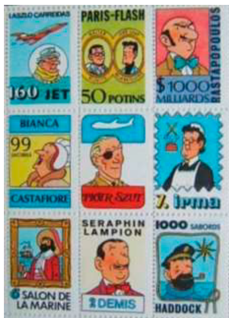
Ill. 17 : Tintimbres la Samaritaine