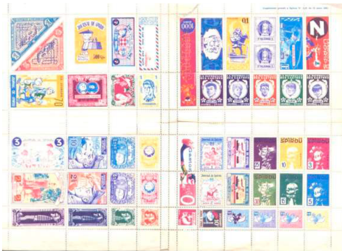
Ill. 26 : La célèbre feuille complète de 52 timbres de 1961.

panneaux comportant un nombre inégal de timbres (18-9-13-12) à l'effigie des différents personnages dont les aventures étaient racontées dans les pages du magazine. Ici, pas de nom de pays fictif, chaque timbre portait en légende « Journal de Spirou » (ill. 26).