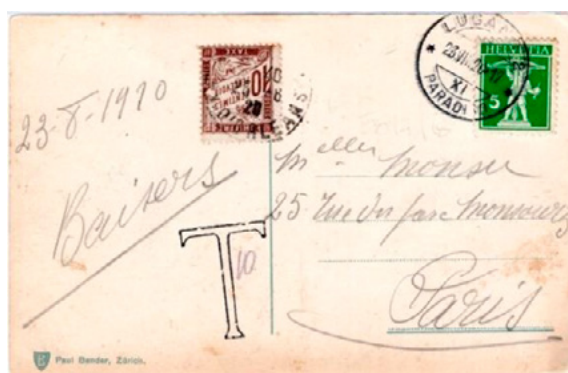
Carte postale postée le 23 août 1920 à Lugano (Suisse) à destination de Paris (Seine). Affranchie à 5c avec un timbre-poste au type Fils de Tell (YT 136). Taxée au départ, T et 10 manuscrit. Taxée à l'arrivée le 25 à 10c avec un chiffre-taxe au type Duval (YT 29). Le tarif suisse des cartes postales pour l'étranger était alors de 10c, insuffisance de 5c et donc taxe de 10c.