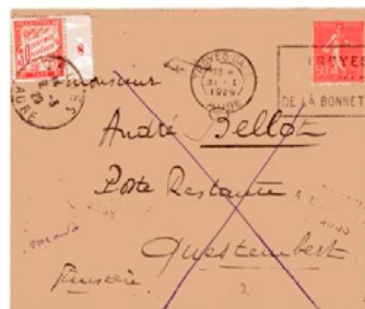
Lettre postée le 31 janvier 1929 à Troyes (Aube) à destination de Questembert (Morbihan). Affranchie à 50c avec un timbre-poste au type Semeuse (YT 199), au tarif des lettres de 20g ou moins en vigueur depuis le 9 août 1926. Lettre expédiée en poste restante, non réclamée dans le délai réglementaire et retournée à Troyes. Taxée à 30c avec un chiffre-taxe au type Duval (YT 33) au retour à Troyes le 2 mars pour payer la taxe de poste restante en vigueur depuis le 1 er mai 1926.