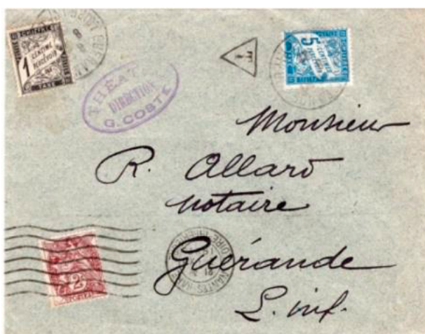
Imprimé sous enveloppe ouverte posté le 7 décembre 1922 à Nantes (Loire-Inférieure) à destination de Guérande (Loire-Inférieure). Affranchi à 2c avec un timbre-poste au type Blanc (YT 108). Taxé à 6c à l'arrivée le 8 avec deux timbres au type Duval, un à 1c et un à 5c, au double de l'insuffisance de 3c, le tarif des imprimés de 50g ou moins expédiés sous enveloppe ouverte était de 5c depuis le 1 er mai 1878.

Les seules autres occasions de taxations inférieures à 10c, pour lesquelles l'utilisation du chiffre-taxe à 5c était requise, concernaient des imprimés sous enveloppe ouverte insuffisamment affranchis du service intérieur. De tels cas ont toujours été assez rares.