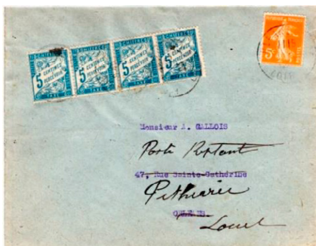
Imprimé posté le 30 septembre 1923 à Orléans (Loiret) à destination d'Orléans, Affranchi à 5c avec un timbre-poste au type Semeuse (YT 158), au tarif des imprimés sous enveloppe ouverte en vigueur depuis le 1 er mai 1878. Redirigé en poste restante vers Pithiviers (Loiret). Taxée à 20c avec 4 chiffres-taxe à 5c au type Duval (YT 28), pour le service de poste restante en vigueur depuis le 1 er avril 1920.