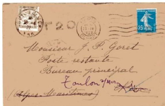
Lettre postée le 23 avril 1922 à Paris (Seine) à destination de Nice (Alpes-Maritimes), redirigée vers Toulon (Var). Affranchie à 25c avec un timbre-poste au type Semeuse (YT 140), au tarif des lettres de 20g ou moins en vigueur depuis le 1 er avril 1920. Taxée à 20c avec un chiffre-taxe au type Duval (YT 31) pour le service de poste restante établi depuis le 1 er mai 1920.