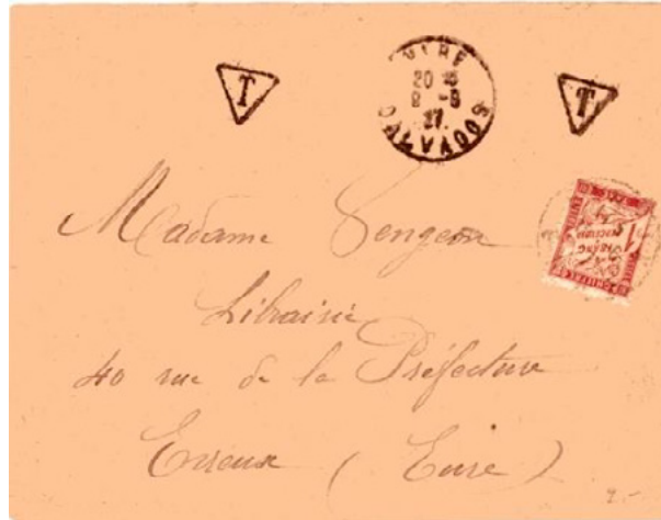
Lettre postée le 9 juin 1927 à Vire (Calvados) à destination d'Évreux (Eure). Lettre non affranchie et donc taxée à l'arrivée le 11 à 1fr avec un chiffre-taxe au type Duval (YT 40). Le tarif des lettres de 20g ou moins était de 50c depuis le 9 août 1926, insuffisance de 50c et donc taxe de 1fr.