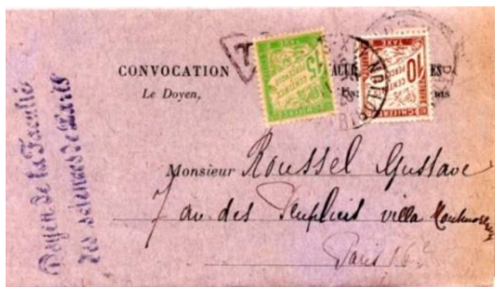
Lettre officielle (convocation) postée le 11 octobre 1920 à Paris (Seine) à destination de Paris. Lettre non affranchie, taxée à 25c avec deux chiffres-taxe au type Duval, un à 10c (YT 29) et un à 15c (YT 30). Il n'y avait pas de chiffre-taxe à 25c en service en 1920. Taxe simple à 25c en vertu du tarif du 1 er juin 1897 concernant les convocations à des examens.