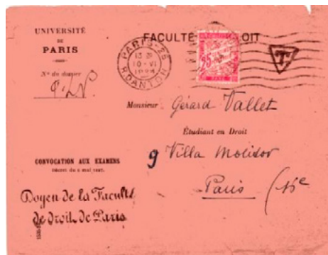
Lettre postée le 10 juin 1924 à Paris (Seine) à destination de Paris. Lettre non affranchie, taxée à 25c avec un chiffre-taxe au type Duval (YT 32). Taxe simple en raison de l'expéditeur, Université de Paris (loi du 1 er juin 1897), tarif des lettres de 20g ou moins en vigueur jusqu'au 15 juillet 1925.

Étant donné sa valeur faciale, ce chiffre-taxe ne pouvait pas représenter le double d'une insuffisance d'affranchissement dans le service intérieur. Seul, il n'a servi qu'à la taxation simple d'objets officiels du service intérieur (lois du 29 mars 1889 et du 1 er juin 1897), jusqu'au 15 juillet 1925. N'ayant plus d'utilité spécifique après le changement de tarif du 16 juillet 1925, il fut retiré du service le 27 suivant.