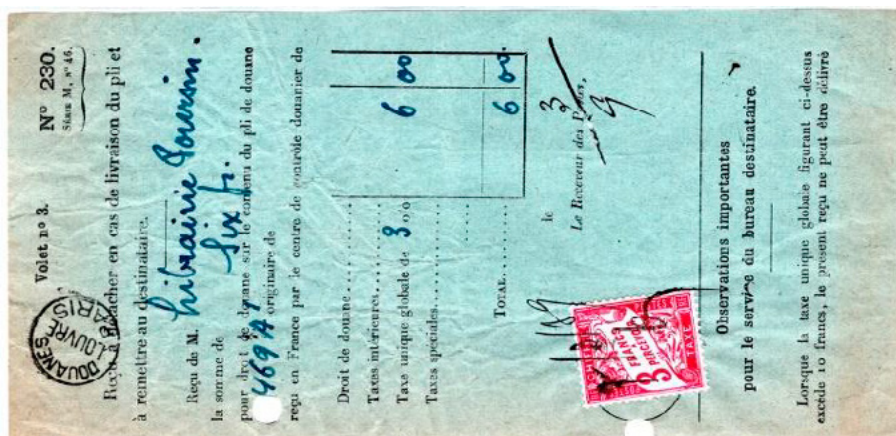
Reçu n° 230 des Douanes françaises pour la livraison d'un pli à la Librairie Poursin de Paris. Cachet Douanes Paris Louvre en haut à gauche. Affranchi à 3fr avec un chiffre-taxé au type Duval (YT 42A), annulé à la main le 7 mars 1929.

Au début des années 1930, huit chiffres-taxés au type Duval étaient toujours en service, à savoir ceux à 5, 10, 30, 50 et 60c et ceux à 1, 2 et 3fr. Ils le resteront jusqu'à la fin des années 1930. Un seul autre chiffre-taxé au type Duval sera mis service après 1930, celui à 5fr émis en mars 1941 et retiré dès le 23 août 1943. Il servira surtout à la taxation des lettres insuffisamment affranchies expédiées par voie aérienne.