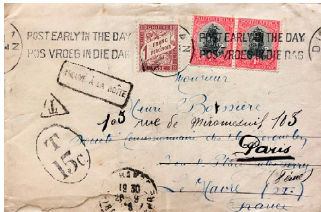
Lettre postée en septembre 1928 à Durban (Afrique-du-Sud) à destination du Havre (Seine-Inférieure). Affranchie à 2 pence avec deux timbres-poste à 1 penny au type Drommedaris (YT 17), taxée au départ, T 15c. Arrivée au Havre le 26 septembre 1928, puis réexpédiée à Paris (Seine). Taxée à l'arrivée à 1fr avec un chiffre-taxe au type Duval (YT 40). Le tarif pour une lettre pour l'étranger était de 3 pence. Insuffisance de 1 penny et taxe de 1fr calculée ainsi : 1p x 1fr50/3p x 2 = 1fr.