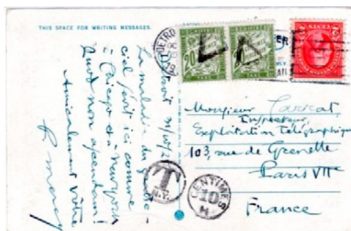
Carte postale postée le 31 octobre 1925 à Détroit (Michigan, USA) à destination de Paris (Seine). Affranchie à 2 cents avec un timbre-poste au type Washington (YT 229). Taxée au départ, T et 10 centimes-or. Taxée à 40c à l'arrivée en France avec deux chiffres-taxe à 20c au type Duval (YT 31). En octobre 1925 le rapport franc-or/franc français était de 4.

Après le changement de tarif du 1 er mai 1926, seul il ne représentait plus aucune taxation courante. Il fut donc retiré du service ce jour-là.