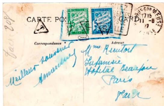
Carte postale postée le 11 août 1927 à Verdun-sur-Meuse (Meuse) à destination de Paris (Seine). Carte non affranchie, taxée au départ, T. Taxée à l'arrivée à 50c avec deux chiffres-taxe au type Duval, un à 5c (YT 28) et un à 45c (YT 36). Le tarif des cartes postales 5 mots ou moins était de 25c depuis le 9 août 1926. Insuffisance de 25c et donc taxe de 50c.

Après son retrait en 1925, il a pu servir en combinaison quelques temps, mais son utilisation est restée rare.