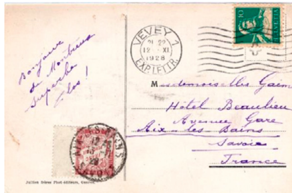
Carte postale postée le 12 novembre 1928 à Vevey (Suisse) à destination d'Aix-les-Bains (Savoie). Affranchie à 10c avec un timbre-poste au type Guillaume Tell (YT 161). Pas de signe de taxation au départ. Taxée à l'arrivée le 13 à 1fr avec un chiffre-taxe au type Duval (YT 40). Insuffisance de 10c suisse correspondant à 162/3 centimes-or, soit en 1928 à 1fr français.