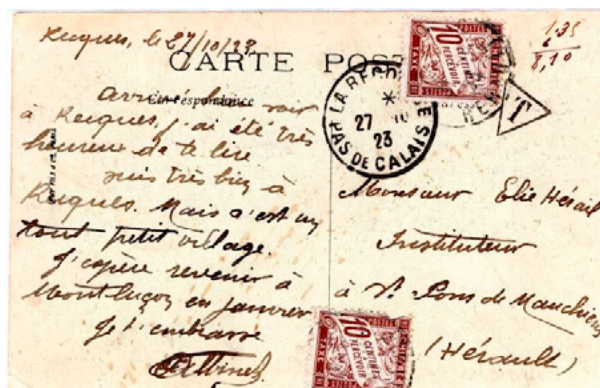
Carte postale postée le 27 octobre 1923 à La Recousse (Pas-de-Calais) à destination de Saint-Pons-de-Mauchiens (Hérault). Carte non affranchie, taxée au départ, T dans un triangle. Taxée à l'arrivée le 1 er octobre à 20c avec deux chiffres-taxe à 10c au type Duval (YT 29). Le tarif des cartes postales illustrées étaient de 10c depuis le 14 juillet 1922. Insuffisance de 10c et donc taxe de 20c.

En multiple ou en combinaison comme valeur d'appoint le chiffre-taxe à 10c a été couramment utilisé durant toute la période étudiée.