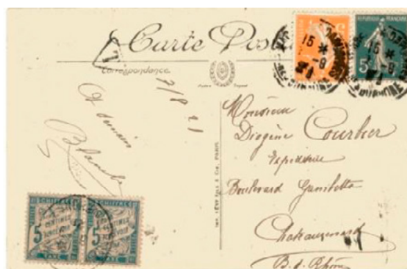
Carte postale postée le 7 septembre 1921 à Marseille à destination de Châteaurenard (Bouches-du-Rhône). Affranchie à 10c avec deux timbres-poste à 5c au type Semeuse, un vert (YT 137) et un jaune (YT 158). Taxée à l'arrivée le 8 à 10c avec deux chiffres-taxe à 5c au type Duval (YT 28). Le tarif des cartes postales 5 mots ou moins était de 15c depuis le 1 er avril 1920.