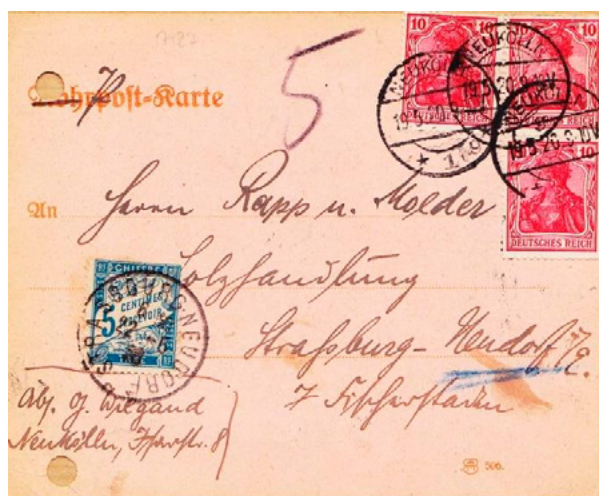
Carte postée le 19 mai 1920 à Neukölln (Berlin, Allemagne) à destination de Strasbourg (Bas-Rhin). Affranchie à 30 pfg avec trois timbres à 10c au type Germania (YT 84). Taxée au départ, 5 manuscrit. Le tarif allemand des cartes postales pour l'étranger était de 40 pfg depuis le 6 mai 1920. Une insuffisance de 10pfg qui correspondait à 10pfg \times 10c/40pfg \times 2 = 5 centimes. Taxée à 5c avec un chiffre-taxe au type Duval (YT 28). Rare utilisation du chiffre-taxe à 5c seul dans les années 1920.

Les seules autres occasions de taxations inférieures à 10c, pour lesquelles l'utilisation du chiffre-taxe à 5c était requise, concernaient des imprimés sous enveloppe ouverte insuffisamment affranchis du service intérieur. De tels cas ont toujours été assez rares.