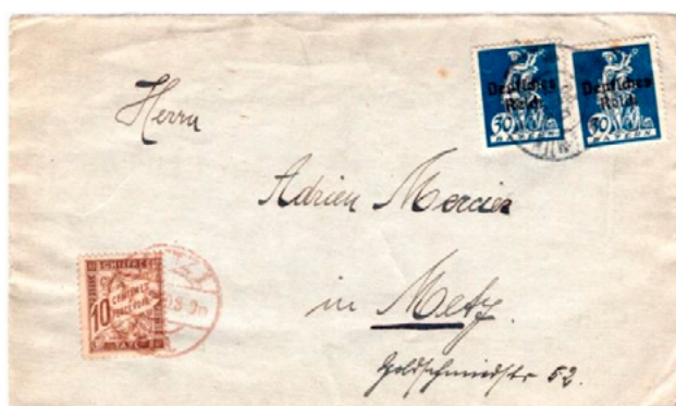
Lettre postée en décembre 1920 à Munich (Bavière, Allemagne) à destination de Metz (Moselle). Affranchie à 60 pfennig avec deux timbres-poste à 30 pfg au type Bavaria (YT 122). Taxée à l'arrivée le 31 à 10c avec un chiffre-taxe au type Duval (YT 29). Le tarif des lettres de l'Allemagne pour la France était alors de 80 pfg. Insuffisance de 20 pfg qui conduit à calculer une taxe de 20\text{pfg} \times 25\text{c}/80\text{pfg} \times 2 = 12,5\text{c} , arrondie à 10c.

En multiple ou en combinaison comme valeur d'appoint le chiffre-taxe à 10c a été couramment utilisé durant toute la période étudiée.