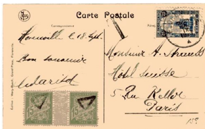
Carte postale postée le 18 septembre 1921 à Florenville (Luxembourg, Belgique) à destination de Paris (Seine). Affranchie à 25c avec un timbre-poste au type Perron liégeois (YT 164), taxée au départ T. Taxée à l'arrivée à 30c avec deux chiffres-taxe à 15c au type Duval. Le tarif belge pour une carte postale ordinaire vers la France était alors de 30c. Insuffisance de 5c, mais taxe minimale de 30c pour les objets de l'étranger en vigueur depuis le 1 er avril 1921.