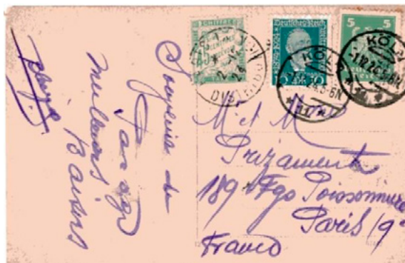
Carte postale postée le 1 er décembre 1924 à Cologne (Köln, Allemagne) à destination de Paris (Seine). Affranchie à 15 pfennig avec deux timbres-poste, un à 5pf au type Aigle héraldique (YT 349) et un à 10pf au type Heinrich von Stephan (YT 359). Taxée à 45c à l'arrivée le 2 décembre avec un chiffre-taxe au type Duval (YT 36). Le tarif des cartes postales pour la France était alors de 20pf, insuffisance de 5pf mais depuis le 1 er avril 1924 une taxe minimale de 45c était en vigueur.