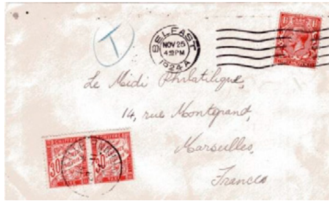
Lettre postée le 25 novembre 1924 à Belfast (Royaume-Uni) à destination de Marseille (Bouches-du-Rhône). Affranchie à 1½ penny avec un timbre-poste au type George V (YT 161). Taxée au départ, T manuscrit. Le tarif britannique pour une lettre vers l'étranger était alors de 2½ pence. Insuffisance de 1 penny, qui conduit à une taxe de 1p x 75c/2,5p x 2 = 60 centimes.

Pour plus de détails sur l'utilisation du chiffre-taxe rouge à 30c, on pourra consulter mon article paru dans Philabec en 2026.