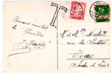
Carte postale postée le 19 octobre 1922 à Genève (Suisse) à destination de Tours (Indre-et-Loire). Affranchie à 10c avec un timbre-poste au type Guillaume Tell (YT 161). Taxée au départ, T, le tarif suisse des cartes postales pour l'étranger était en 1922 de 25c. Taxée à l'arrivée à 30c avec un chiffre-taxe au type Duval (YT 33), au minimum de taxation des objets provenant de l'étranger en vigueur depuis le 1 er avril 1921.