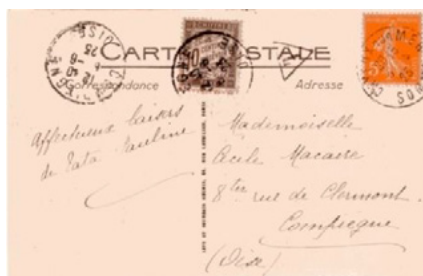
Carte postale postée le 5 mai 1923 à Cayeux-sur-Mer (Somme) à destination de Compiègne (Oise). Affranchie à 5c avec un timbre-poste au type Semeuse (YT 158), taxée au départ T dans un triangle. Taxée à l'arrivée le 6 à 10c avec un chiffre-taxe au type Duval (YT 29). Le tarif des cartes postales 5 mots était de 10c depuis le 1 er avril 1921. Insuffisance de 5c, taxe de 10c.