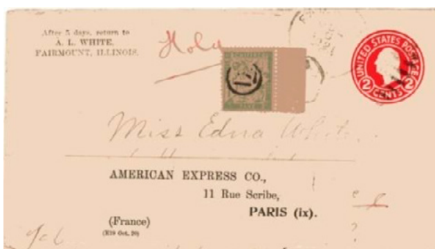
Lettre postée le 6 juillet 1921 à Fairmount (Illinois, USA) à destination de Londres (Angleterre). Entier postal à 2 cents au type George Washington. Taxé au départ, T dans un hexagone. Lettre réexpédiée le 22 à Paris (Seine), sans autre affranchissement, arrivée le 22. Taxée à 15c à l'arrivée avec un chiffre-taxe au type Duval (YT 30). Taxé à 15c pour une raison inconnue. Le tarif des lettres vers l'Angleterre ou la France était de 5 cents, une insuffisance de 3 cents qui aurait dû engendrer alors une taxe de 30c en France. De plus, une taxe minimale de 30c pour les objets provenant de l'étranger était en vigueur depuis le 1 er avril 1921.