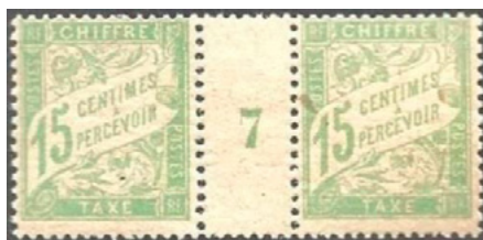
Millésime 7 de 1897

Le chiffre-taxe à 15c vert-jaune au type Duval a été émis pour la première fois en février 1894. Il a été imprimé à plat en feuilles de 150 timbres de 1893 à 1905. Il cessa d'être imprimé de 1906 à 1916, puis fut imprimé de nouveau en 1917 sur du papier GC. Il a été retiré officiellement du service le 28 avril 1923.