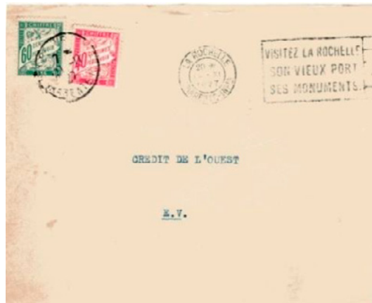
Lettre postée le 19 novembre 1927 à La Rochelle (Charente-Inférieure) à destination de La Rochelle. Lettre non affranchie arrivée le 21 et taxée à 1fr avec deux chiffres-taxe au type Duval, un à 40c (YT 35) et un à 60c (YT 38). Le tarif des lettres de 20g ou moins était de 50c depuis le 9 août 1926, insuffisance de 50c et donc taxe de 1fr.