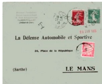
Lettre postée le 27 janvier 1926 à Rambouillet (Seine-et-Oise) à destination du Mans (Sarthe). Affranchie à 30c avec 2 timbres-poste au type Semeuse, un à 10c (YT 159) et un à 20c (YT 39). Taxée à 40c avec un chiffre-taxe au type Duval (YT 35) pour excès de poids, le tarif pour une lettre de 50g ou moins était de 50c depuis le 17 juillet 1925, insuffisance de 20c et donc taxe de 40c.

Il servira ensuite du 1 er mai 1926 au 8 août 1926, environ 4 mois, pour la taxation des lettres officielles de 20g ou moins non affranchies. Il a été retiré du service le 9 août 1926 quand le tarif des lettres de 20g ou moins du service intérieur est passé à 50c.