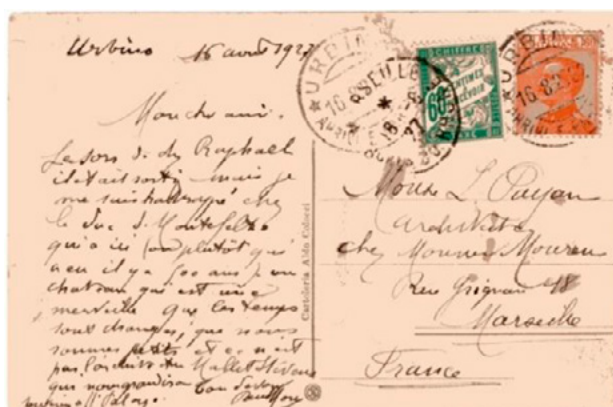
Carte postale postée le 16 août 1927 à Urbino (Italie) à destination de Marseille (Bouches-du-Rhône). Affranchie à 60c avec un timbre-poste au type Victor Emmanuel III (YT 182). Taxée à l'arrivée à 60c avec un chiffre-taxe au type Duval (YT 38). Le tarif des cartes postales de l'Italie vers la France était de 75c. Insuffisance de 15c, mais taxe minimale de 60c en vigueur depuis le 1 er août 1926.