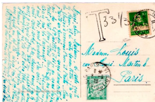
Carte postale postée le 7 septembre 1925 à Champéry (Suisse) à destination de Paris (Seine). Affranchie à 10c avec un timbre-poste au type Guillaume Tell (YT 161). Taxée au départ, T et 331/3. Taxée à l'arrivée le 8 à 45c avec un chiffre-taxe au type Duval (YT 36). Le tarif suisse des cartes postales pour la France était alors de 20c, insuffisance de 10c, mais depuis le 1 er avril 1924 une taxe minimale de 45c était en vigueur.

Seul, il a aussi pu servir du 5 juillet 1924 au 15 juillet 1925 à la taxation des lettres officielles de 50g ou moins non affranchies.