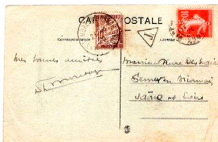
Carte postale postée le 20 septembre 1920 à Carcassonne (Aude) à destination de Semur-en Brionnais (Saône-et-Loire). Affranchie à 10c avec un timbre-poste au type Semeuse (YT 138). Taxée à l'arrivée le 21 à 10c avec un chiffre-taxe au type Duval (YT 29). Le tarif des cartes postales 5 mots ou moins était de 15c depuis le 1 er avril 1920. Insuffisance de 5c et donc taxe de 10c.