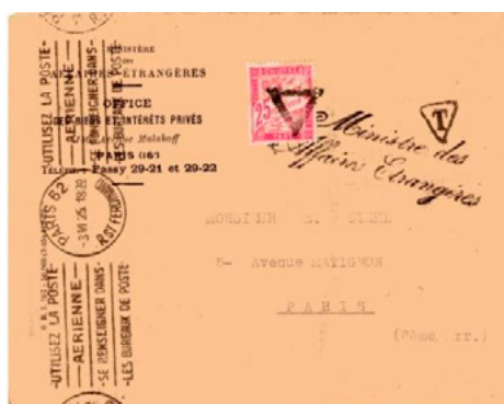
Lettre du Ministère des Affaires étrangères postée à Paris (Seine) le 3 juin 1925 à destination de Paris. Lettre non affranchie, taxée à l'arrivée à 25c avec un chiffre-taxe au type Duval (YT32). Taxe simple en raison du courrier officiel (loi du 29 mars 1889), tarif des lettres de 20g ou moins en vigueur jusqu'au 15 juillet 1925.