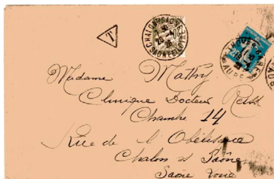
Lettre postée le 19 avril 1926 à Troyes (Aude) à destination de Chalon-sur-Saône (Saône-et-Loire). Affranchie à 25c avec un timbre-poste au type Semeuse (YT 140). Taxée à l'arrivée le 20 avril avec un chiffre- taxe à 20c au type Duval (YT 31). Le tarif des lettres de 20g ou moins était de 30c depuis le 16 juillet 1925, insuffisance de 5c, mais un minimum de taxation de 20c était en vigueur depuis le 25 mars 1924.