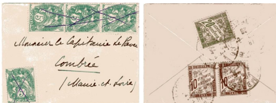
Carte de visite postée à destination de Combrée (Maine-et-Loire). Affranchie à 20c avec 4 timbres-poste à 5c au type Blanc (YT 111), annulation au crayon. Taxée à l'arrivée à Combrée le 29 mai 1926 avec 3 chiffres-taxe au type Duval, deux à 10c (YT 29) et un à 20c (YT 31). Le tarif des cartes de visite 5 mots ou moins était de 40c du 1 er mai au 8 août 1926, insuffisance de 20c et taxe de 40c.