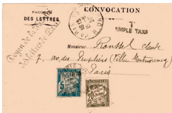
Lettre (convocation) postée le 15 juin 1920 à Paris (Seine) à destination de Paris. Lettre non affranchie taxée à 25c (taxe simple, loi du 1 er juin 1897), au tarif des lettres de 20g ou moins en vigueur depuis le 1 er avril 1920. Taxée avec deux chiffres-taxe au type Duval, un à 5c (YT 28) et un à 20c (YT 31). En 1920, il n'y avait pas de chiffre-taxe à 25c en service.