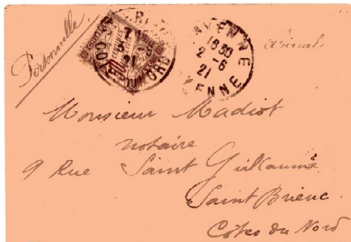
Lettre postée le 2 juin 1921 à Mayenne (Mayenne) à destination de Saint-Brieuc (Côtes-du-Nord). Lettre non affranchie, taxée à 50c avec un chiffre-taxe au type Duval (YT 37) à l'arrivée le 3 juin, au double du tarif des lettres de 20g ou moins en vigueur depuis le 1 er avril 1920.