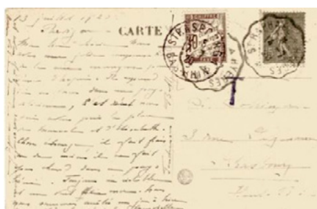
Carte postale postée le 14 juillet 1920 à destination de Strasbourg (Haut-Rhin). Affranchie à 15c avec un timbre-poste au type Semeuse (YT 130), taxée au départ T et 10 manuscrit. Taxée à l'arrivée le 17 à 10c avec un chiffre-taxe au type Duval (YT 29). Le tarif des cartes postales du service intérieur était de 20c depuis le 1 er avril 1920, insuffisance de 5c et donc taxe de 10c.

Seul, ce timbre a pu servir de 1920 à 1925 à plusieurs occasions, tant dans le service intérieur que dans le service étranger.