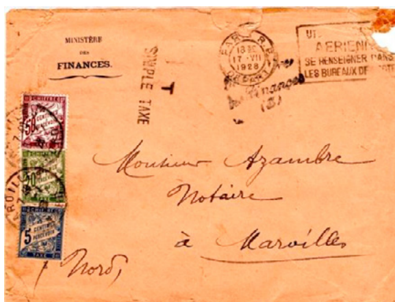
Lettre postée le 17 juillet 1928 à Paris (Seine) à destination de Maroilles (Nord). Lettre officielle non affranchie et taxée à 75c avec trois chiffres-taxe au type Duval, un à 5c (YT 28), un à 20c (YT 31) et un à 50c (YT 37). Taxe simple en vertu de la loi du 1 er mai 1889, au tarif des lettres de 50g ou moins en vigueur depuis le 9 août 1926. Utilisation du chiffre-taxe à 5c, car ceux à 15, 25 ou 45c n'était plus en service depuis 1925.

En paire et surtout en combinaison, le chiffre-taxe à 5c a souvent été utilisé au cours des années 1920.