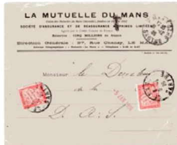
Lettre non affranchie postée le 31 décembre 1925 au Mans (Sarthe) à destination du Mans. Taxée à 60c avec deux chiffres-taxe à 30c au type Duval (YT 33), au double de l'insuffisance de 30c, tarif pour les lettres de 20g ou moins du service intérieur en vigueur depuis le 16 juillet 1925.