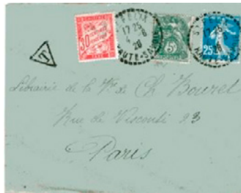
Lettre postée le 4 juin 1926 à Saint-Félix (Haute-Savoie) à destination de Paris (Seine). Affranchie à 30c avec un timbre à 5c au type Blanc (YT 111) et un à 25c au type Semeuse (YT 140). Taxée à 30c avec un chiffre-taxe au type Duval (YT 33), le tarif de la lettre de 20g ou moins était de 40c depuis le 1 er mai 1926, insuffisance de 10c, mais une taxation minimale de 30c était en vigueur depuis le 1 er mai 1926.