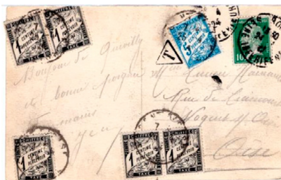
Carte postale postée le 24 avril 1924 à Rouen (Seine-Inférieure) à destination de Nogent-sur-Oise (Oise). Affranchie à 10c avec un timbre-poste à 10c au type Pasteur (YT 170). Taxée à l'arrivée le 25 à 10c avec six chiffres-taxe, cinq à 1c (YT 10) et un à 5c (YT 28). Le tarif des cartes postales 5 mots ou moins était de 15c depuis le 1 er avril 1920. Utilisation rare du chiffre-taxe à 1c en 1924, timbre non imprimé depuis 1907.

En paire et surtout en combinaison, le chiffre-taxe à 5c a souvent été utilisé au cours des années 1920.