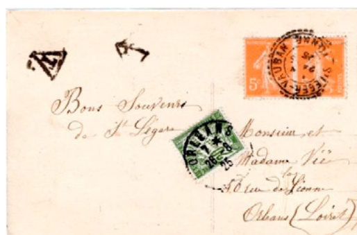
Carte postale postée le 24 août 1925 à Saint-Léger-Vauban (Yonne) à destination d'Orléans (Loiret). Affranchie à 10c avec deux timbres-poste à 5c au type Semeuse (YT 158). Le tarif des cartes postales 5 mots était de 15c depuis le 16 juillet 1925, insuffisance de 5c mais taxe de 20c, taxe minimale en vigueur depuis le 25 mars 1924.