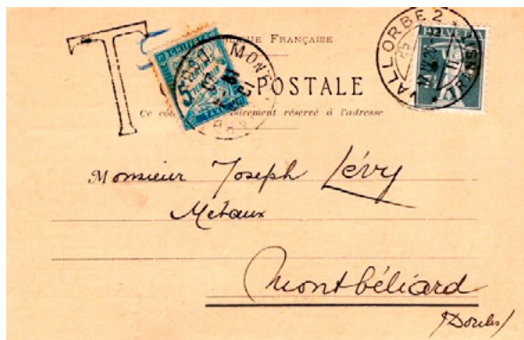
Carte postale postée le 17 avril 1920 à Vallorbe (Vaud, Suisse) à destination de Montbéliard (Doubs).

Affranchies à 7½c avec un timbre-poste au type Fils de Tell (YT 160), 7½c était le tarif intérieur suisse pour les cartes postales. Taxée au départ, T et 5 manuscrit. Taxée à l'arrivée à 5c avec un chiffre-taxe au type Duval (YT 28). Le tarif suisse pour une carte postale pour l'étranger était de 10c, insuffisance de 2½c, donc taxe de 5c. Il y avait parité franc français/franc suisse en 1920. Rare utilisation du chiffre-taxe à 5c seul dans les années 1920.