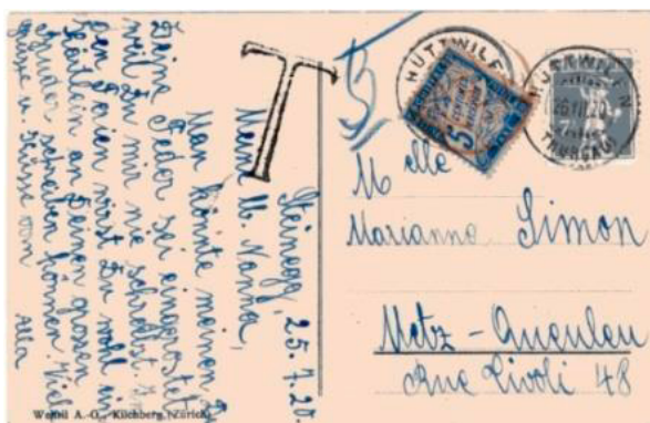
Carte postale postée le 26 juillet 1920 à Huttwilen (Thurgovie, Suisse) à destination de Metz (Moselle).

Ce chiffre-taxe ne pouvait être utilisé seul que dans les rares cas d'objets provenant de l'étranger et pour des insuffisances inférieures à 3c. De plus, une telle utilisation du chiffre-taxe à 5c seul n'a théoriquement pu avoir lieu qu'en 1920 et jusqu'au 1 er avril 1921, date d'entrée en vigueur du minimum de taxation de 30c pour les objets provenant de l'étranger.