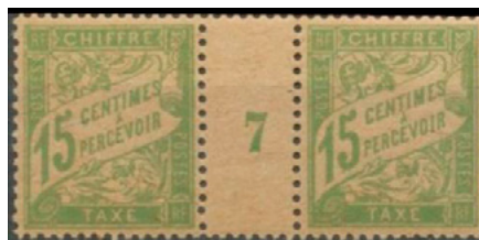
Millésime 7 GC de 1917

Jusqu'en 1906, il servait à la taxation simple des lettres non affranchies de 20g ou moins expédiées par des institutions officielles. Suite au changement de tarif de 1906 abaissant le tarif de ces lettres du service intérieur de 15 à 10c, il devint quasiment inutile et son impression a cessé dès 1905 en prévision de ce changement.