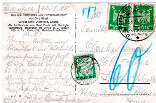
Carte postale postée le 23 août 1926 en Allemagne à destination de Metz (Moselle). Affranchie à 10pfg avec deux timbres-poste au type aigle héraldique (YT 349). Taxée au départ, T et 10 manuscrits. Le tarif des cartes postales pour l'étranger était de 15pfg depuis le 1 er janvier 1925. Taxée à l'arrivée à 60c avec un chiffre-taxe au type Duval (YT 38). Insuffisance de 5pfg, mais taxe minimale de 60c en vigueur depuis le 1 er août 1926.