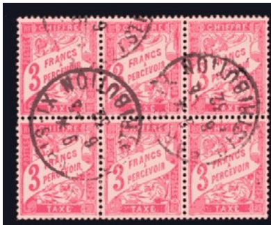
Bloc de 6 du chiffre-taxé à 3fr au type Duval (YT 42A) Oblitéré du 6 avril 1932 Paris IX Distribution

Lors de son émission, le chiffre-taxé à 3fr avait pour but principal le paiement de taxes de douane pour des envois transitant par la poste. En 1926, seul il pouvait servir à la taxation des lettres de 20g ou moins non affranchies provenant de l'étranger. Il n'avait pas réellement d'autres applications et c'est probablement la raison pour laquelle il n'a pas été réimprimé avant 1936. Son utilisation est restée rare au cours des années 1920.