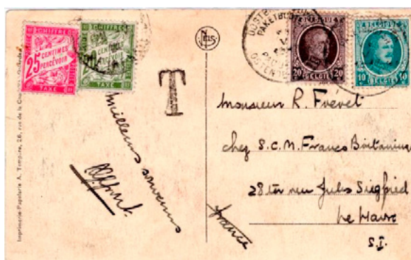
Carte postale postée en mai 1924 à Ostende (Belgique) à destination du Havre (Seine-Inférieure). Affranchie à 30c avec deux timbres-poste au type Albert 1 er , un à 10c (YT 194) et un à 20c (YT 196). Taxée au départ, T, le tarif des cartes pour la France étant alors de 45c. Taxée à 45c à l'arrivée, car un minimum de taxe de 45c était en vigueur depuis le 1 er avril 1924 pour les objets provenant de l'étranger. Taxée avec deux chiffres-taxe au type Duval, un à 20c (YT 31) et un à 25c (YT 32), le chiffre-taxe à 45c ne sera mis en service que le 5 juillet 1924.