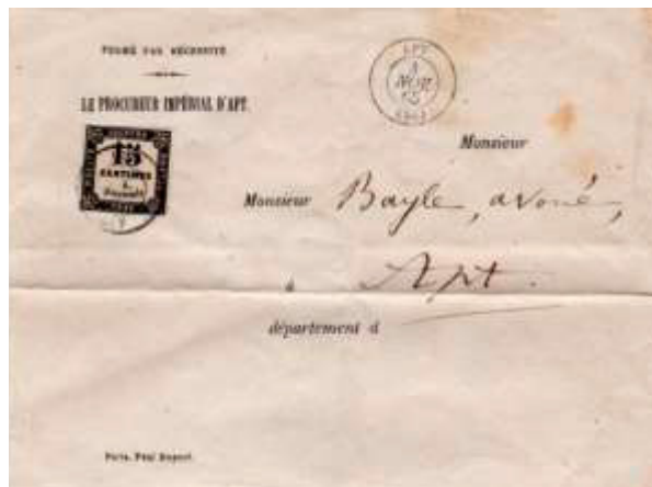
Lettre locale postée le 4 novembre 1865 à Apt (86, Vaucluse). Non affranchie, taxée à la distribution le 5 novembre au moyen d'un timbre-taxe noir à 15c (YT 3), au tarif des lettres locales non affranchies du 1 er janvier 1863.

Pendant les années 1870 et 1871, la France traversera une période plus qu'agitée de son histoire, guerre avec la Prusse, Siège de Paris, Commune de Paris, perte de l'Alsace-Moselle, entre autres. Ceci conduira à une situation postale inédite et compliquée. L'étude de cette période fera l'objet dans un autre texte.