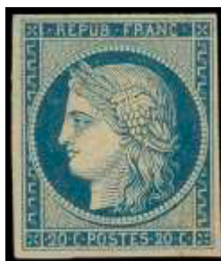
YT 8, non émis

Dès le début, la couleur noire du 20c est remise en question en raison de la possible réutilisation de timbres mal oblitérés sur lesquels l'oblitération, noire sur noire, pouvait ne pas bien se voir. Dès le mois de février 1849, il est question de remplacer le 20c noir par un 20c bleu et l'impression du 20c noir est arrêtée en mars 1849. Des timbres bleus seront produits mais ne seront jamais mis en vente (YT 8). Il faudra attendre le changement de tarif suivant pour voir le timbre du 1 er échelon de poids des lettres de bureau à bureau émis en bleu.