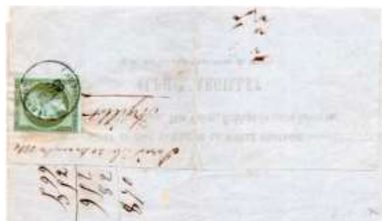
Avis de passage posté le 4 novembre 1860 à Alençon (61, Orne). Expédié sous bande (bande absente), affranchie au tarif de 1c avec un timbre au type EMPIRE FRANC (YT 11), au tarif du 1 er échelon des avis sous bande du 1 er août 1856.