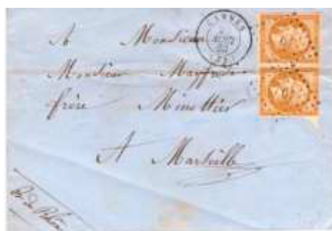
Lettre postée le 20 août 1860 à Cannes (87, Alpes-Maritimes), ancien cachet d'oblitération du département du Var (78). Affranchie à 20c avec deux timbres au type EMPIRE FRANC (YT 13), au tarif du 1 er échelon des lettres de bureau à bureau du 1 er juillet 1854.

Lors du rattachement du Comté de Nice à la France, le département des Alpes-Maritimes (numéro 87) a été créé en y joignant une partie du département du Var (78), l'arrondissement de Grasse comportant notamment les villes principales de Cannes, Antibes et Grasse. Si les cachets d'oblitération des villes de l'ancien Comté de Nice ont vite fait leur apparition, ceux des villes de la partie détachée du Var ne l'ont été que tardivement, pour la plupart seulement en 1862.