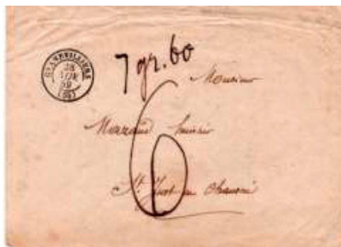
Lettre postée le 28 novembre 1859 à Grandvilliers (58, Oise) à destination de Saint-Just-en-Chaussée (58, Oise). Lettre non affranchie et taxée à 60c (6 décimes manuscrit), au tarif du 2 ème échelon (7,6g, le 1 er échelon s'arrête à 7,5g) des lettres de bureau à bureau non affranchies du 1 er juillet 1854.