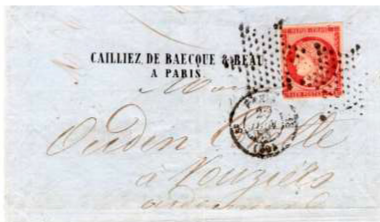
Lettre postée le 25 juin 1853 à Paris (60) à destination de Vouziers (7, Ardennes). Affranchie à 1fr avec un timbre au type Cérès (YT 6), au tarif du 3 ème échelon des lettres de bureau à bureau du 1 er janvier 1849.