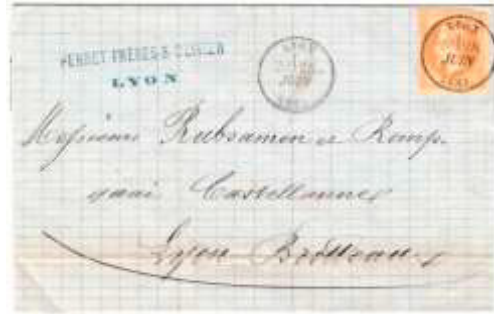
Lettre locale postée le 25 juin 1870 à Lyon (68, Rhône). Affranchie à 10c avec un timbre au type Empire lauré (YT 28), au tarif des lettres locales du 1 er avril 1830.