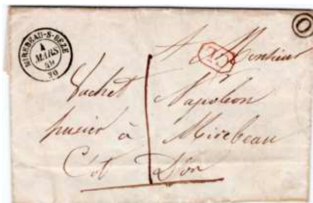
Lettre locale postée à Mirebeau-sur-Bèze (20, Côte-d'Or) le 4 mars 1849. Lettre non affranchie faute de timbre-poste à 10c, un tel timbre ne sera disponible qu'en septembre 1850. Taxée au tarif des lettres locales du 1 er avril 1830, chiffre manuel 1 pour 1 décime. La marque encadrée CL indique une correspondance locale.

*Comme on peut le constater, il n'a pas été prévu à l'origine de timbres pour des tarifs parmi les plus courants, 5 centimes (avis sous forme de lettre ouverte), 10 centimes (lettres pour une même commune ou locales) ou 15 centimes (lettres de Paris à Paris).