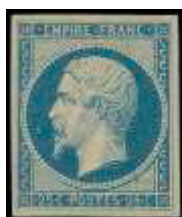
3 décembre 1853 (YT 15)