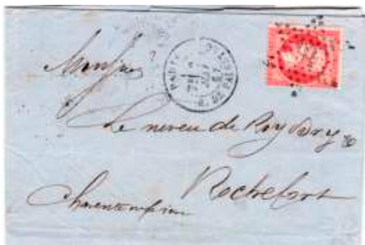
Lettre postée le 2 mai 1867 à Paris (60) à destination de Rochefort-sur-Mer (16, Charente-inférieure). Affranchie à 80c avec un timbre au type EMPIRE FRANC (YT 24), au tarif du 3 ème échelon des lettres de bureau à bureau du 1 er juillet 1854.