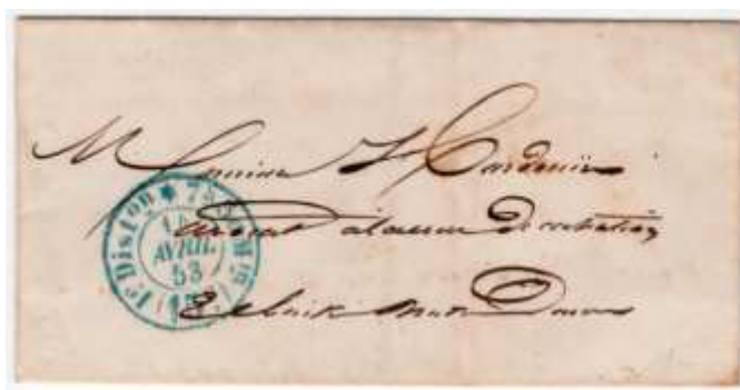
Lettre du 14 avril 1853 de Paris pour Paris. Lettre non affranchie, taxée au moyen d'un cachet double cercle de Paris, « 1 ère Dist on * 7 h 30 in (15 c ) 14 AVRIL 53 », au tarif du 1 er échelon de poids du 24 avril 1806.