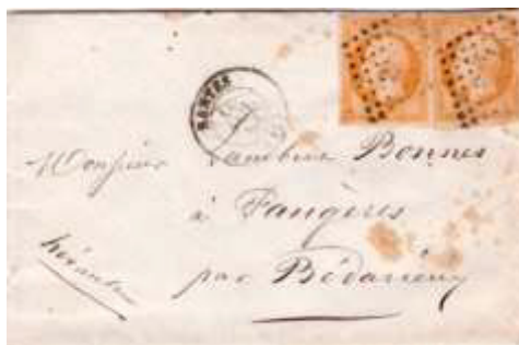
Lettre postée le 18 novembre 1858 à Nantes (42, Loire-Atlantique) à destination de Bédarieux (33, Hérault). Affranchie avec deux timbres à 10c au type EMPIRE FRANCO (YT 13), au tarif du 1 er échelon des lettres de bureau à bureau du 1 er juillet 1854.