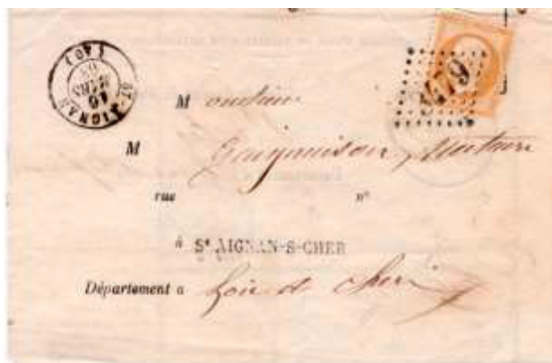
Avis de réception d'un envoi postal posté le 15 mars 1863 à Nantes (42, Loire-Inférieure) à destination de Saint-Aignan-sur-Cher (GC 3479, 40, Loir-et-Cher). Affranchi à 10c avec un timbre au type EMPIRE FRANCOIS (YT 13B), au tarif des avis de réception du 6 juillet 1859.