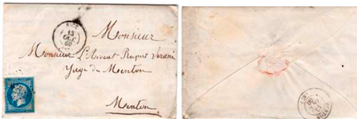
Lettre postée le 13 octobre 1860 à Nice (PC 4226, 87, Alpes-Maritimes) à destination de Menton, cachet au dos Menton (87). Affranchie à 20c avec un timbre au type EMPIRE FRANC (YT 14), au tarif du 1 er échelon des lettres de bureau à bureau du 1 er juillet 1854.

Le 14 juin 1860, le Comté de Nice devient le département des Alpes-Maritimes (numéro 87), avec une partie détachée du Var. Les villes de Menton et de Roquebrune-Cap-Martin, détachées de la Principauté de Monaco en 1848, avaient un statut spécial. Elles ne seront officiellement incorporées que le 2 février 1861 (bureau français à l'étranger), bien que des cachets d'oblitération français portant le numéro 87 du département des Alpes-Maritimes aient rapidement été mis en service.