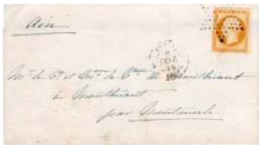
Avis de naissance posté le 8 février 1854 à Paris (60) à destination de Montbriant (1, Ain). Affranchi à 10c avec un timbre au type EMPIRE FRANC (YT 13), au tarif du 1 er échelon des avis sous enveloppe ouverte du 1 er janvier 1828.