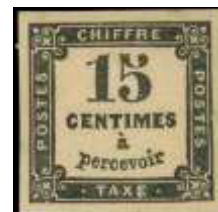
Chiffre-taxe à 15 centimes (YT 3) imprimé en lithographie, émis le 2 mai 1864. Extrémités arrondies du 1, impression du à sans défaut.