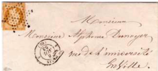
Lettre locale postée le 8 novembre 1853 à Paris (60). Affranchie à 10c avec un timbre au type Présidence (YT 9), au tarif du 1 er échelon des lettres affranchies de Paris à Paris du 1 er juillet 1853.

D'autres timbres aux mêmes valeurs que ceux de la série précédente auraient dû être mis en vente, mais la proclamation du Second Empire dès le 2 décembre 1852 en a décidé autrement. Une série de timbres avec légende EMPIRE FRANC au lieu de REPUB FRANC sera émise à leur place. Ces deux timbres ont donc eu une utilisation très limitée et sont relativement rares sur lettres.