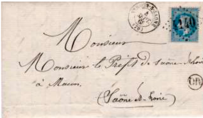
Lettre postée le 4 septembre 1868 à Verdun-sur-Saône (GC 4140, 70, Saône-et-Loire) à destination de Mâcon (70, Saône-et-Loire). Affranchie à 20c avec un timbre au type Empire lauré (YT 29), au tarif du 1 er échelon des lettres de bureau à bureau du 1 er juillet 1854.