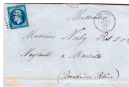
Lettre postée le 17 janvier 1862 à Grasse (87, Alpes-Maritimes) à destination de Marseille (12, Bouches-du-Rhône). Affranchie à 20c avec un timbre au type EMPIRE FRANC (YT 14), au tarif du 1 er échelon des lettres de bureau à bureau du 1 er juillet 1854.

Dans les deux cas, ce sont toujours les anciens cachets d'oblitération du Var (78) qui sont encore utilisés.