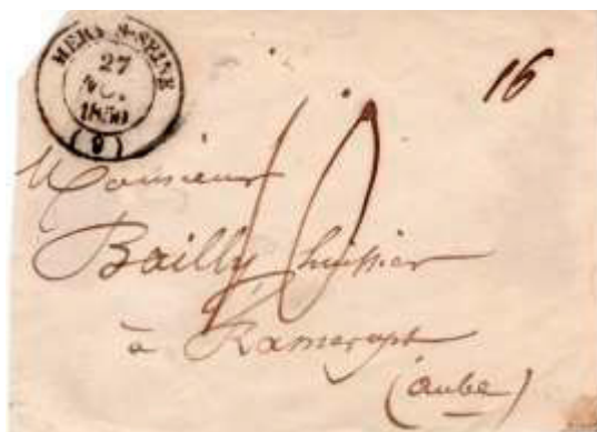
Lettre postée le 27 novembre 1850 à Méry-sur-Seine (9, Aube) à destination de Ramerupt (9, Aube). Lettre de 16g non affranchie, donc taxée à 1fr, 10 (décimes) inscrit à la main, au tarif du 3 ème échelon des lettres de bureau à bureau du 1 er juillet 1850.