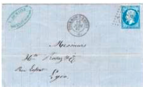
Lettre postée le 16 juin 1868 à Tournon-sur-Rhône (68, Rhône) à destination de Lyon (68, Rhône). Affranchie à 20c avec un timbre au type EMPIRE FRANC (YT 22), au tarif du 1 er échelon des lettres de bureau à bureau du 1 er juillet 1854.