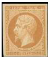
Décembre 1853 (YT 13)

Quatre valeurs sont mises en vente en 1853 en remplacement des quatre valeurs courantes aux types Cérés et RÉPUB FRANC.