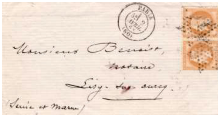
Lettre postée le 2 avril 1868 à Paris (60) à destination de Lisy-sur-Ourcq (73, Seine-et-Marne). Affranchi à 20c avec deux timbres au type Empire lauré (YT 28) au tarif du 1 er échelon des lettres de bureau à bureau du 1 er juillet 1854.