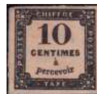
Chiffre-taxe à 10 centimes (YT 2), imprimé en typographie, extrémités du 1 arrondies, émis en mars 1861

Il n'y a toujours pas de surtaxe pour les lettres locales non affranchies, comme cela est pourtant le cas depuis 1853 pour les lettres de Paris pour Paris et depuis 1854 pour les lettres de bureau à bureau.