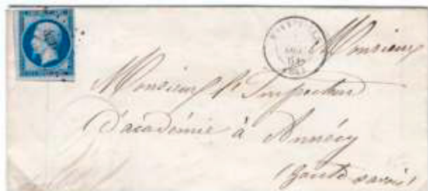
Lettre postée le 1 er décembre 1861 à Bonneville (PC 4202, 89, Haute-Savoie) à destination d'Annecy (89, Haute-Savoie). Affranchie à 20c avec un timbre au type EMPIRE FRANC (YT 14A), au tarif du 1 er échelon des lettres de bureau à bureau du 1 er juillet 1854.