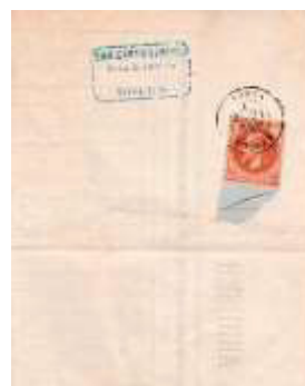
Avis posté sous bande le 21 mars 1870 à Rouen (Seine-inférieure). Affranchi à 2c avec un timbre du type Empire lauré (YT26) au tarif du 2 ème échelon des avis sous bande du 1 er août 1856.