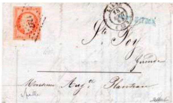
Lettre postée à Lille (PC 1727, 57, Nord) à destination de Sainte-Foy-la-Grande (32, Gironde). Affranchie à 40c avec un timbre au type EMPIRE FRANC (YT 16b), au tarif du 2 ème échelon des lettres de bureau à bureau du 1 er juillet 1854.