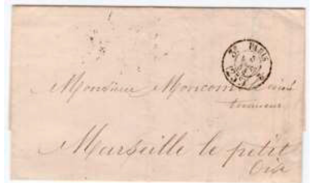
Lettre postée le 5 mars 1854 à Paris à destination de Marseille-le-Petit (58, Oise). Affranchie au départ de Paris au moyen d'un cachet double cercle « 3 e PARIS 2 (25c) 5 MARS 54 », au tarif du 1 er échelon des lettres de bureau à bureau du 1 er juillet 1850.