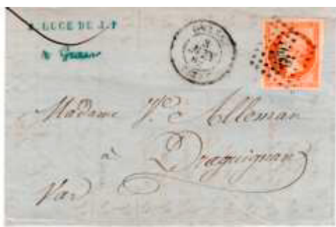
Lettre postée le 3 juin 1862 à Grasse (87, Alpes-Maritimes) à destination de Draguignan (78, Var), avant le 14 juin 1860, ces deux villes se trouvaient dans le Var. Affranchie à 40c avec un timbre au type EMPIRE FRANC (YT 16), au tarif du 2 ème échelon des lettres de bureau à bureau du 1 er juillet 1854.