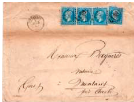
Lettre postée le 4 avril 1865 à Versailles (GC 4158, 74, Seine-et-Oise) à destination de Montaut (31, Gers). Affranchie à 80c avec quatre timbres au type EMPIRE FRANC (YT 22) au tarif du 3 ème échelon des lettres de bureau à bureau du 1 er juillet 1854.