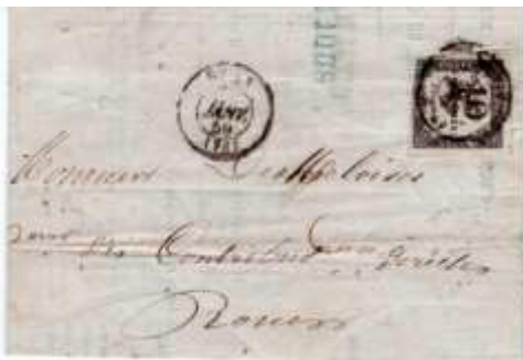
Lettre locale postée le 23 janvier 1859 à Rouen. Non affranchie et taxée à 10c avec un chiffre-taxe noir (YT 1), au tarif du 1 er échelon des lettres locales du 1 er avril 1830.

Il n'y a toujours pas de surtaxe pour les lettres locales non affranchies, comme cela est pourtant le cas depuis 1853 pour les lettres de Paris pour Paris et depuis 1854 pour les lettres de bureau à bureau.