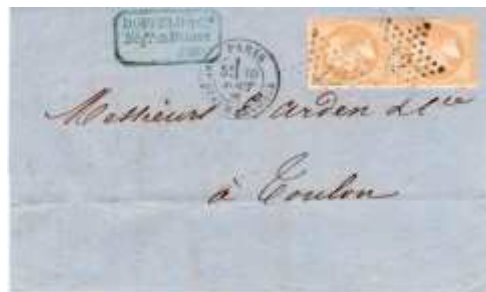
Lettre postée le 30 août 1866 à Paris (60) à destination de Toulon-sur-Mer (78, Var). Affranchie à 20c avec deux timbres au type EMPIRE FRANC (YT 21d), au tarif du 1 er échelon des lettres de bureau à bureau du 1 er juillet 1854.