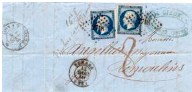
Lettre postée le 13 mars 1866 à Romans (PC 2718, 25, Drôme) à destination de Remoulins (29, Gard). Affranchie à 40c avec deux timbres au type EMPIRE FRANC (YT 14). Taxée (chiffre manuscrit 8) pour dépassement de poids, 16 g au lieu de 15. La lettre est considérée non affranchie, donc taxée à 1,20 franc, moins les 40c soit 80c à payer (8 décimes).