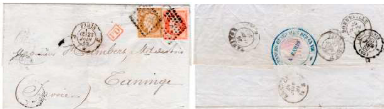
Lettre postée à Paris le 23 juin 1859 à destination de Taninge (Savoie, États sardes). Affranchie à 50c avec deux timbres au type EMPIRE FRANC (YT 13A et 16), au tarif du 1 er échelon des lettres pour les États sardes du 1 er juillet 1851. Au verso, cachet Paris (60) du 23 juin, cachet ambulant Paris à Lyon du 23 juin, cachet sarde Annecy du 24 juin, cachet sarde Bonneville du 25 juin et cachet sarde Taninge du 25 juin.

Lors de son rattachement à la France, le Duché de Savoie est donc scindé en deux départements, la Savoie (numéro 88) et la Haute-Savoie (numéro 89). Après la Convention de Milan en mars et les référendums qui ont suivi, ces deux territoires sont toujours considérés étrangers et ce sont les tarifs postaux pour les États sardes qui continueront de s'y appliquer jusqu'au 13 juin.