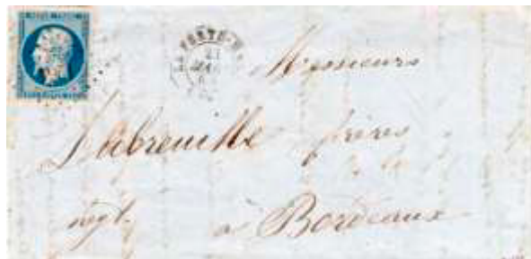
Lettre postée le 23 mars 1854 à La Ferté-Macé (59, Orne) à destination de Bordeaux (32, Gironde). Affranchie à 25c avec un timbre au type Présidence (YT 10), au tarif du 1 er échelon des lettres de bureau à bureau du 1 er juillet 1850.