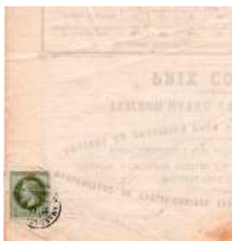
Avis posté sous bande le 18 juillet 1871 à Saint-Amand-les-Eaux (Nord). Affranchi à 1c avec un timbre au type Empire lauré (YT 25) au tarif du 1 er échelon des avis sous bande du 1 er août 1856.

Comme on peut le voir, cette série ne comporte pas de timbre à 5c. Un timbre à cette valeur avait été prévu, mais de multiples retards ont fait qu'il est resté à l'état d'épreuve. C'est le 5c vert de la série précédente (YT 20) avec légende EMPIRE FRANC, qui continuera d'être imprimé jusqu'en 1872.