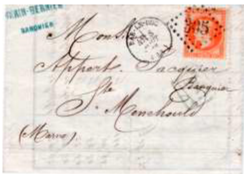
Lettre postée le 8 août 1872 à Bar-le-Duc (GC 305, 52, Meuse) à destination de Sainte-Menehould (49, Marne). Affranchie à 40c avec un timbre au type Empire lauré (YT 31), utilisation tardive, au tarif du 2 ème échelon des lettres de bureau à bureau du 1 er septembre 1871.