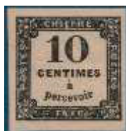
Chiffre-taxe à 10 centimes (YT 2A), imprimé en typographie, extrémités du 1 droite, émis en février 1859.