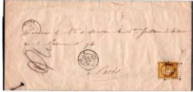
Avis de décès posté le 30 novembre 1852 à Vitry (PC 3658, 34, Ille-et-Vilaine) à destination de Paris (60). Affranchie à 10c avec un timbre au type Cérès (YT 1), au tarif du 1 er échelon des avis sous enveloppe ouverte du 1 er février 1828.