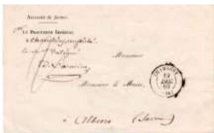
Lettre postée le 19 décembre 1860 à Chambéry (88, Savoie) à destination d'Albens (88, Savoie). Lettre officielle du Procureur impérial dispensée d'affranchissement, oblitérée avec un nouveau cachet des Postes françaises.