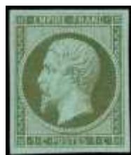
Timbre-poste à 1c au type EMPIRE FRANC, non dentelé émis seulement le 1 er novembre 1860 (YT 11).

À noter qu'au 1 er août 1856, il n'existe pas de timbre-poste à 1 centime pour satisfaire au tarif des avis expédiés sous bande, le premier timbre français, au type EMPIRE FRANC, à 1 centime ne sera émis que le 1 er novembre 1860.