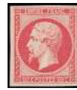
4 décembre 1854 (YT 17)