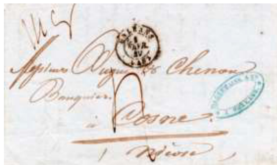
Lettre postée le 1 er février 1849 à Orléans (43, Loiret) à destination de Cosne (56, Nièvre). Lettre non affranchie, taxée à 40c (inscription manuelle 4 (décimes)), au tarif du 2 ème échelon (14g) des lettres de bureau à bureau du 1 er janvier 1849.