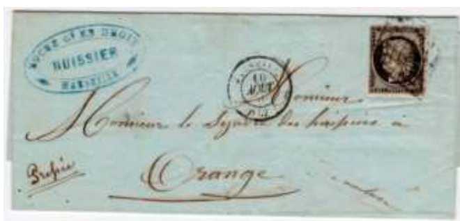
Lettre postée le 10 août 1849 à Marseille (12, Bouches-du-Rhône) à destination d'Orange (86, Vaucluse), affranchie à 20c avec un timbre-poste au type Cérès (YT 3), au tarif du 1 er échelon des lettres de bureau à bureau du 1 er janvier 1849.