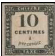
Chiffre-taxe à 10 centimes (YT 1), imprimé en lithographie, émis le 1 er janvier 1859.

En raison du délai très court entre l'ordre de création et la mise en vente le 1 er janvier 1859, un premier chiffre-taxe à 10 centimes (YT 1) est imprimé en lithographie à l'Imprimerie Impériale. Il sera vite remplacé par un timbre imprimé en typographie, première date connue d'utilisation le 19 février 1859.