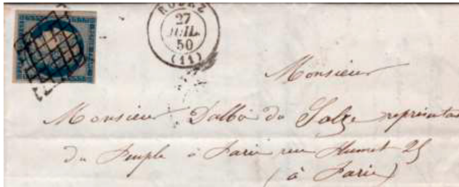
Lettre postée le 27 juillet 1850 à Rodez (11, Aveyron) pour Paris. Affranchie à 25c avec un timbre au type Cérès (YT 4), au tarif du 1 er échelon des lettres de bureau à bureau du 1 er juillet 1850. Au dos, cachet double cercle Paris (60) 30 JUIL 50.