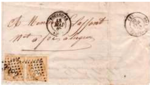
Lettre postée le 18 mai 1866 à Toulouse (GC 3982, 30, Haute-Garonne) à destination de Foix-sur-Ariège (8, Ariège). Affranchie à 20c avec deux timbres au type EMPIRE FRANC (YT 21), au tarif du 1 er échelon des lettres de bureau à bureau du 1 er juillet 1854.