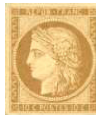
11 septembre 1850