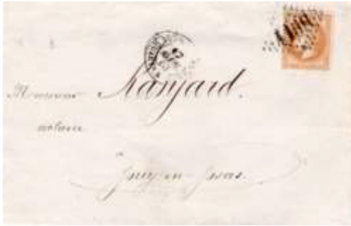
Avis (faire part de mariage) sous enveloppe ouverte postée le 17 avril 1868 à Versailles (GC 4158, 74, Seine-et-Oise) à destination de Jouy-en-Josas (74, Seine-et-Oise). Affranchi à 10c avec un timbre au type Empire lauré (YT 28) au tarif du 1 er échelon des avis sous enveloppe ouverte de bureau à bureau du 1 er août 1856.