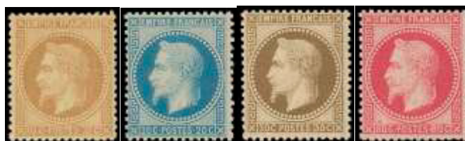
Octobre 67 Avril 67 Janvier 67 Octobre 67