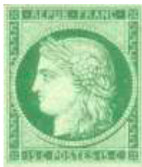
29 juillet 1850