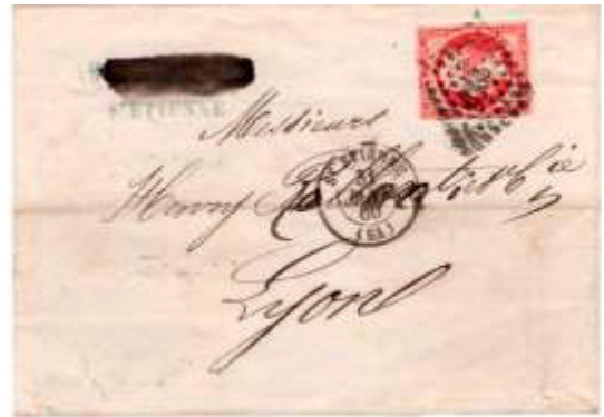
Lettre postée le 8 avril 1857 à Agen (45, Lot-et-Garonne) à destination de Port-de-Pascau (45, Lot-et-Garonne). Affranchie à 80c avec un timbre au type EMPIRE FRANC (YT 17), au tarif du 3 ème échelon des lettres de bureau à bureau du 1 er juillet 1854