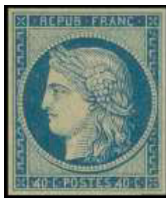
YT 5B, non émis

Dès le début, la couleur noire du 20c est remise en question en raison de la possible réutilisation de timbres mal oblitérés sur lesquels l'oblitération, noire sur noire, pouvait ne pas bien se voir. Dès le mois de février 1849, il est question de remplacer le 20c noir par un 20c bleu et l'impression du 20c noir est arrêtée en mars 1849. Des timbres bleus seront produits mais ne seront jamais mis en vente (YT 8). Il faudra attendre le changement de tarif suivant pour voir le timbre du 1 er échelon de poids des lettres de bureau à bureau émis en bleu.