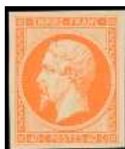
Décembre 1853 (YT 16)