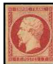
Août 1853 (YT 18)

L'utilisation du timbre à 25 centimes sera de courte durée, moins de 7 mois, puisque le tarif du 1 er échelon de poids des lettres de bureau à bureau sera abaissé à 20 centimes dès le 1 er juillet 1854.