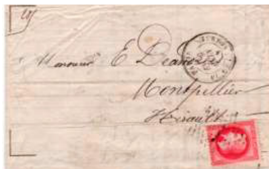
Lettre postée le 9 juin 1870 à Paris (60) à destination de Montpellier (33, Hérault). Affranchie à 80c avec un timbre au type Empire lauré (YT 32), au tarif du 3 ème échelon des lettres de bureau à bureau du 1 er juillet 1854.