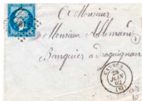
Lettre postée le 28 juin 1862 à Cannes (87, Alpes-Maritimes) à destination de Draguignan (78, Var), avant le 14 juin 1860, ces deux villes se trouvaient dans le Var. Affranchie à 20c avec un timbre au type EMPIRE FRANC (YT 14), au tarif du 1 er échelon des lettres de bureau à bureau du 1 er juillet 1854.