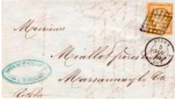
Lettre locale postée le 5 novembre 1850 à Dijon (20, Côte-d'Or) à destination de Marsannay-la-Côte (Côte-d'Or). Affranchie au tarif de 10c avec un timbre au type Cérès (YT 1), au tarif du 1 er échelon des lettres locales du 1 er avril 1830.