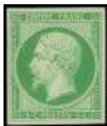
24 novembre 1854 (YT 12)