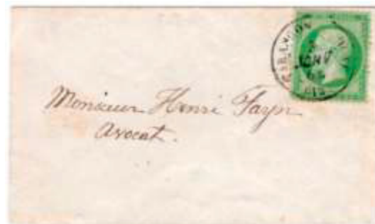
Avis local posté le 3 janvier 1864 à Tarascon. Affranchi à 5c avec un timbre au type EMPIRE FRANCOIS (YT 20), au tarif du 1 er échelon des avis divers locaux sous enveloppe ouverte du 1 er août 1856.