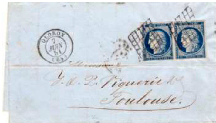
Lettre postée le 7 juin 1851 à Oloron (64, Pyrénées-Orientales) à destination de Toulouse (30, Haute-Garonne). Affranchie à 50c avec deux timbres au type Cérès (YT 4), faute de timbres-poste à 50c, au tarif du 2 ème échelon des lettres de bureau à bureau du 1 er juillet 1850.