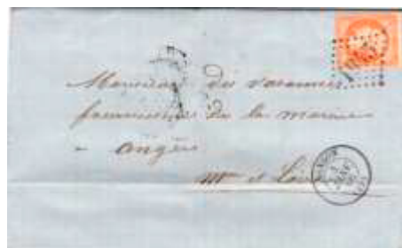
Lettre postée le 4 janvier 1866 à Langon (GC 1945, 32, Gironde) à destination d'Angers (47, Maine-et-Loire). Affranchie à 40c avec un timbre au type Empire Franc (YT 23) au tarif du 2 ème échelon des lettres de bureau à bureau du 1 er juillet 1854.