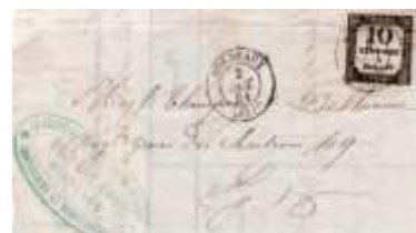
Lettre locale postée le 2 octobre 1861 à Bordeaux (32, Gironde). Lettre non affranchie et taxée à 10c avec un chiffre-taxe noir (YT 2) au tarif du 1 er échelon des lettres locales du 1 er avril 1830.