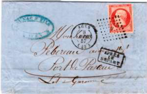
Lettre postée le 31 janvier 1860 à Saint-Étienne (84, Loire) à destination de Lyon (68, Rhône). Affranchie à 80c avec un timbre au type EMPIRE FRANC (YT 17), au tarif du 3 ème échelon des lettres de bureau à bureau du 1 er juillet 1854.