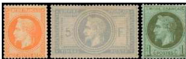
Juillet 68 Novembre 69 Mai 70

Comme on peut le voir, cette série ne comporte pas de timbre à 5c. Un timbre à cette valeur avait été prévu, mais de multiples retards ont fait qu'il est resté à l'état d'épreuve. C'est le 5c vert de la série précédente (YT 20) avec légende EMPIRE FRANC, qui continuera d'être imprimé jusqu'en 1872.