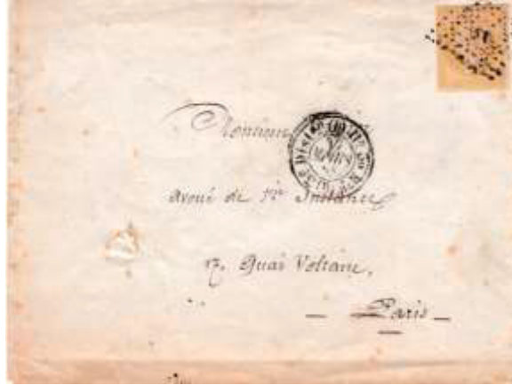
Lettre postée le 17 mars 1858 à Paris pour Paris. Affranchie à 10c avec un timbre au type EMPIRE FRANC (YT 13Aa, jaune citron) (cachet double cercle « 3 e Dist on (D) 11 h 30 M m (D) 17 MARS 58 », au tarif du 1 er échelon des lettres de Paris pour Paris du 1 er juillet 1853.