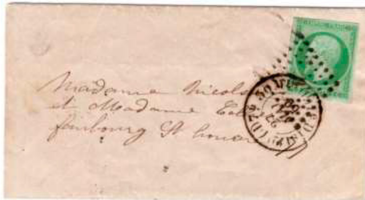
Avis de naissance posté le 27 mai 1859 à Paris (60) pour Paris. Affranchi à 5c avec un timbre au type EMPIRE FRANC vert (YT 12), au tarif du 1 er échelon des avis locaux sous enveloppe ouverte du 1 er août 1856.

Ce tarif restera en vigueur jusqu'au 31 août 1871.