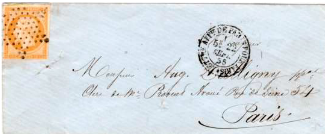
Lettre postée le 22 septembre 1855 à Paris pour Paris. Affranchie à 10c avec un timbre au type EMPIRE FRANC. (YT 13A, bistre) (cachet double cercle « Lettre Aff ée de Paris pour Paris 5c 22 SEPT. 55 »), au tarif du 1 er échelon des lettres de Paris pour Paris du 1 er juillet 1853.