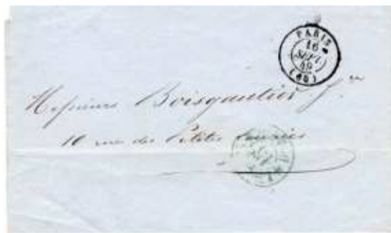
Lettre du 16 septembre 1849 de Paris pour Paris. Lettre non affranchie, faute de timbre-poste, taxée au moyen d'un cachet double cercle « Levée .... * D on de 7½ M * (15 c ) », au tarif du 1 er échelon de poids du 24 avril 1806.