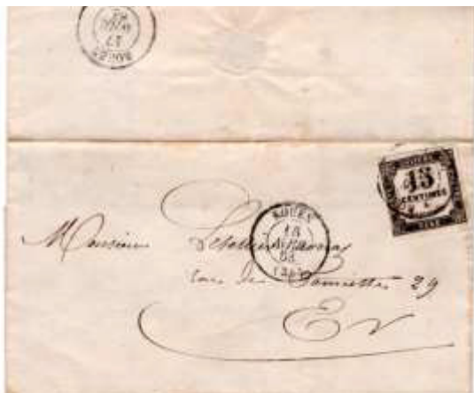
Lettre locale postée le 16 avril 1863 à Rouen (74, Seine-Inférieure). Non affranchie, taxée à la distribution le 17 avril avec un chiffre-taxe noir à 15c (YT 3B), au tarif des lettres locales non affranchies du 1 er janvier 1863.