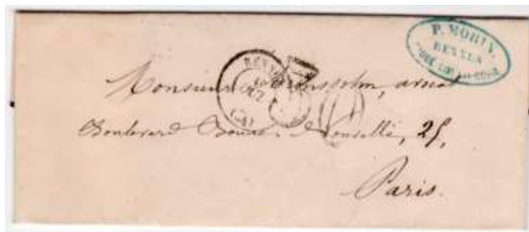
Lettre postée le 18 octobre 1854 à Rennes (34, Ille-et-Vilaine) à destination de Paris (60). Au dos, cachet double cercle Paris (60) du 19 octobre 1854. Lettre non affranchie et taxée à 30c l'arrivée au moyen d'un cachet chiffre-taxe double trait, au tarif du 1 er échelon des lettres de bureau à bureau non affranchies du 1 er juillet 1854.