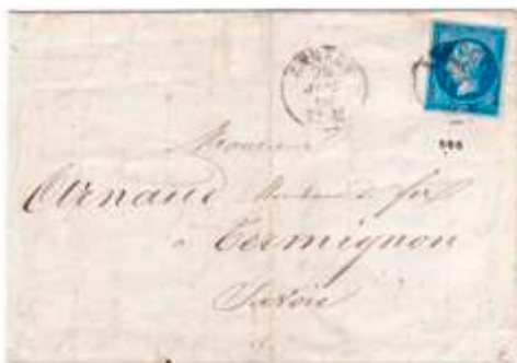
Lettre postée le 24 juin 1860 à Annecy (Haute-Savoie) à destination de Termignon (Savoie). Affranchie à 20c avec un timbre au type EMPIRE FRANC (YT 14A), au tarif du 1 er échelon des lettres de bureau à bureau du 1 er juillet 1854. Oblitérée au moyen d'un cachet des États sardes, en attendant l'arrive de cachets de la poste française. À noter que ces deux anciennes villes du Duché de Savoie se retrouvent maintenant dans des départements différents.

À partir du 14 juin, les correspondances de l'ancien Duché de Savoie sont soumises aux tarifs français. Néanmoins, il faudra plusieurs mois avant que les cachets d'oblitération des États sardes disparaissent.