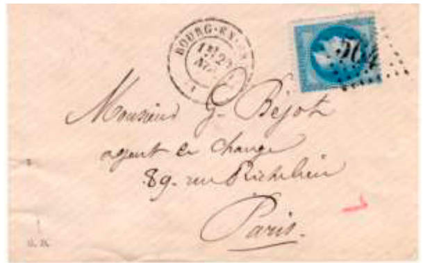
Lettre postée le 29 novembre 1868 à Bourg-en-Bresse (GC 564, 1, Ain) à destination de Paris (60). Affranchie à 20c avec un timbre au type Empire lauré (YT 29) au tarif du 1 er échelon des lettres de bureau à bureau du 1 er juillet 1854.