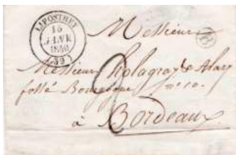
Lettre postée le 15 janvier 1849 à Liposthey (39, Landes) à destination de Bordeaux (32, Gironde). Lettre du 1 er échelon de poids (7½g) non affranchie, taxée à 20c (inscription manuelle 2 (décimes)), au tarif du 1 er échelon des lettres de bureau à bureau du 1 er janvier 1849.