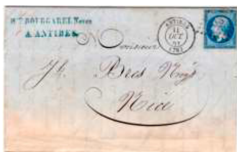
Lettre postée le 11 octobre 1861 à Antibes (87, Alpes-Maritimes) à destination de Nice (Alpes-Maritimes). Affranchie à 20c avec un timbre au type EMPIRE FRANC (YT 14), au tarif du 1 er échelon des lettres de bureau à bureau du 1 er juillet 1854.