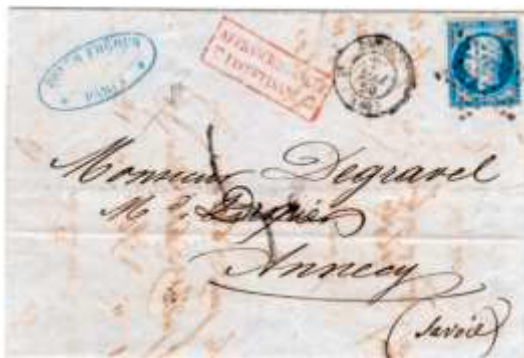
Lettre postée le 2 mai 1860 à Paris (60) à destination d'Annecy (Savoie, États sardes). Affranchie à 20c avec un timbre au type EMPIRE FRANC (YT 14), au tarif du 1 er échelon des lettres de bureau à bureau du 1 er juillet 1854. Affranchissement jugé insuffisant Annecy ne faisant pas encore officiellement partie de la France et ne bénéficiant donc pas du tarif du service intérieur, elle ne le sera que le 14 juin suivant et deviendra le chef-lieu de la Haute-Savoie (89).

À partir du 14 juin, les correspondances de l'ancien Duché de Savoie sont soumises aux tarifs français. Néanmoins, il faudra plusieurs mois avant que les cachets d'oblitération des États sardes disparaissent.