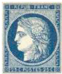
1 er juillet 1850

Ce même mois, un timbre à 15 centimes (YT 2) est finalement mis en vente pour les lettres du 1 er échelon de poids de Paris à Paris. Un timbre à 10 centimes (YT 1) pour les lettres locales du 1 er échelon de poids suivra en septembre de la même année.