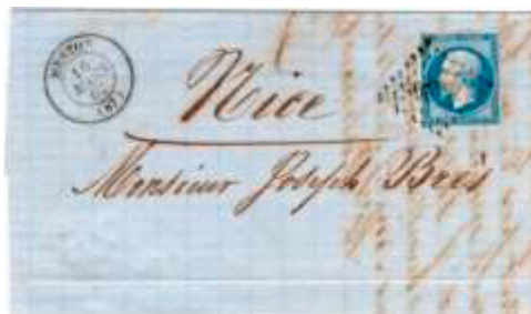
Lettre postée le 16 mars 1862 à Menton (PC 4220, 87, Alpes-Maritimes) à destination de Nice (87, Alpes-Maritimes). Affranchie à 20c avec un timbre au type EMPIRE FRANC (YT 14), au tarif du 1 er échelon des lettres de bureau à bureau du 1 er juillet 1854.