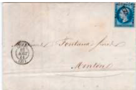
Lettre postée le 10 août 1861 à Nice (PC 4226, 87, Alpes-Maritimes) à destination de Menton (87, Alpes-Maritimes), cachet au dos du 10 août. Affranchie à 20c avec un timbre au type EMPIRE FRANC (YT 14), au tarif du 1 er échelon des lettres de bureau à bureau du 1 er juillet 1854.