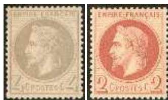
Décembre 62 Août 63

Neuf valeurs, de 1 centime à 5 francs, avec la nouvelle effigie seront mises en vente progressivement, de décembre 1862 à mai 1870. Le timbre à 5 francs émis en novembre 1869 est d'un format nouveau beaucoup plus grand.