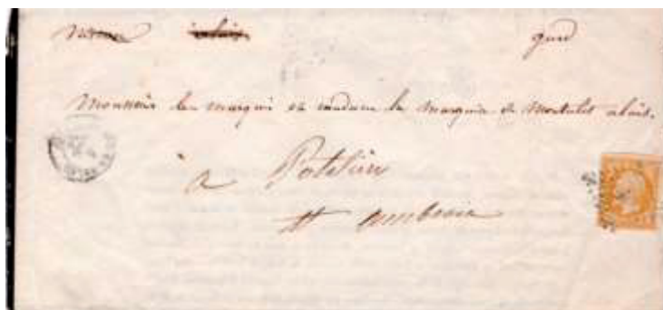
Avis de décès posté le 6 décembre 1856 à Alais-en-Velay (29, Gard) à destination de Saint-Ambroix (29, Gard). Affranchi à 10c avec un timbre au type EMPIRE FRANC (YT 13), au tarif du 1 er échelon des avis de bureau à bureau sous enveloppe ouverte du 1 er août 1856.

À noter qu'au 1 er août 1856, il n'existe pas de timbre-poste à 1 centime pour satisfaire au tarif des avis expédiés sous bande, le premier timbre français, au type EMPIRE FRANC, à 1 centime ne sera émis que le 1 er novembre 1860.