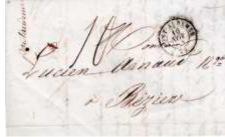
Lettre postée le 10 novembre 1844 à Pont-Audemer (26, Eure) à destination de Béziers (33, Hérault). Lettre du 1 er échelon de poids et port calculé à 10 décimes (750 km).