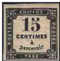
Chiffre-taxe à 15c (YT 3B) imprimé en typographie, émis le 1 er janvier 1863. Extrémités droites du 1, impression défectueuse du à.

Le 2 mai 1864, un deuxième chiffre-taxe à 15c (YT 3) est mis en vente, imprimé en lithographie comme le précédent, mais à partir d'une planche d'impression différente. Les principales différences résident dans les extrémités du chiffre 1 et dans la lettre à qui est mal imprimée sur le premier (YT 3B).