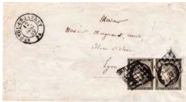
Lettre postée le 12 décembre 1849 à Saint-Paul-en-Jarret (84, Vaucluse) à destination de Lyon (68, Rhône). Affranchie à 40c avec une paire de timbres au type Cérès (YT 3), au tarif du 2 ème échelon des lettres du 1 er janvier 1849. Il n'y avait pas encore de timbres à 40c de disponible à cette date.