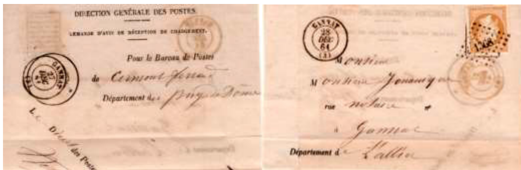
Avis de réception d'un envoi postal posté le 27 décembre 1861 à Gannat (PC 1358, 3, Allier) à destination de Clermont-Ferrand (61, Puy-de-Dôme). Affranchi à 10c avec un timbre au type EMPIRE FRANC (YT 13B), au tarif des avis de réception du 6 juillet 1859.

Le 6 juillet 1859, un nouveau tarif est créé pour les avis de réception. L'expéditeur d'un envoi postal chargé ou recommandé peut demander à être avisé par la Poste de la réception de son envoi par le destinataire. Dans ce cas, l'envoi est accompagné par un formulaire spécial dont une partie sera renvoyée à l'expéditeur, formulaire appelé avis de réception. Le tarif pour ces avis est fixé à 10 centimes.