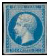
1 er juillet 1854 (YT 14)