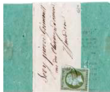
Avis des contributions directes posté en août 1862 à Reuilly (35, Indre) à destination d'Issoudun (35, Indre). Affranchi à 1c avec un timbre au type EMPIRE FRANC (YT 11), au tarif du 1 er échelon des avis sous bande du 1 er août 1856.

Un tarif pour les papiers d'affaires, dont les factures, est aussi entré en vigueur à cette même date. Il est de 50 centimes jusqu'à un poids de 500 grammes. Les factures simples, de moins de 50g, continueront donc d'être expédiées au tarif des lettres, soit 20 centimes.