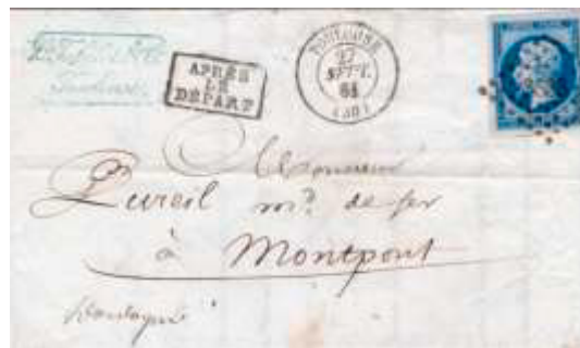
Lettre postée le 27 septembre 1861 à Toulouse (PC 3383, 30, Haute-Garonne) à destination de Montpont (23, Dordogne). Affranchie à 20c avec un timbre au type EMPIRE FRANCO (YT 14), au tarif du 1 er échelon des lettres de bureau à bureau du 1 er juillet 1854.