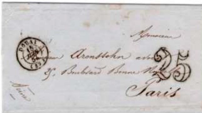
Lettre postée le 15 juin 1854 à Douai (57, Nord) à destination de Paris (60). Lettre non affranchie, taxée à 25c au moyen d'un cachet double trait, au tarif du 1 er échelon des lettres de bureau à bureau du 1 er juillet 1850.