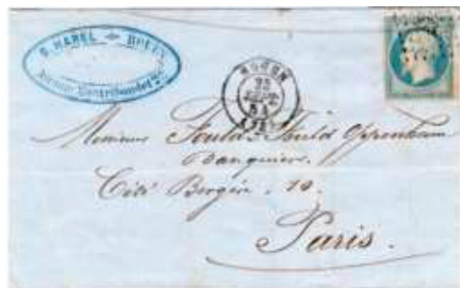
Lettre postée le 23 septembre 1854 à Rouen (72, Seine-inférieure) à destination de Paris (60). Affranchie à 20c avec un timbre au type EMPIRE FRANCO (YT 14), au tarif du 1 er échelon des lettres de bureau à bureau du 1 er juillet 1854.