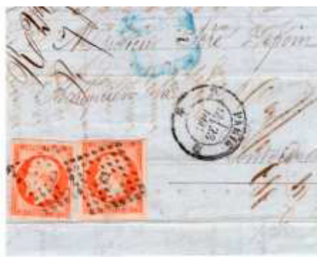
Lettre postée le 23 décembre 1857 à Paris (60) à destination de Pontoise (74, Seine-et-Oise). Affranchie à 80c avec deux timbres au type EMPIRE FRANC (YT 16), au tarif du 3 ème échelon des lettres de bureau à bureau du 1 er juillet 1854.