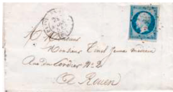
Lettre postée le 24 mars 1854 à Passy-lès-Paris (60, Paris) à destination de Rouen (72, Seine-Inférieure). Affranchie à 25c avec un timbre au type EMPIRE FRANC (YT 15), tarif du 1 er échelon des lettres de bureau à bureau du 1 er juillet 1850.