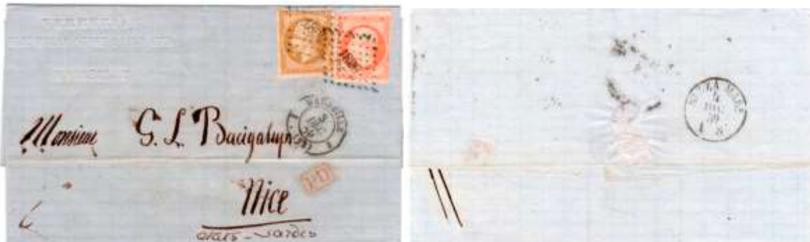
Lettre postée le 3 décembre 1859 à Marseille (12, Bouches-du-Rhône) à destination de Nice (États sardes). Affranchie à 50c avec deux timbres au type EMPIRE FRANC (YT 13A et 16), au tarif du 1 er échelon des lettres pour les États sardes du 1 er juillet 1851. Au verso, cachet sarde Nizza Mara 4 DEC 59.

Jusqu'au 14 juin 1860, la partie du Comté de Nice du futur département des Alpes-Maritimes fait partie des États sardes et est donc soumise à un tarif spécifique pour l'étranger.