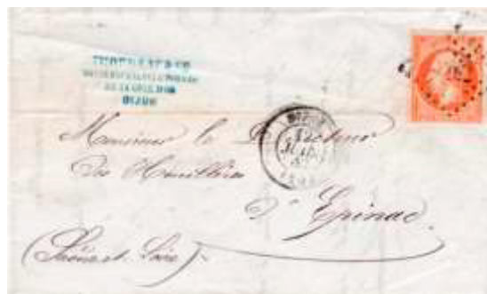
Lettre postée le 12 juin 1860 à Dijon (20, Côte-d'Or) à destination d'Épinac (70, Saône-et-Loire). Affranchie à 40c avec un timbre au type EMPIRE FRANC (YT 16), au tarif du 2 ème échelon des lettres de bureau à bureau du 1 er juillet 1854.