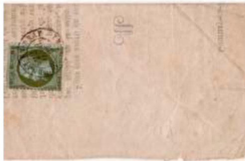
Avis (convocation) posté le 22 février 1867 à Gournay-en-Bray (74, Seine-Inférieure), posté sous bande (bande absente). Affranchi à 1c avec un timbre au type EMPIRE FRANCOIS (YT 19), au tarif du 1 er échelon des avis sous bande du 1 er août 1856.