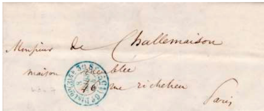
Lettre postée le 8 mars 1854 à Paris pour Paris. Non affranchie et taxée à 15c au moyen d'un cachet double cercle « 6 e Dist on (3) 5 h 30 S r (15 c ) 8 MARS 54 », au tarif du 1 er échelon des lettres non affranchies de Paris pour Paris du 1 er juillet 1853.

Ce tarif est le premier qui impose un supplément, en clair une surtaxe, pour les lettres non affranchies par l'expéditeur.