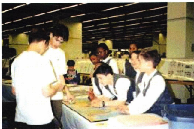
Jeunes philatélistes participant à un jeu « Philatélie et géographie ».

Au cours de 2019 et de 2020, la FQP a mis en pause les activités régulières de son secteur jeunesse. Cependant, elle a profité de cette période pour garnir son site web de documents numériques tels que La pizza timbrée , Jeux et activités philatéliques et Les sports olympiques .