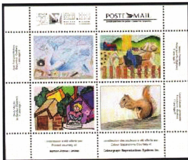
Feuillet Canada 92, timbres vignettes dessinés par de jeunes philatélistes québécois.

Soutenue par des bénévoles dévoués, la FQP s'est donné comme mission de continuer à mettre sur pied différents projets et activités visant à développer l'intérêt des jeunes pour la philatélie...tout un monde à découvrir!