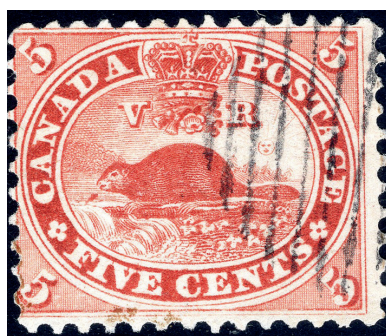
Timbre-poste de 5 cents de la première série décimale émis en juillet 1859 avec une variété constante de planches (poisson volant – position 54 : un petit point de couleur devant le castor).