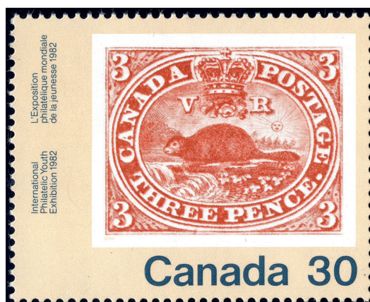
Timbre-poste commémoratif de 30 cents émis en mai 1982.

sont recherchées et prises par les philatélistes canadiens.