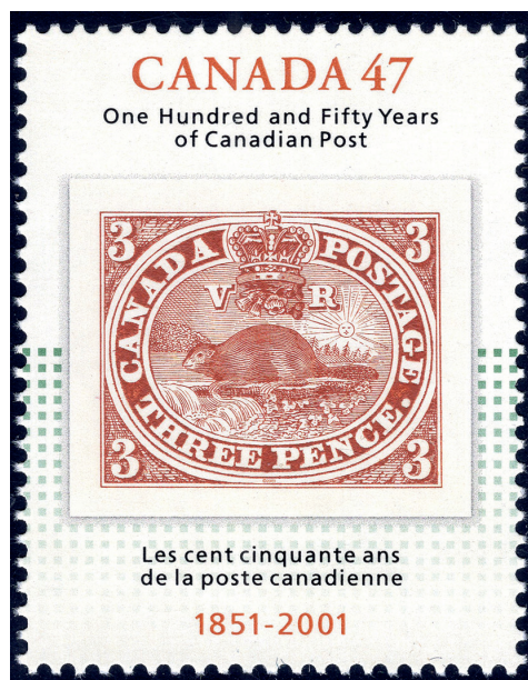
Timbre-poste commémoratif de 47 cents émis en avril 2001.