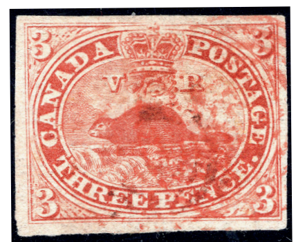
Timbre-poste non dentelé sur papier côtelé horizontal émis après 1852.

C'est à Sir Sandford Fleming 1 que l'on doit l'idée du design du premier timbre-poste de la Province 2 du Canada. Comme emblème animalier par excellence de la Province, le castor, pour lui, représentait l'une des richesses naturelles (fourrure) de la Province en plus d'être à l'image d'un peuple de colons travailleurs, industriels, tenaces et occupés à édifier leur avenir 3 .