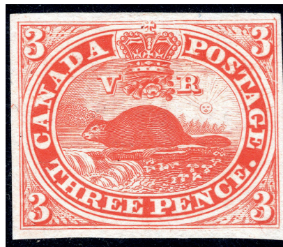
Épreuve de planche en rouge du castor de 3 deniers (1851).

Essai en noir du castor de 3 deniers avec variété constante (position 33). Cette position se distingue par le grand trait dans les lettres PE ainsi que dans l'ovale en-dessous.