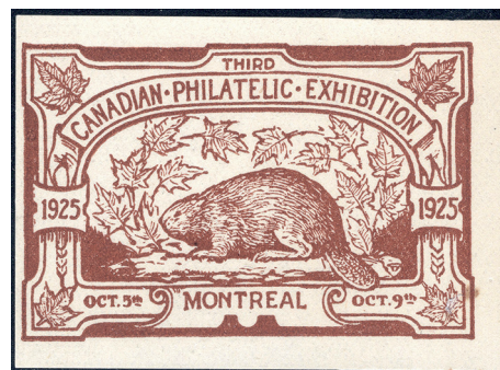
Vignette para-philatélique du castor pour l'exposition philatélique de Montréal en 1925.