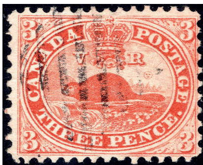
Timbre-poste de 3 deniers dentelé 11.75, émis en janvier 1859.