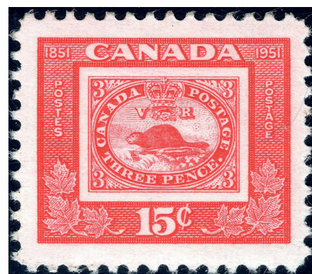
Timbre-poste commémoratif de 15 cents émis en septembre 1951.