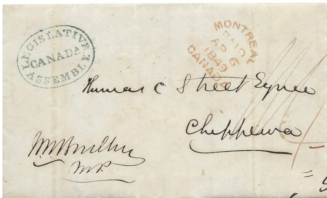
Illustration 5 : Timbre à main apposé à l'encre bleue, utilisé le 6 avril 1849, 19 jours avant l'incendie