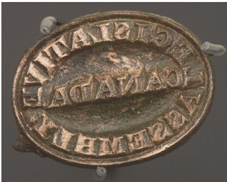
Illustration 1 : Le timbre à main ovale « LEGISLATIVE ASSEMBLY CANADA »

D es archéologues de Montréal ont découvert un artéfact postal extraordinaire lors de fouilles récentes (été 2017) effectuées sur le site de l'ancien Parlement, localisé à Montréal. Le bâtiment et ses bibliothèques ont brûlé il y a 168 ans dans la nuit du 25 avril 1849, quand des émeutiers anglais furieux ont pris d'assaut le Parlement et l'ont incendié. Les bibliothèques étaient situées à un pâé de maisons du fleuve Saint-Laurent. Un terrain de stationnement occupe l'endroit depuis les 90 dernières années et les archéologues y ont trouvé ce timbre officiel en alliage de cuivre utilisé par la poste du Parlement pour marquer les lettres (Illustration 1).