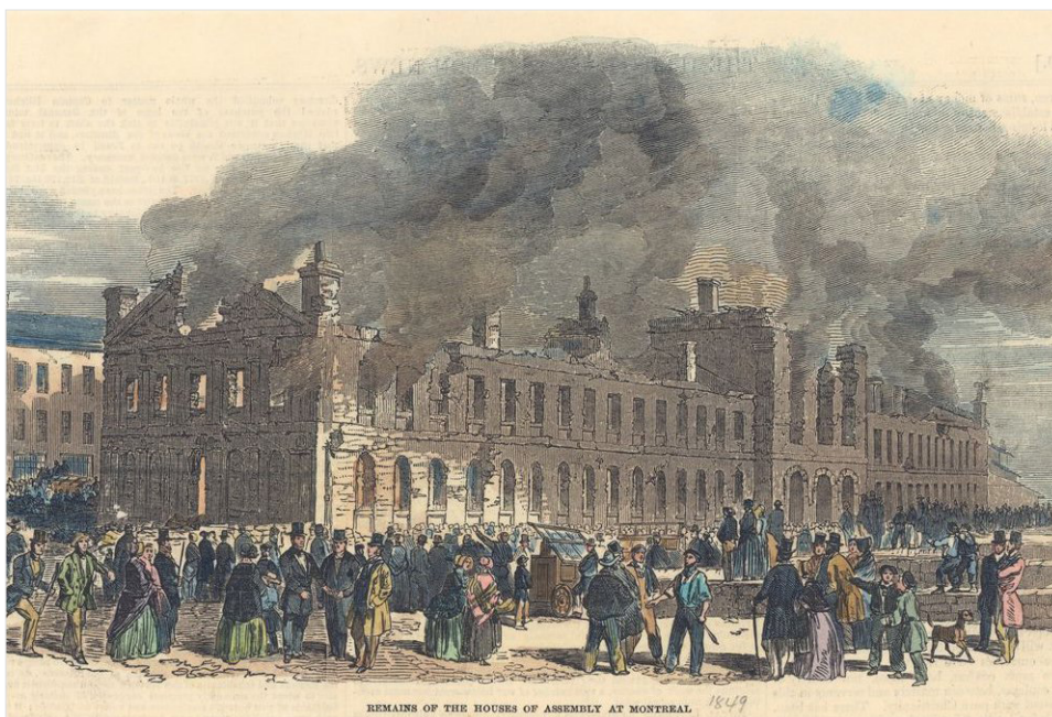
Illustration 2 : L'incendie du Parlement

Les dimensions officielles de la marque, données par le Canada Specialized Catalogue (1987), sont de 32 x 24 mm. Les mesures exactes des quelques pièces de ma collection sont les suivantes: Montréal, 33 x 25 mm; Toronto, 32½ x 24½ mm; et Québec, 32½ x 25 mm.