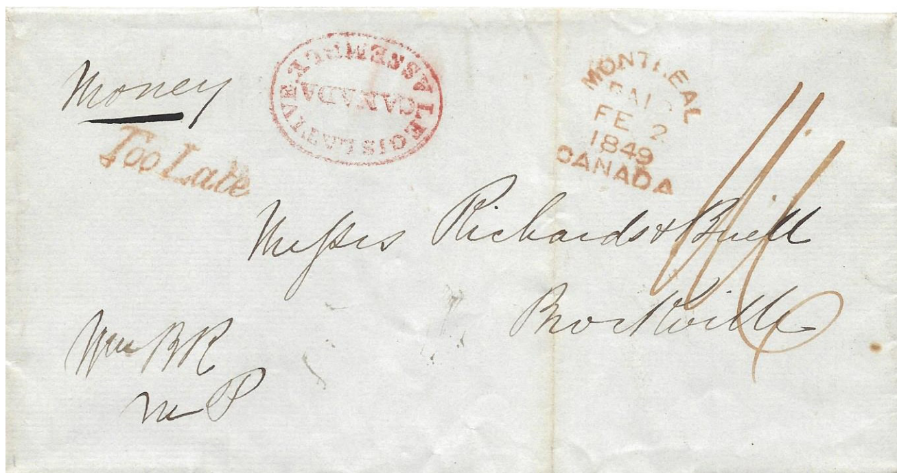
Illustration 4: Timbre à main apposé à l'encre rouge le 2 février 1849 (date la plus ancienne connue)