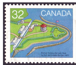
Illustration 1 : Timbre-poste émis par Postes Canada le 30 juin 1983 montrant le fort de Coteau-du-Lac érigé en 1813 pour protéger le transport des marchandises en cas d'attaque américaine. Lors de la rébellion, deux patriotes y furent incarcérés.

La garnison est à ce moment formée de la milice de Stormont et de quelques volontaires opposés à la cause patriote. Quelque temps plus tard, des volontaires de Cornwall viendront grossir les rangs des Loyalistes. À l'arrivée du capitaine Bell, du Royal Regiment , la