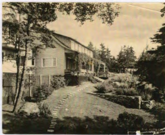
La Maison de campagne du président William Howard Taft et de son épouse Helen, sur la Cap-Blanc à La Malbaie vers 1930.