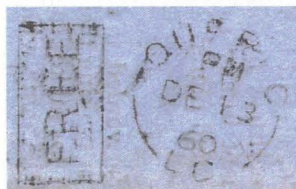
Fig. 1 Duplex expérimental de 1860

Le Duplex de Québec de 1860 - La plus ancienne marque postale expérimentale que je connaisse a été utilisée à Québec en 1860. Il s'agit d'un Duplex dont l'invention a d'ailleurs fait la « Une » du Quebec Morning Chronicle du 18 Décembre 1860, qui la décrit ainsi (traduction libre) : « Une invention plutôt ingénieuse pour sauver du temps et du travail est actuellement en usage au bureau de poste de Québec. Elle consiste en une machine pour oblitérer les lettres qui peut oblitérer de 35 à 40 lettres à la minute. Le processus fait en sorte que la machine peut oblitérer clairement et empiler les lettres dans l'ordre dans lequel elles ont été oblitérées, facilitant ainsi grandement leur dispatch. Son inventeur, un marchand bien connu de la ville, s'apprête à déposer un brevet ».