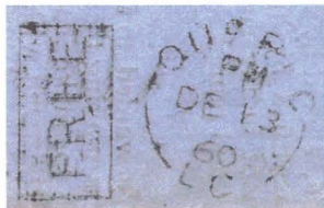
Fig. 1 1860 Experimental Duplex

The Quebec Duplex of 1860 - The oldest experimental postmark that I know of was used in Quebec in 1860. It is a Duplex whose invention also made the front page of the Quebec Morning Chronicle of December 18, 1860, which describes it as follows: "A rather ingenious invention to save time and work is currently in use at the Quebec post office. It consists of a machine for canceling letters which can cancel 35 to 40 letters per minute. The process ensures that the machine can clearly postmark and stack letters in the order in which they were postmarked, making them much easier to dispatch. Its inventor, a well-known merchant in the city, is preparing to file a patent."