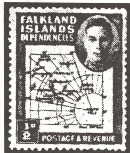
Fig. 1 Timbre-poste émis en 1946. Etant donné l'étendue du territoire anglais représenté sur la carte, l'Argentine protesta vigoureusement contre l'émission de ce timbre.

chassé en 1765 par l'escadre de lord Byron. En 1826, les Argentins s'y établissent, mais ils seront contraints d'abandonner l'île au profit des Américains en 1831. Les Anglais, quant à eux, y débarquèrent en 1833, plus précisément le 2 janvier 1833.