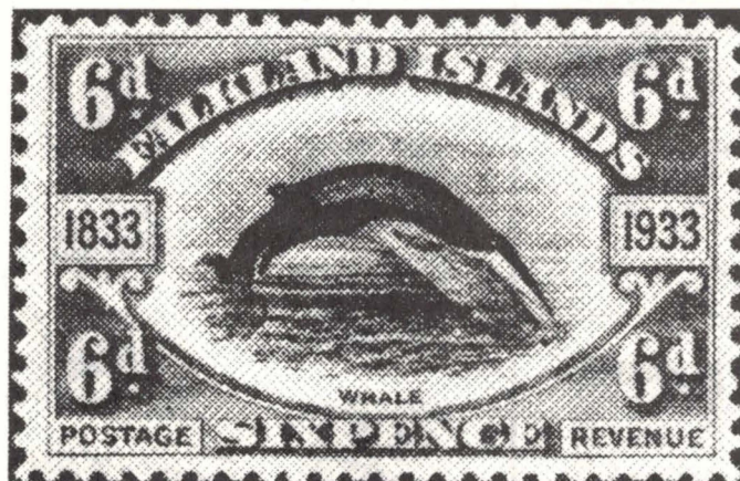
Fig. 2 Timbre-poste de la série commémorative de 1933.

Ces îles, auxquelles sont aussi rattachées les Falkland Islands Dependencies, perdues dans le froid de l'Antarctique, ont, en fait, un passé bien mouvementé! Jugez-en plutôt! Elles furent découvertes en 1592 et c'est en 1690 que le capitaine Strong les appela du nom du trésorier de la marine anglaise, le vicomte Falkland. En 1793, Bougainville, un Français, les nomme les "îles Malouines", avant d'en être