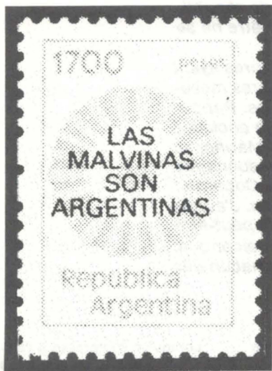
Fig. 4 Timbre-poste surchargé émis par l'Argentine le 22 avril 1982 et, à côté, l'oblitération du 1er jour.

SBZ 8/1982 Journal Philatélique Suisse: Philatélie pour tous!