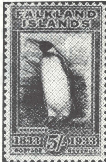
Fig. 3 Timbre-poste de la série commémorative de 1933.

Voici la philatélie devenue témoin de la politique, de l'actualité et de l'histoire!