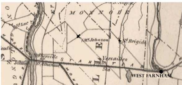
Localisation de West Farnham d'après une carte de 1867 [ Eastern Township Gazetteer 1 ]

La Ville de Farnham tire son nom d'un village d'Angleterre dans le comté de Surrey, non loin de Londres. Lors de sa création, le Canton de Farnham fut scindé en trois concessions, lesquelles