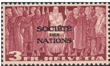
ill. 17: Société des Nations.

Créée en 1919 et ancêtre de l'Organisation des Nations-Unies, elle fut dissoute en 1946. Cet organisme avait son siège à Genève et la Suisse a fait émettre une première série de timbres pour lui en 1922. Tous les timbres de la Société des Nations sont surchargés sur les timbres courants de la Suisse. En tout 90 timbres ont été émis entre 1922 et 1942 (ill. 17) soit 4,5 timbres par année. Nous verrons plus loin que l'Organisation des Nations-Unies a