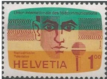
ill. 28: Union internationale ds télécommunications.

Créée en 1865 sous le nom d'Union internationale du télégraphe, elle a changé son nom en 1932 pour tenir compte de l'arrivée du téléphone, de la radio et de la télévision avant d'être rattachée aux Nations-Unies en 1947. Elle a pour but principal d'encadrer les technologies des télécommunications ce qui n'est pas une mince tâche depuis l'arrivée des ordinateurs personnels, des téléphones mobiles et de l'internet. Son siège original était à Berne, mais il est déménagé à Genève en 1947. Elle occupe actuellement trois immeubles (Varembéré, construit de 1959 à 1962, la Tour, inaugurée en 1973 et le bâtiment Montbrillant,