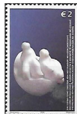
ill. 32: Administration intérimaire de l'O.N.U. au Kosovo

ainsi 92 timbres entre le 14 mars 2000 et le 17 janvier 2008 (ill. 32). Le Kosovo a proclamé son indépendance et a émis ses premiers timbres-poste le 17 février 2008. J'estime que tous ces timbres sortent du cadre du présent article puisqu'ils servaient à la population d'un État en situation de guerre ou au courrier des soldats impliqués dans les forces de maintien de la paix, alors que ceux énumérés dans le reste de cet article ont été émis par ou pour des organismes internationaux et ils n'étaient valides que pour le courrier posté dans le bureau de ces organismes.