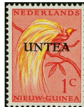
ill. 30: Timbre des forces des Nations-Unies en Nouvelle-Guinée.

Executive Authority) et mis en circulation dans l'ouest de la Nouvelle-Guinée (maintenant la province d'Irian Barat en Indonésie) (ill. 30). Le contrôle de ce territoire fut cédé à l'Indonésie le premier mai 1963.