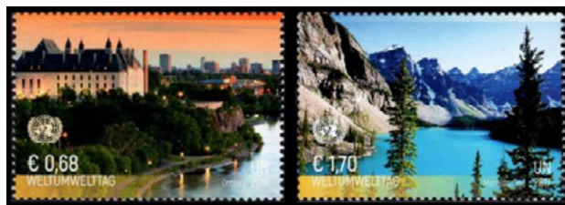
ill. 9: Timbres des Nations-Unies à Vienne.

C'est le premier janvier 1980 que fut inauguré le siège viennois de l'O.N.U., situé à l'intérieur d'un vaste complexe appelé le Centre international de Vienne qui regroupe un grand nombre d'organisations internationales. Les premiers timbres-poste avaient été émis le 24 août 1979 et depuis cette date ce