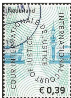
ill. 16: Cour internationale de justice.

Ce tribunal international qui siège au Palais de la Paix à La Haye est l'un des six organismes principaux de l'O.N.U. Son rôle est de statuer sur les litiges entre les États qui reconnaissent sa juridiction. Il ne faut pas le confondre avec le Tribunal pénal international qui siège aussi à La Haye et dont le rôle est de traduire en justice les criminels accusés