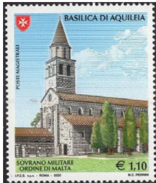
ill. 14: Ordre de Malte.

Son nom complet est: l'Ordre souverain, militaire et hospitalier de Saint-Jean de