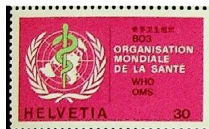
ill. 27: Organisation mondiale de la santé.

Créée en 1948, cette organisation est l'agence spécialisée des Nations-Unies pour la santé. Elle a son siège à Pregny-Chambésy dans le canton de Genève. Son objectif est d'amener tous les peuples à un même niveau de santé optimale. Elle compte parmi ses plus grands succès l'éradication totale de la variole qui tuait deux millions de personnes par année. C'est le 24 juin 1948 que furent émis ses premiers timbres surchargés sur timbres suisses, comme les 25 timbres émis jusqu'en 1957. Depuis, une vingtaine d'autres timbres propres à l'organisme ont été émis, pour un total d'environ une quarantaine de timbres en 75 ans soit environ un timbre aux deux ans (ill. 27). On lui doit également d'avoir convaincu plusieurs pays du monde de s'unir et procéder à diverses émissions postales dont par exemple les timbres anti-malaria de 1962 (campagne