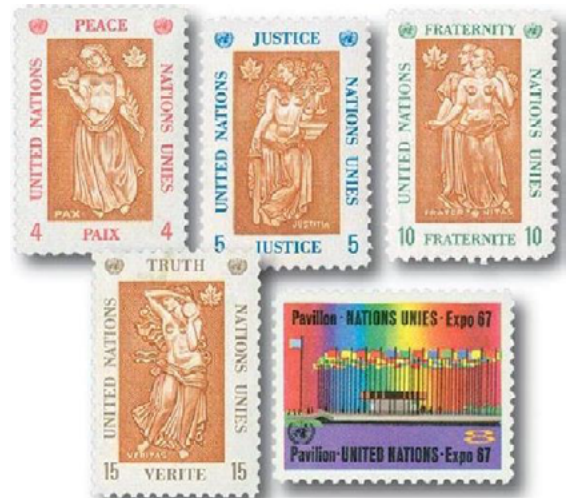
ill. 8: Nations-Unies timbres valides au Canada.

Mais certains se souviendront peut-être que le Canada a aussi été l'hôte d'un bureau postal des Nations-Unies. En effet durant l'Exposition internationale de Montréal de 1967, le pavillon des Nations-Unies était muni d'un bureau de poste où une série de cinq timbres des Nations-Unies était en vente, libellée en dollars canadiens et ces timbres n'étaient valides que pour le courrier posté dans ce pavillon d'Expo 67 seulement. Ils ont donc eu cours du 28 avril au 27 octobre 1967 soit environ six mois. Ils n'étaient pas valides pour le courrier posté au siège de New York. J'ai eu la chance d'y poster quelques lettres affranchies des timbres des Nations-Unies. Montréal est aussi l'hôte de l'Organisation de l'aviation civile internationale depuis 1944, mais elle n'émet pas de timbres-poste. Franchissons maintenant l'Atlantique et voyons, par ordre alphabétique, quels sont les pays d'Europe qui hébergent ou ont hébergé des organisations internationales qui émettent des timbres-poste (ill. 8).