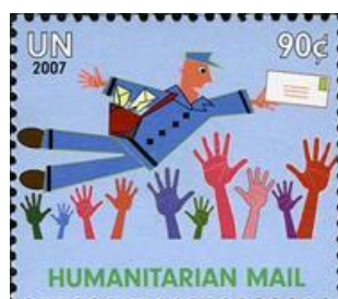
ill. 7: Nations-Unies N. Y.

En Amérique, bien sûr, on pense immédiatement au siège mondial de l'ONU à New York, qui émet ses propres timbres-poste depuis 1951. La première série de timbres a été émise par tranches entre le 24 octobre et le 16 novembre 1951. Les timbres du bureau new-yorkais des Nations-Unies ont été largement utilisés sur le courrier puisque ce bureau acceptait que des commerçants y mettent à la poste de grandes quantités d'envois postaux affranchis de timbres des Nations-Unies. Ils ne sont donc pas rares utilisés postalement. Depuis les attentats du 11 septembre 2001 cependant, l'accès est