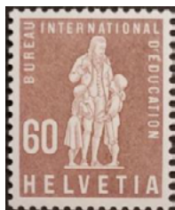
Ill. 19: Bureau international d'éducation.

Après des précurseurs sans valeur postale émis par la poste suisse en 1940 et en 1942 (ill. 18), la Suisse a fait émettre les premiers timbres-poste pour cet organisme le 15 août 1944 et 39 timbres ont été surchargés sur des timbres suisses entre 1944 et 1957. Depuis lors une dizaine de timbres spécifiques ont été émis pour un total d'une cinquantaine de timbres, soit moins d'un timbre-poste par année (19).