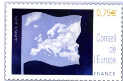
ill. 13: Timbre du Conseil de l'Europe.

Jérusalem, de Rhodes et de Malte. Il a son siège à Rome et je lui ai consacré un article dans le numéro de janvier 2022, volume 9, numéro 4 de Philabec. Le lecteur y est référé pour plus de détails. Qu'il suffise de rappeler ici que l'Ordre a été fondé en 1048 et qu'il émet des timbres-poste depuis le 15 novembre 1966. Ceux-ci ne sont valides que pour le courrier déposé dans les nombreuses boîtes aux lettres situées au siège de l'Ordre à Rome. Le courrier ne peut être posté qu'à destination des pays avec lesquels l'Ordre a signé des conventions postales bilatérales, soit environ 51 pays incluant le Canada. À ce jour non moins de 2000 timbres-poste ont été émis, soit une moyenne de 36 timbres par année.