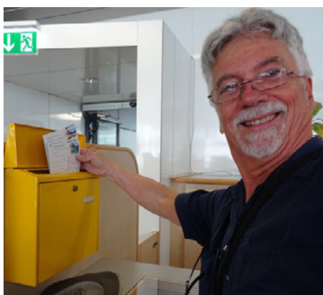
ill. 2: L'auteur postant son courrier aux Nations-Unies de Vienne.

cette dernière que les timbres-poste sont vendus. Le personnel y est aimable et serviable et j'ai pu me procurer des timbres-viennois des Nations-cartes postales et adressées et dans la seule petite des usagers (ill. 2). philatélistes, il s'agit peu de cartes postales ce bureau et ses nulle part ailleurs (ill.