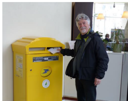
ill. 4: L'auteur postant son courrier au siège de l'UNESCO à Paris.

montrant le siège de l'organisme. Manifestement ces cartes postales étaient là depuis des décennies et la dame ne croyait pas sa chance que j'en prenne dix ou quinze d'un coup. Juste à l'extérieur de la boutique, il y a une boîte pour recevoir le courrier et j'y ai posté mes cartes qui se sont bien rendues à destination (ill. 4). La préposée, voyant mon intérêt pour les timbres-poste, m'a proposé d'acheter des timbres pour le bureau des Nations-Unies de Vienne, mais comme ils n'ont pas cours légal à l'UNESCO, je n'en ai pas acheté. Elle semblait étonnée de mon refus... (ill. 6)