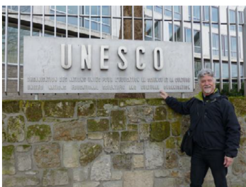
ill. 3: L'auteur devant l'UNESCO à Paris.

s'adonner à des tâches de secrétariat, mais elle est aussi responsable de la boutique. Elle semblait surprise que je lui demande d'acheter des timbres de l'UNESCO. Elle en avait quelques feuilles des deux plus récents dont aucun ne correspondait au tarif international d'une carte postale. J'ai donc suraffranchi les cartes postales que j'y avais achetées, un vieux modèle en noir et blanc un peu gondolé