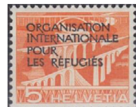
ill. 23: Organisation internationale pour les réfugiés.

C'est le premier février 1950 que cette organisation reçut ses premiers timbres-poste, tous surchargés sur timbres suisses et seulement huit timbres ont été émis à ce jour (ill. 23). Fondée en 1946 et installée à Genève, son rôle était de gérer les flux majeurs de réfugiés suite à la Seconde Guerre mondiale. Elle fut fermée en 1952 pour être remplacée par le Haut-commissariat des Nations-