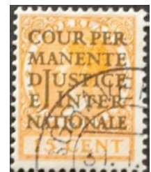
ill. 15: Cour permanente de justice internationale.

en vertu des dispositions pénales internationales. Créée en 1945, la Cour internationale de justice a succédé le 3 avril 1946 à la Cour permanente de justice internationale fondée en 1920 par la Société des Nations, elle-même ancêtre de l'O.N.U. De 1947 à 1988 les collectionneurs ne pouvaient acheter les timbres-poste de la Cour que préoblitérés, aucun n'étant vendu à l'état neuf. Ils ne devaient servir qu'aux employés autorisés de la Cour et on comprend que les timbres de la Cour utilisés sur du courrier durant cette période sont plutôt rares. Depuis 1989 on peut se les procurer à l'état neuf, mais comme leur usage est réservé au personnel, un philatéliste