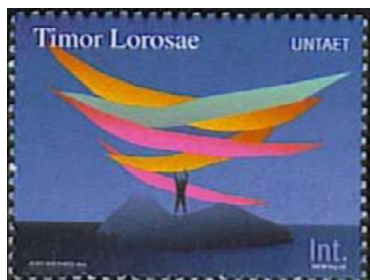
ill. 31: Mission des Nations-Unies au Timor oriental.

Par la suite des timbres indonésiens libellés « Irian Barat » ont servi jusqu'en 1970 pour être remplacés par ceux de l'Indonésie. De même, des timbres ont été émis par l'O.N.U. au nom de l'autorité transitoire du Timor oriental (UNTAET) le 29 avril 2000 (ill. 31). Ils furent en circulation jusqu'à l'émission de timbres-poste par l'État indépendant de Timor-Leste le 20 mai 2002. Dernier exemple, l'O.N.U. fit émettre des timbres-poste au nom de la Mission d'administration intérimaire au Kosovo (UNIAMK) le 14 mars 2000. L'O.N.U. fit émettre