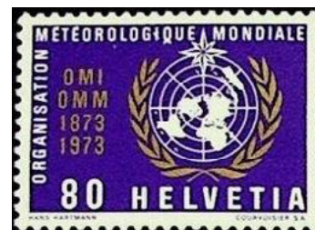
ill. 24: Organisation météorologique mondiale.

Il s'agit de l'organisme des Nations-Unies qui fait autorité pour les questions relatives au temps, au climat et à l'eau. Créé en 1950 pour succéder à l'Organisation météorologique internationale elle-même fondée en 1893, il a son siège à Genève et il joue un rôle de premier plan pour toutes les questions relatives à l'environnement et aux changements climatiques. Il dispose de ses timbres-poste depuis le 22 octobre 1956 et seulement une quinzaine de timbres ont été émis à ce jour (ill. 24).