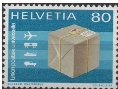
ill. 28: Timbre de l'Union postale universelle.

Sans doute la mieux connue des philatélistes, l'U.P.U. est née le 9 octobre 1874 lors de la signature du traité de Berne, sous le nom d'Union postale générale, à l'instigation du ministre des postes allemand Heinrich von Stephan. Elle reçut son nom actuel en 1878. Elle régit l'ensemble des relations postales entre ses membres et elle a créé des règles pour les États non-membres afin que le courrier de ces États puisse circuler. Elle a aussi développé un programme de numérotation des émissions auquel les États membres sont libres d'adhérer. Cette numérotation a pour but de permettre le repérage des timbres illégaux, une plaie du monde philatélique.