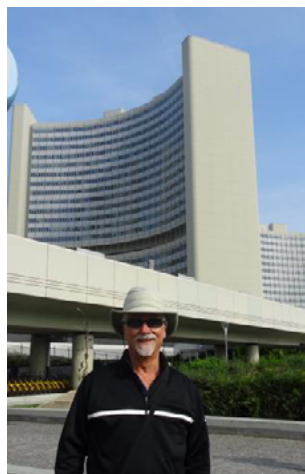
ill. 1: L'auteur devant les Nations-Unies à Vienne.

poste émis pour le siège Unies. J'ai aussi acheté des après les avoir complétées, timbrées, je les ai postées boîte postale à la disposition Pour mes correspondants d'une pièce rare puisque sont mises à la poste dans timbres ne sont valables 5).