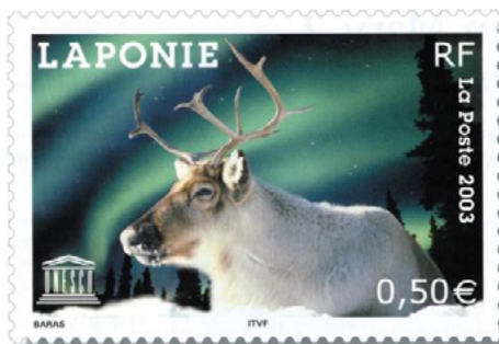
ill. 11: Émission de l'UNESCO.

différents (ill. 11). Ils sont émis à raison de deux timbres par année en moyenne. Jusqu'en 1998 ils portaient la mention République française (ou RF) et le nom UNESCO. Depuis la série émise le premier décembre 2001, ils sont identifiés par l'emblème de l'UNESCO comme sur le timbre-poste illustré ici (ill. 12).