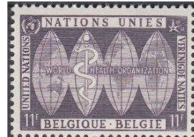
ill. 10: Timbre belge pour les Nations-Unies à Bruxelles.

Qui se souvient aujourd'hui que Montréal, lors de l'Expo 67, n'avait fait que répéter un précédent belge ? En effet lors de l'Exposition internationale de Bruxelles de 1958 une série de 16 timbres (dix pour la poste de surface et six pour la poste aérienne), fut émise pour commémorer la participation de l'O.N.U. à cette exposition internationale et pour lever des fonds. Leur particularité: ils portaient l'inscription Nations-Unies dans trois langues (anglais, français et flamand) et ils ne pouvaient être utilisés que pour poster le courrier dans la boîte postale du pavillon des Nations-Unies à l'exposition. Leur période de validité correspond donc à la durée de l'exposition, du 17 avril au 19 octobre 1958, soit environ six mois. Ils étaient en vente au pavillon des Nations-Unies et aussi par la poste ainsi qu'au siège new-yorkais des Nations-Unies. Ce sont les seuls timbres des Nations-Unies libellés en francs belges (ill. 10) !