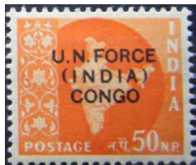
ill. 29: Timbre des forces des Nations-Unies au Congo.

L'O.N.U. a dû s'imposer à quelques reprises dans des zones de conflit pour lesquelles elle a organisé un service postal. À titre d'exemple, et cette liste n'est pas limitative, entre 1953 et 1965 l'Inde a surchargé plusieurs timbres pour l'usage des troupes de maintien de la paix des Nations-Unies en Corée, au Congo, à Gaza, au Laos, au Cambodge et au Vietnam (ill. 29). De même le premier octobre 1962 des timbres de la Nouvelle-Guinée néerlandaise ont été surchargés