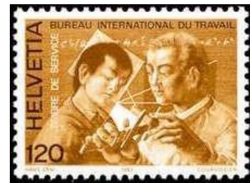
Ill. 20 : Bureau international du travail

Selon son site internet, le Bureau international du Travail est le secrétariat permanent de l'Organisation internationale du Travail. Il a son siège à Genève et il emploie 2 700 fonctionnaires. Ses premiers timbres-poste ont été émis en 1923 et jusqu'en 1956, 93 timbres-poste ont été surchargés sur des timbres suisses. Depuis, une vingtaine de timbres-