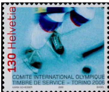
ill. 22: Timbre du Comité international olympique.

Dernier-né des organismes qui bénéficient de leurs propres timbres-poste, le Comité international olympique s'est vu gratifier de ses premiers timbres-poste spécifiques le 15 septembre 2000 et à ce jour seulement cinq timbres ont été émis (ill. 22). Basé à Lausanne où il loge dans la Maison Olympique depuis 2019, il a été fondé le 23 juin 1894. Son rôle est bien connu: il soutient le mouvement olympique, il en fait la promotion dans le monde et il est surtout connu pour l'organisation des Jeux olympiques d'hiver et d'été.