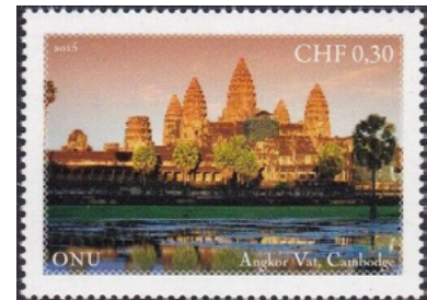
ill. 21 : Timbres des Nations-Unies à Genève.

Héritière de la Société des Nations, l'O.N.U. avait un siège à New York comme nous l'avons vu plus haut, mais aussi à Genève où on retrouvait l'Office européen des Nations-Unies. Dès le premier février 1950 (donc avant le bureau de New York), cet office eut droit à ses propres timbres-poste surchargés sur ceux de la Suisse. Après une vingtaine d'émissions surchargées, de nouvelles séries dessinées spécialement pour cet office furent mises en circulation à compter du 24 octobre 1955 et une vingtaine d'autres timbres furent ainsi émis. Mais suite à un accord conclu entre l'administration des PTT suisses et l'Administration postale des Nations-Unies à Genève, des timbres-poste distincts sont émis par les Nations-Unies depuis le 4 octobre 1969 et depuis, près de 700 timbres ont été émis par cette administration postale (ill. 21). Ils ne sont valides que dans le bureau de poste de l'O.N.U. de Genève. Très souvent il s'agit d'émissions au design commun partagé par les trois sièges new-yorkais (en dollars américains), genevois (en francs suisses) et viennois (en euros).