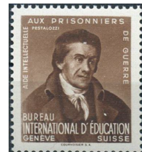
ill. 18: Précurseur Bureau international d'éducation.

Après des précurseurs sans valeur postale émis par la poste suisse en 1940 et en 1942 (ill. 18), la Suisse a fait émettre les premiers timbres-poste pour cet organisme le 15 août 1944 et 39 timbres ont été surchargés sur des timbres suisses entre 1944 et 1957. Depuis lors une dizaine de timbres spécifiques ont été émis pour un total d'une cinquantaine de timbres, soit moins d'un timbre-poste par année (19).