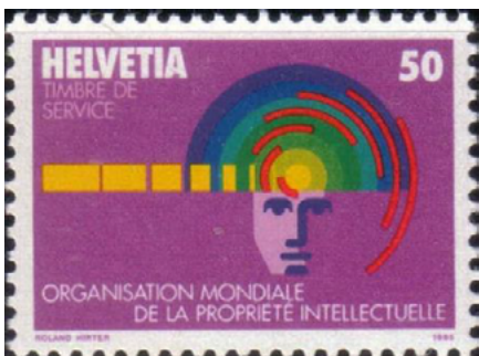
ill. 25: Organisation mondiale de la propriété intellectuelle.

Elle est l'instance mondiale chargée des services, des politiques, de l'information et de la coopération en matière de propriété intellectuelle et elle comprend 193 États membres. Elle siège au 34 chemin des Colombettes à Genève. La propriété intellectuelle couvre notamment les brevets, les droits d'auteur et les marques de commerce. En cette ère de mondialisation et d'imitations, on comprend que cette organisation joue un rôle de premier plan. Créée en 1967, elle a reçu ses premiers timbres-poste le 27 mai 1982 et à ce jour seulement cinq timbres-poste ont été émis en son nom (ill. 25).