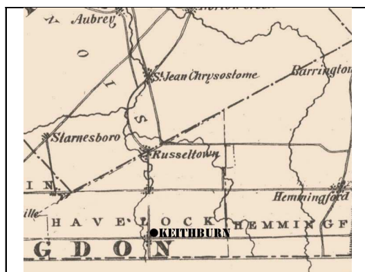
Localisation probable de Keithburn d'après une carte de 1867 [Eastern Township Gazetteer 1 ]

Keithburn est situé dans le canton d'Havelock. C'est vers 1798 que les premiers colons écossais, irlandais et américains s'établissent sur ce territoire, mais la municipalité, qui prend le nom de Havelock n'est constituée qu'en 1858. Le toponyme de la municipalité rappelle le général britannique Henry Havelock (1795-1857) 2 .