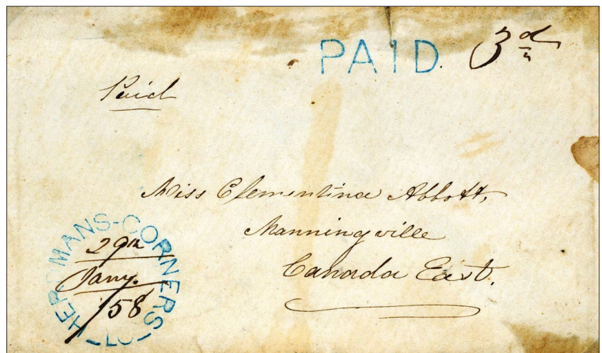
Illustration 2 : Marque postale de type double cercle interrompu de Herdman's Corners en date du 29 janvier 1858.

Le 24 juin 1879, William White, secrétaire du ministre des Postes, envoie une lettre à l'inspecteur King pour qu'il prenne les dispositions nécessaires afin de