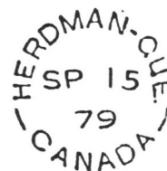
Illustration 5 : Épreuve du timbre à date utilisé au bureau de poste de Herdman

Pour conclure, nous estimons que le timbre à date Dalveen a probablement été utilisé jusqu'en janvier 1881 pour être ensuite remplacé par le timbre à date Herdman (Illustration 5).