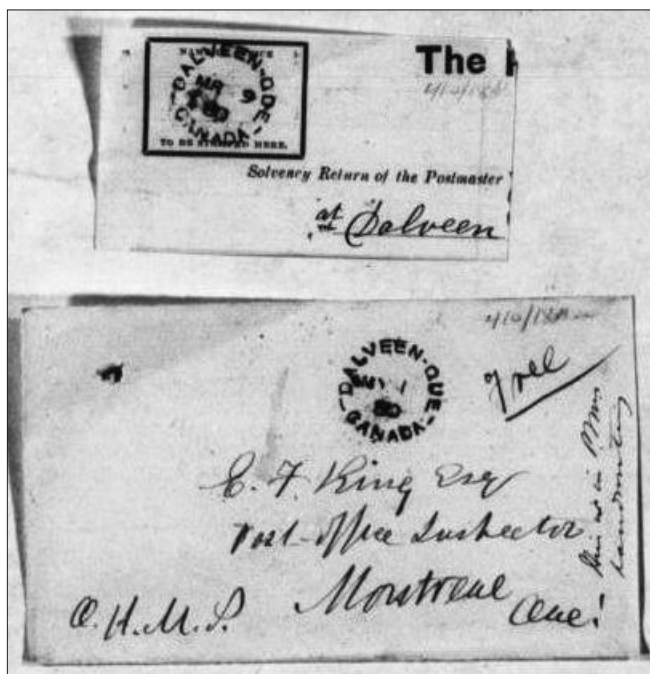
Illustration 4 : Exemples d'empreintes laissées par le timbre à date « Dalveen » sur le courrier envoyé à l'inspecteur King en mars et mai 1880

Le 18 mai, le secrétaire transmet à l'inspecteur de nouvelles directives provenant du ministre 11 . Il lui demande d'aller au bureau de poste pour récupérer le timbre à date et le sceau portant le nom Dalveen. Si par contre, le maître de poste refuse d'obtempérer à la demande, il devra procéder à la fermeture du bureau. Par la suite, il devra entreprendre les démarches nécessaires afin de trouver une personne responsable qui voudra temporairement occuper la fonction de maître de poste.