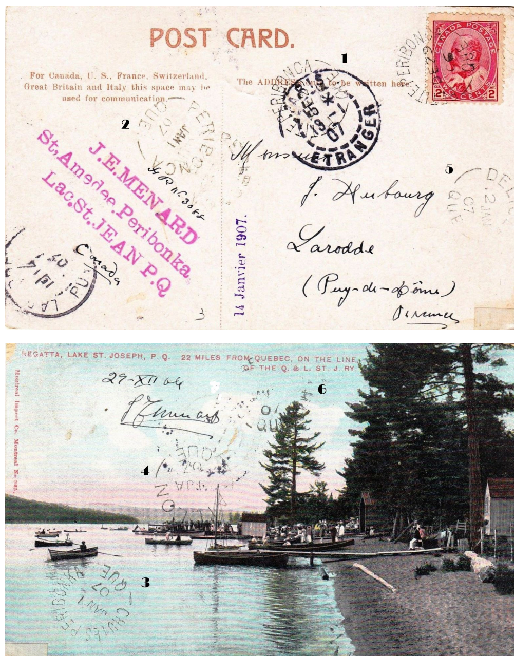
Illustration 1 : Recto et verso de la carte postale présentant les 8 oblitérations différentes