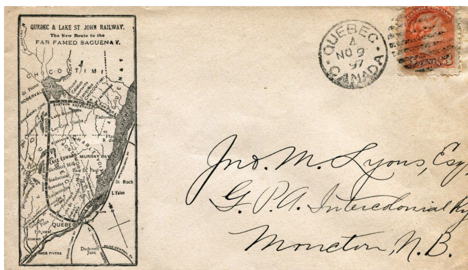
Illustration 3 : Enveloppe montrant le trajet de la ligne de chemin de fer de la compagnie ferroviaire Québec & Lake St. John Railway

transporter les sacs de malle (Illustration 4) 2 . Ici, dû à l'absence d'oblitérations pertinentes, il s'avère difficile de connaître le véritable trajet utilisé pour l'expédition du courrier vers l'Europe. Dans les archives, on indique que depuis le 11 août 1906, la compagnie maritime Dominion Line reçoit 150 $ par voyage pour transporter hebdomadairement le courrier entre Québec et Liverpool 3 . En ce qui nous concerne, étant donné que cet envoi postal a été effectué en hiver, nous croyons que le courrier a été acheminé d'une autre façon. Si nous consultons le guide postal, nous réalisons que plusieurs routes postales étaient disponibles (Illustration 5).