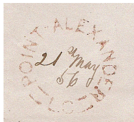
Illustration 3 : Empreinte du timbre Point Alexander/L.C.

fiche historique. Pour ce qui est du timbre suivant, il fut commandé le 27 juillet 1860, chez Berri en Angleterre 4 . Il présentait l'abréviation « C.W » (Canada West) à la base (Illustration 4). Quant aux deux derniers timbres, ils arboraient l'abréviation « ONT. » Ces informations semblent corroborer le contenu indiqué sur la fiche.