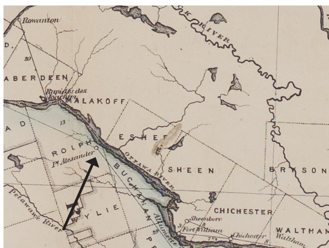
Illustration 2 : Carte indiquant l'emplacement du bureau de Point Alexander et du canton d'Escher.