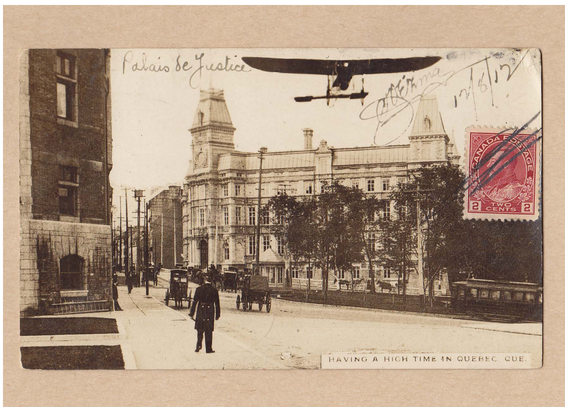
Illustration 1 : Québec B.A. Quartiers Presse et Milice. Ce bureau de poste, situé dans le palais de justice, servait à l'état-major de la Milice et à la Presse lors des fêtes du Tricentenaire de Québec en 1908.

dirigeable R-100 à St-Hubert, de l'Exposition universelle « Terre-des-Hommes » de 1967, et finalement des Jeux olympiques d'été tenus à Montréal en 1976. À ces évènements s'ajoutent aussi deux bureaux temporaires sur des sites d'exposition, l'un à Québec et l'autre à Montréal. Ces bureaux étaient en opération durant la saison estivale.