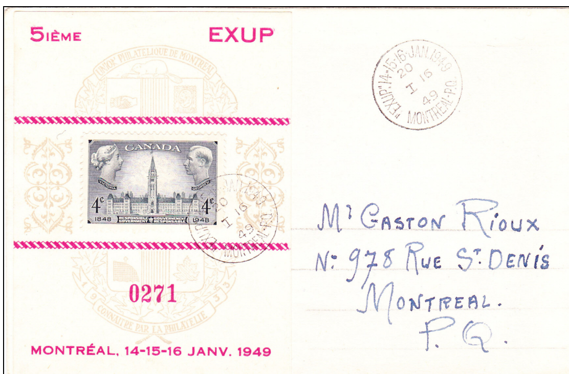
Illustration 2 : Feuillet souvenir émis pour EXUP V avec l'oblitération spécialement conçue pour cette occasion.