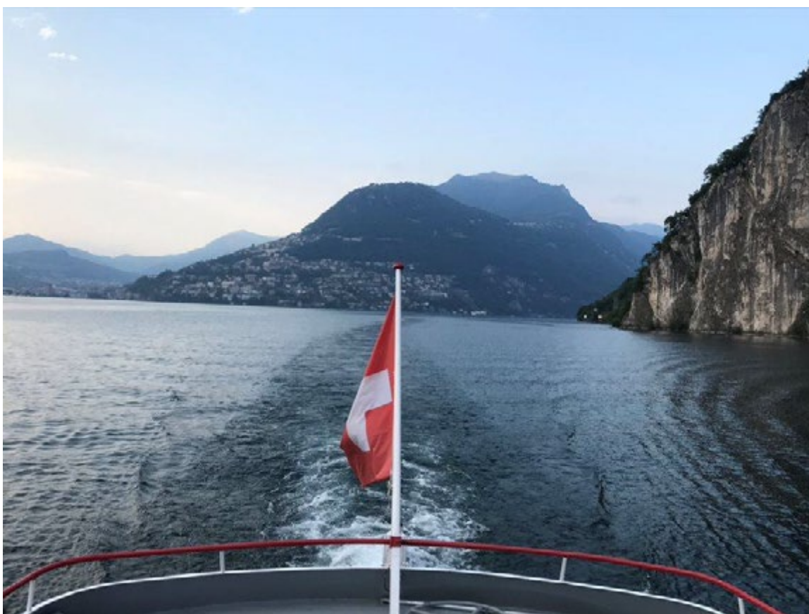
Le paysage luganais par excellence !