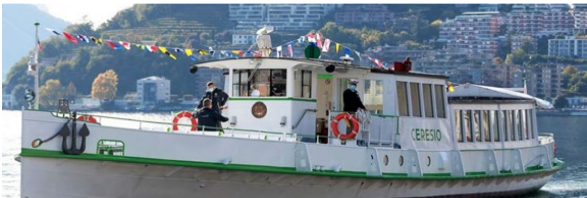
Une croisière de rêve sur le Ceresio !