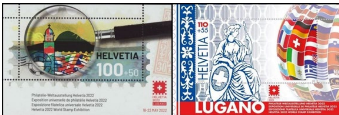
De beaux souvenirs philatéliques d'Helvetia 2022.