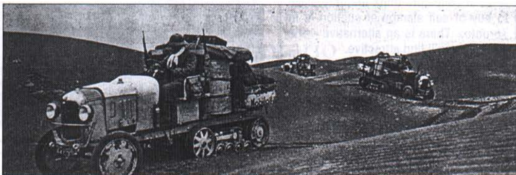
Le convoi des autochenilles Citroën dans les dunes du désert, près de Hassi Inifel.