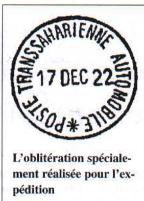
L'oblitération spécialement réalisée pour l'expédition

"L'après midi, nous avons traversé Foggaret-es-Zoua, seul petit village que nous ayons rencontré pendant la longue étape de 800 kilomètres parcourue depuis Ouargla. Nous fûmes reçus par le calif Mohammed, un digne et brave vieillard [...]. Nous avons quitté Foggaret au milieu des cris et de la joie générale. L'automobile y était inconnue. Aucune voiture, avant les nôtres, n'était passée par cet itinéraire de dunes et de sable. Le soir, j'avais rencontré un petit groupe de méharistes qui remontaient vers le nord. Partis depuis un mois de Djanet, un des derniers postes français du Sahara aux confins du Sud-Ouest de la Tripolitaine, ils allaient à travers le désert. Ils avaient encore 1,500 kilomètres à faire avant