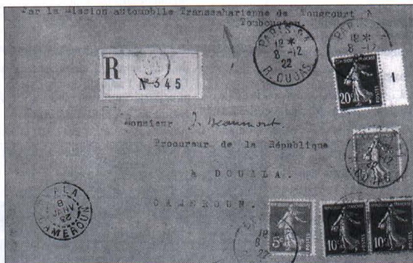
Lettre recommandée transportée lors de l'expédition aller, postée de Paris (rue Cujas), le 8 décembre 1922 pour Daoula (Cameroun). Puisque non postée de Touggourt, elle n'est pas revêtue du cachet spécial de l'expédition. Elle arrive à destination le 8 janvier, soit le lendemain de l'arrivée de l'expédition à Tombouctou. La lettre comporte la mention: Par Mission automobile Transsaharienne de Touggourt à Tombouctou. Collection de l'auteur

Post Office Box 81R, Lambeth Stn. London, Ontario, Canada, N6P 1P9 Telephone (519)681-3420 Fax (519)668-6872 E-mail: jsheffie@execulink.com