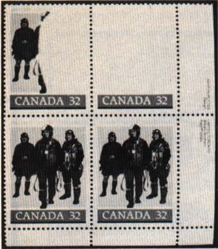
Forces armées (1984)

Note: Les photographies furent prises par Monsieur Marcel LaPorte (Cercle Philatelique Castor Laurentien).