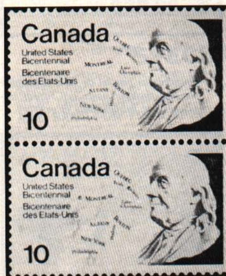
Benjamin Franklin (1976)