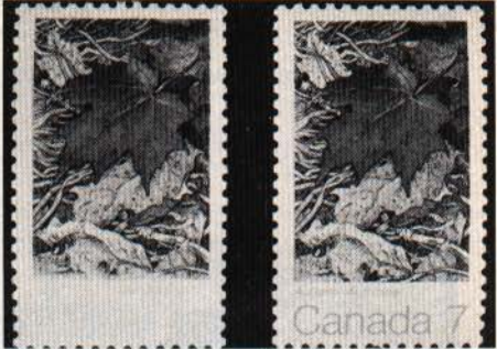
Feuille d'érable (1971)