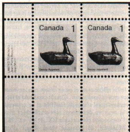
Canada 1 cent Appelant (1982)

Ia Enlèvement total de la lithographie (offset) sur des timbres-poste uniquement imprimés par le procédé de la lithographie. L'enlèvement total de la lithographie peut être que sur une partie du timbre.