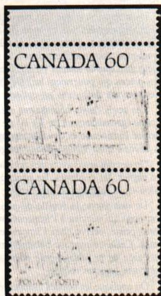
Scènes de la rue (1982)