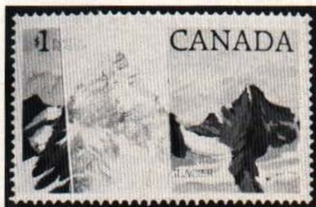
Série courante $1.00 (1984)