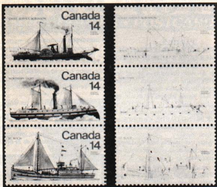
Bateaux 14 cents (1978)

Ib Enlèvement total de la lithographie sur des timbres-poste imprimés par lithographie (offset) et par la gravure. Ce type est celui qui est le plus spectaculaire.