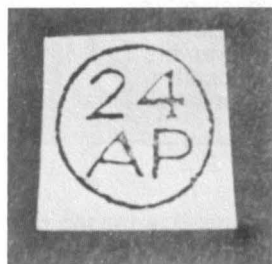
Marque "Bishop" nord-américaine