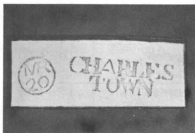
Charleston (Caroline du Sud)