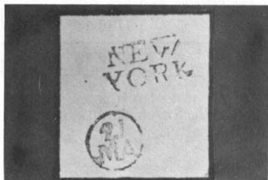
La Métropole américaine dans l'État du même nom.