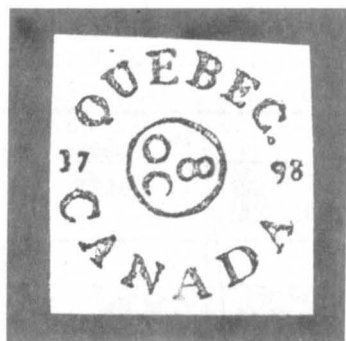
"QUÉBEC 1798 CANADA" utilisée en 1798 et 1799.