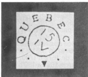
"QUÉBEC" et tri- angle, utilisée de 1773 à 1790.