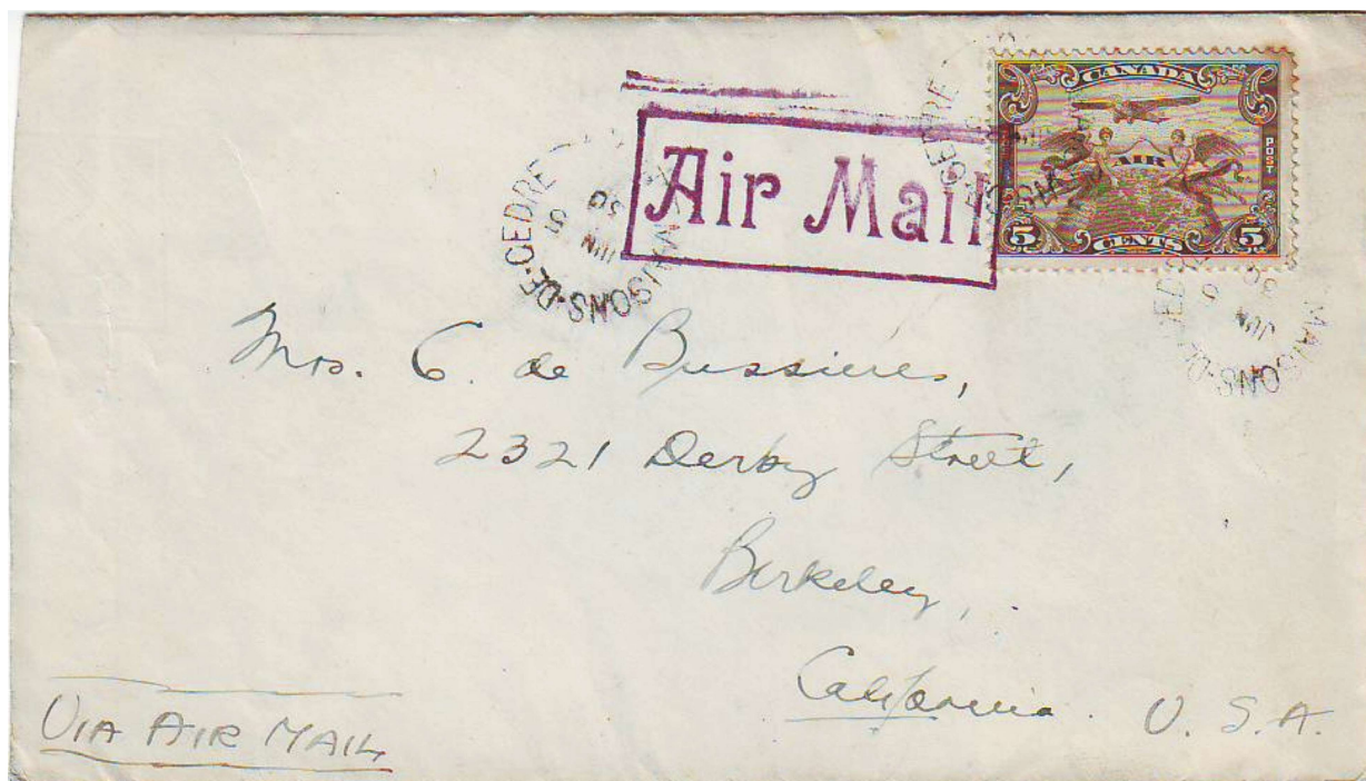
Illustration 4 : Exemple d'utilisation du cachet à date simple cercle interrompu MAISONS-DE-CEDRE en date du 5 juin 1930, oblitérant un timbre de poste aérienne (5 cents) pour les États-Unis, via Montréal.

Entre-temps, les résidents des Rangs 3 et 4 de Sainte-Adèle réclament à leur tour un bureau de poste qui serait localisé cette fois au Rang 3 chez un dénommé Adélard Cloutier de la Rivière-au-Mulet. Ils allèguent que ce serait plus pratique pour eux que de se rendre au bureau de Maisons-de-Cèdre. Actuellement, selon eux, se rendre au bureau de Sainte-Adèle-en-Bas n'est pas plus compliqué. De plus, ils font valoir que le bureau Maisons-de-Cèdre est situé dans un restaurant où il y a une salle de danse, et pour certains résidents bien-pensants ce n'est pas convenable. Cela dit, pour le Ministère, un bureau situé au Lac-Millette ne serait pas non plus pratique pour les habitants du Rang 4 étant donné qu'il serait