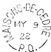
Illustration 3 : Épreuve du cachet à date simple cercle interrompu utilisé par le bureau de Maisons-de-Cèdre entre 1928 et 1933.