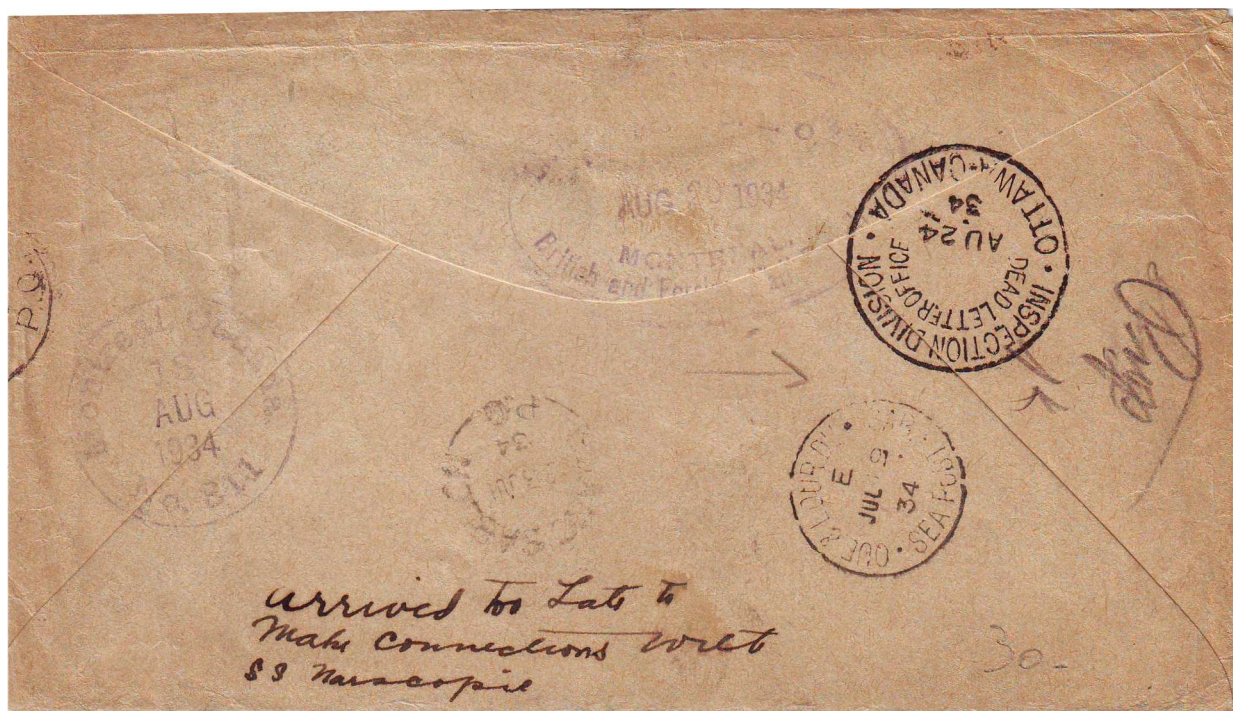
Illustration 3 : Verso de l'enveloppe en illustration 2.