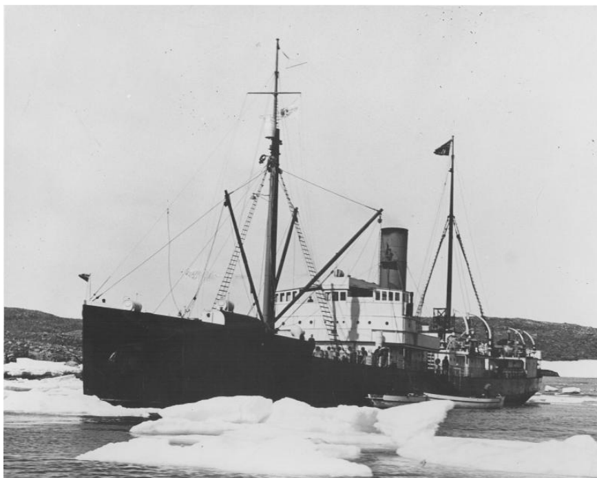
Illustration 4 : Le RMS Nascopie.

d'un peu plus de 285 pieds et pesant 2 500 tonnes, il a été affrété comme navire de ravitaillement des postes de la compagnie, et à ce titre, transporta naturellement le courrier de Sa Majesté. De 1912, date de sa mise en service, jusqu'à 1947, année où il sombra, il effectua pas moins de 34 voyages annuels dans le Grand Nord canadien au cours de sa carrière, avec quelques intermèdes durant les deux Guerres mondiales où il fut utilisé comme cargo. Nul doute que ce bateau légendaire a contribué grandement au développement de l'Arctique canadien.