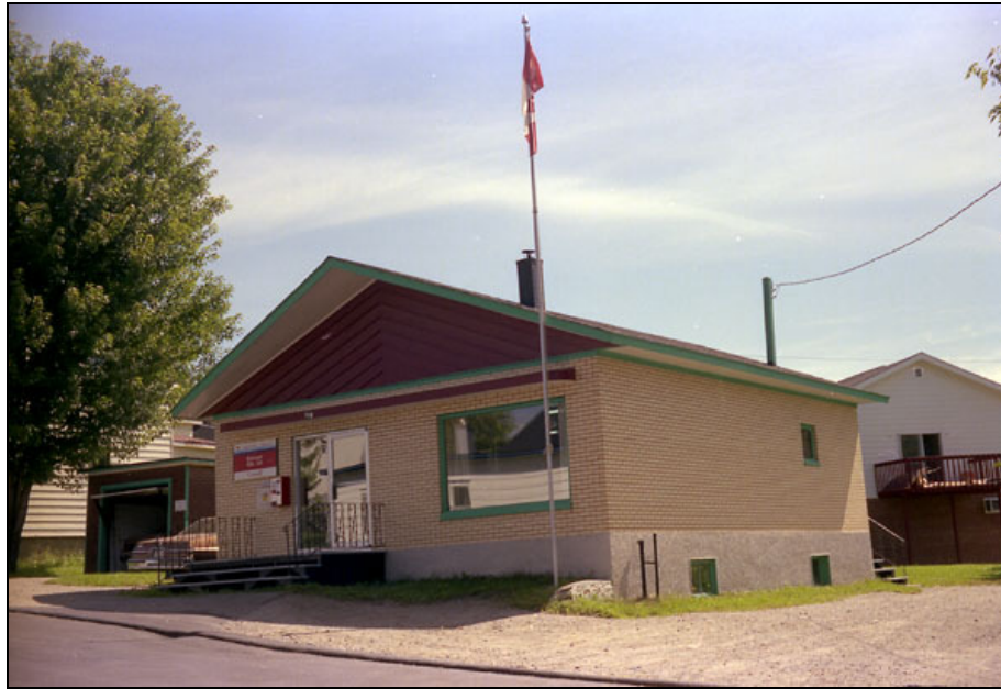
Bureau de poste de Pohénégamook en 1987.