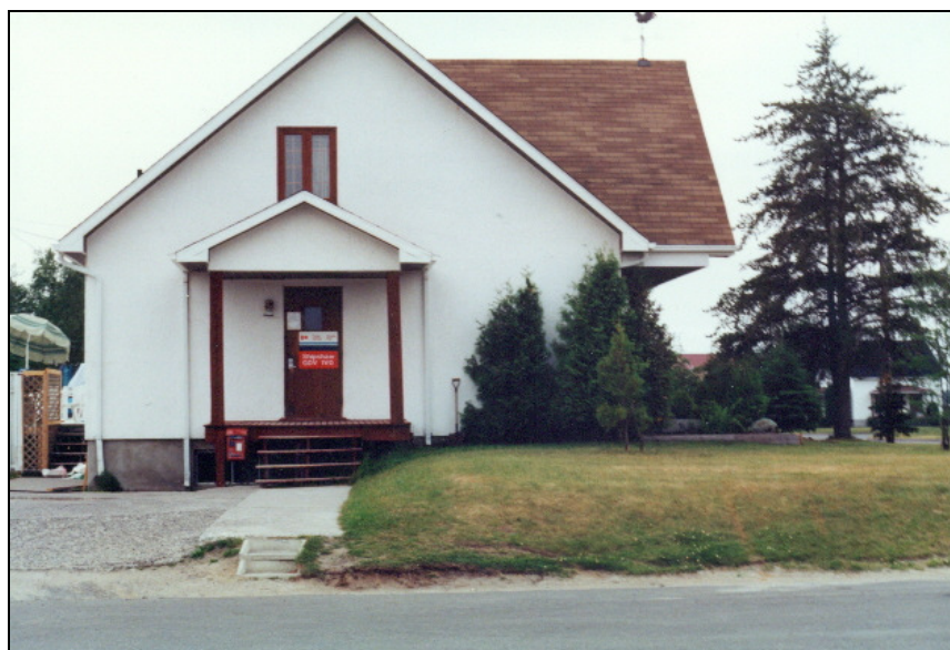
Bureau de poste de Shipshaw en 1991.

Le bureau de poste ouvre d'abord sous le nom de Chute-Shipshaw le 1 er décembre 1909 et prend le nom actuel de Shipshaw le 11 juillet 1968.