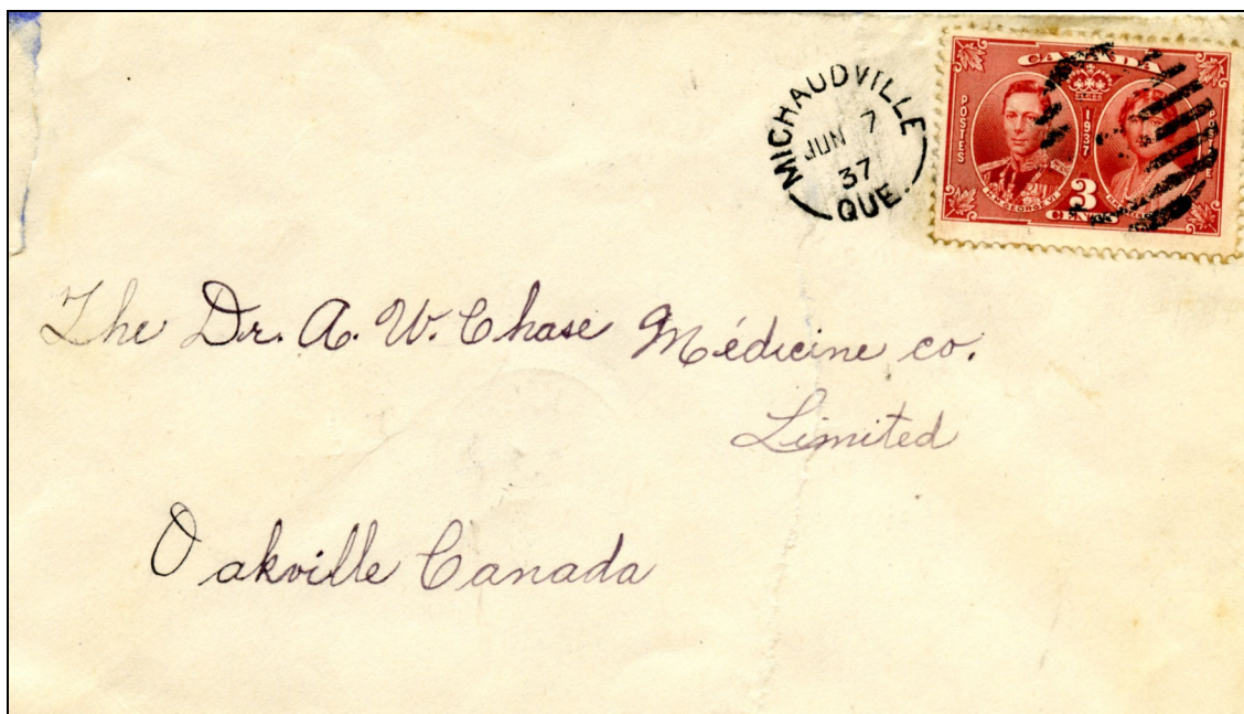
Pli postal en provenance de Michaudville en date du 7 juin 1937.