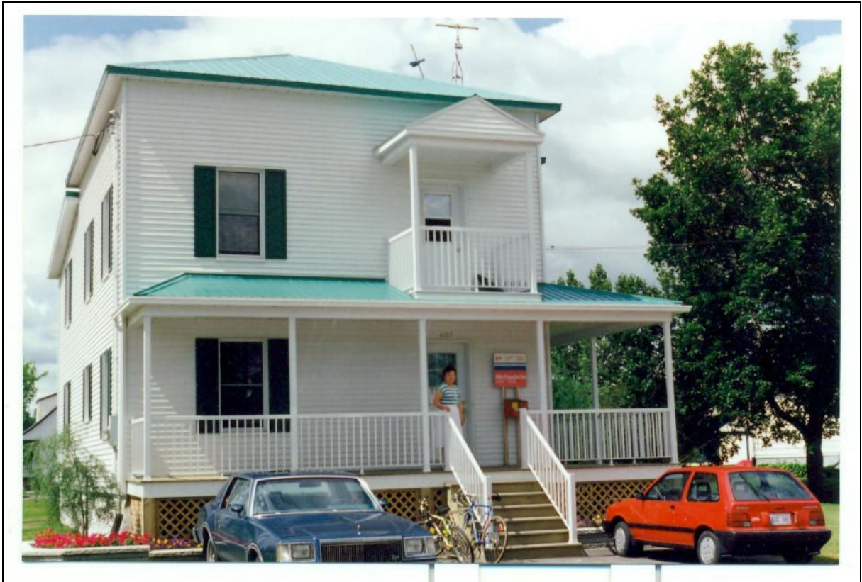
Bureau de poste de Michaudville en 1993.