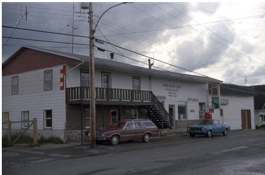
Bureau de poste de Chute-Saint-Philippe en 1984.