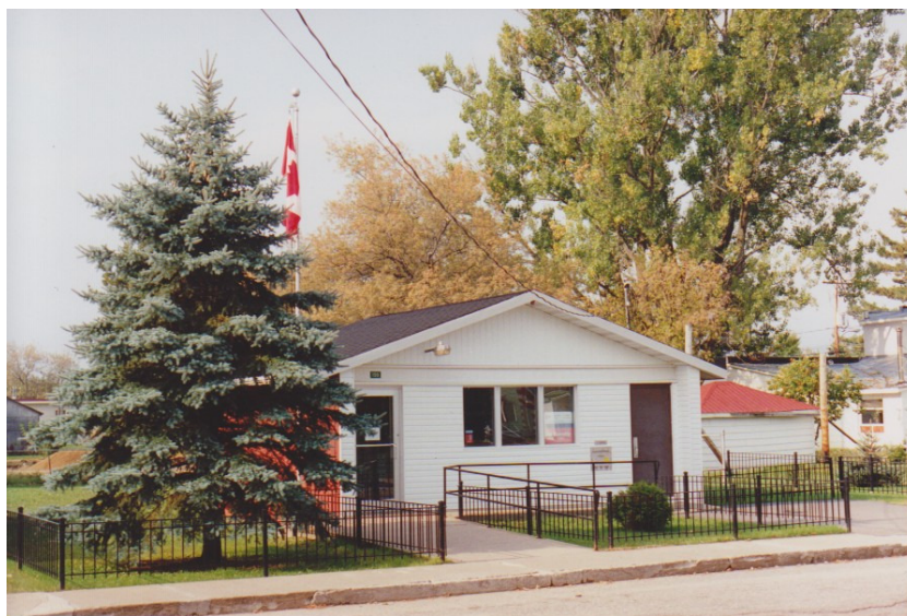
Bureau de poste de Val-Barrette en 1992.