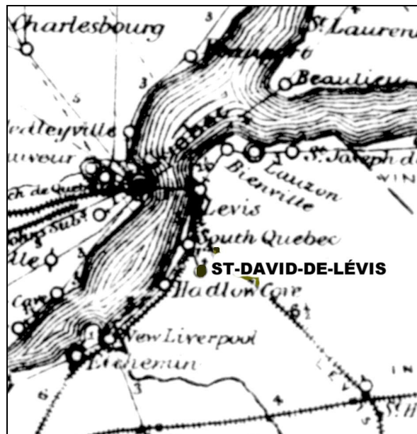
Carte géographique de 1880 localisant le bureau de poste de St-David-de-Lévis

franchise avait le statut de comptoir postal Lévis-St-David (185426).