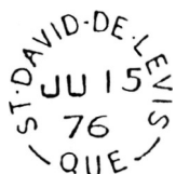
Épreuve du timbre à date de St-David-de-Lévis

En 1875, les habitants de Saint-David-de-l'Aube-Rivière désirent obtenir leur bureau de poste. Un document d'archives relate les circonstances de cette demande au ministère des Postes. Dans une lettre datée du 10 novembre 1875, l'inspecteur principal du district postal de Québec rédige un rapport pour le ministère des Postes. Il mentionne que Saint-David-de-l'Aube-Rivière est situé à mi-chemin entre Lévis et Etchemin et est distant d'environ trois milles de l'un ou l'autre endroit.