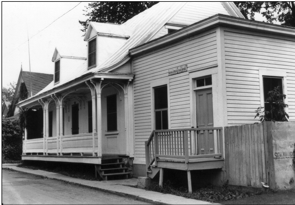
Illustration 1 : Bureau de poste de Boucherville, de 1899 à 1950. Le bureau de poste était situé dans l'annexe à droite de la photographie.