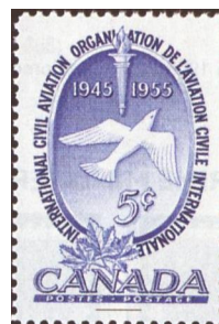
Timbre du Canada émis pour marquer le 10 e anniversaire de l'OACI.