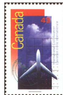
Second timbre émis par le Canada à l'occasion du 50 e anniversaire de l'OACI.