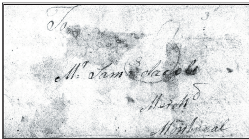
Le premier pli postal du Canada; notez la marque «3» manuscrite; le tarif était alors établi en monnaie «avoir du poids»