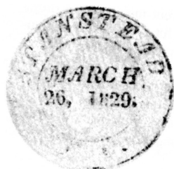
Type 1, 1829