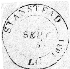
Type 4a, 1834