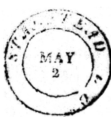
Type 2a, 1832