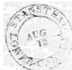
Type 3, 1832-1833