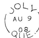
Cercle brisé - 1908