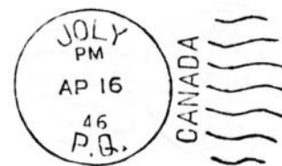
Duplex - 1946