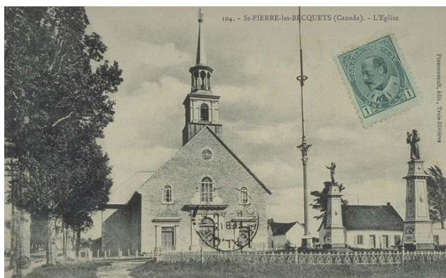
L'église de St-Pierre-les-Becquets au début du 20e siècle.

De nombreuses paroisses du Québec, et parmi les plus anciennes ont Pierre comme patron. Parmi les plus connues, citons Baie St-Paul ( paroisse St-Pierre et St-Paul) bureau de poste ouvert en 1832, Sorel (St-Pierre-de-Sorel) ouvert dès 1814 sous le nom de William Henry. D'autres bureaux de poste de moindre envergure ont desservi des paroisses qui portaient le nom de saint Pierre: L'Avenir (Paroisse St-Pierre-de-Durham, comté de Drummond) ouvert en 1853, Fort-Coulonge (Paroisse St-Pierre-de-Fort-Coulonge, Pontiac, 1853), Pike River (Paroisse St-Pierre-de-Vérone, Missisquoi, 1842) et Wakefield (St-Pierre-de-Wakefield, Gatineau, 1848). Cependant quatre bureaux de poste portant le nom de saint Pierre ont été ouverts avant la Confédération.