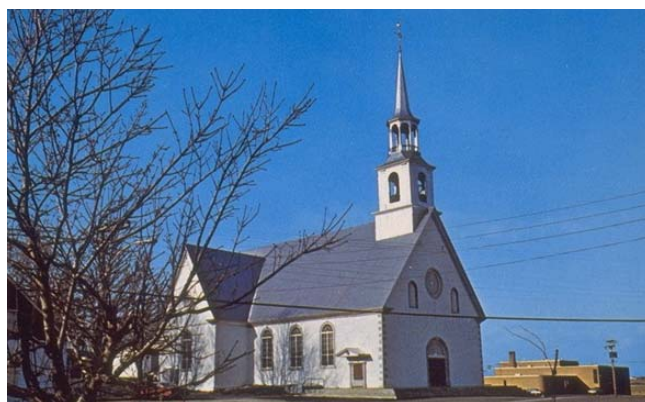
L'église de St-Pierre-de-Montmagny

Le village de St-Pierre-de-Montmagny est situé à l'intérieur des terres à la hauteur de Berthier-sur-Mer, donc à la limite occidentale du comté de Montmagny. Il s'agit d'un territoire d'occupation ancienne puisqu'on y trouvait déjà une église à la fin du Régime français. En suivant la Rivière-du-Sud, les premiers colons de St-Thomas (aujourd'hui Montmagny) ont trouvé des terres fertiles. Le village porte le nom de « St-Pierre » en l'honneur de