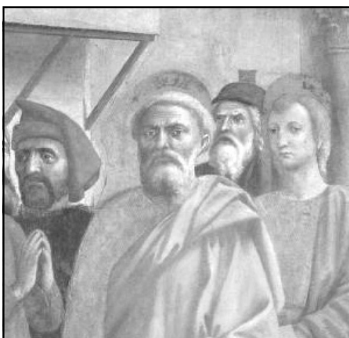
Saint Pierre, d'après Masaccio

Cet article est le troisième de la série.