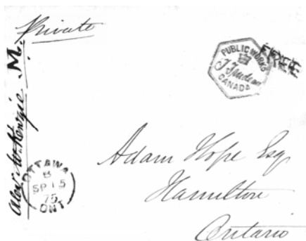
#5 Enveloppe du ministre des Travaux publics, envoyée par Sir Alexander MacKenzie en 1875.

nistre des Travaux Publics et supervisa les travaux de parachèvement des édifices du Parlement. C'est à ce titre qu'il acheminait son courrier comme le montre le pli illustré ci-haut. La marque « Public Works » est celle de son sous-ministre Toussaint Trudeau.