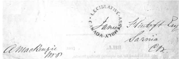
#3 Bill de 1863 envoyé par la poste .

De 1861 à 1867, il est député de Lambton au Haut Canada. C’est de cette période que date le pli illustré sur cette page et où apparaît sa signature. On y voit de plus une marque de l’Assemblée législative de la