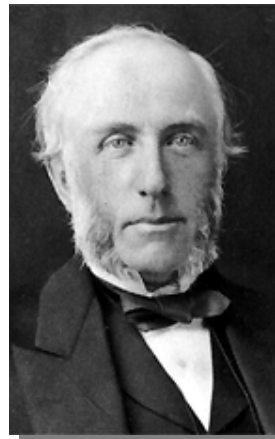
#2 George Brown, père de la Confédération (1818-1880).

Chef du Parti réformiste, Sénateur (1873-1880)