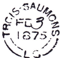
Double cercle brisé TROIS-SAUMONS / L.C

Dans notre article sur les marques postales du comté de L'Islet (Bulletin no 52), nous écrivions qu'aucune marque postale ancienne du village de Trois-Saumons n'avait été rapportée. Ce n'est plus le cas depuis que notre bon ami Roland nous a déniché deux exemplaires de cette marque à double cercle brisé "TROIS-SAUMONS / L.C" munie d'un dateur. Les deux copies datent de 1875, mais il ne fait aucun doute qu'il s'agit d'une marque remontant au milieu des années 1850.