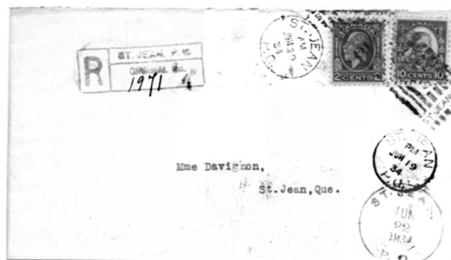
#1 Les deux plis originaux de St-Jean qui se sont retrouvés au Bureau des rebuts