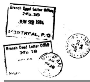
#2 Marques du « Branch Dead Letter Office No. 18 » sur le pli à destination de Montréal

Les deux enveloppes ont été expédiées de St-Jean l'une le 19 et l'autre le 20 juin 1934.