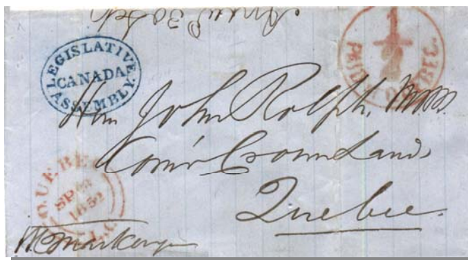
Pli envoyé par William Lyon Mackenzie, membre de l'Assemblée Législative en 1852 à Québec

le Gouvernement Lafontaine-Baldwin et rede- vint député du comté d'Haldimand en 1851. Nous possédons un pli splendide provenant de lui à cette époque. Il fut expédié à partir de l'Assemblée Législative et porte, outre la mar- que de départ de l'Assemblée Législative, la marque de tarif « ½ PAID at Quebec » en rou- ge . W.L.Mackenzie y apposa sa signature, sans doute afin de justifier que la dépense soit assumée par l'Assemblée.