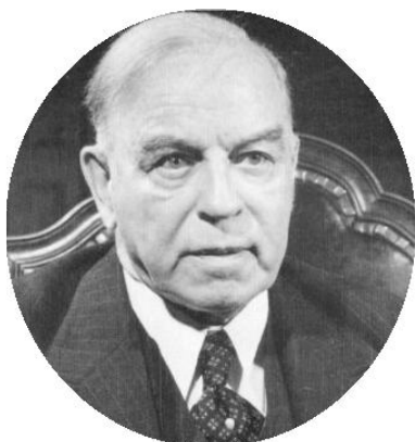
W.L.Mackenzie King, (1874 -1950). Premier ministre libéral

William Lyon Mackenzie King est né à Berlin, aujourd'hui Kitchener, Ontario. Par sa mère, il était le petit-fils du célèbre William Lyon Mackenzie, chef de la rébellion de 1838 au Haut Canada (cf. image 21). Après la rébellion, le premier Mackenzie dut se réfugier aux U.S.A. Il fut amnistié sous