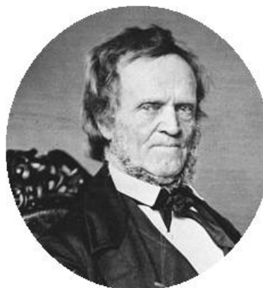
William Lyon Mackenzie (1795 -1861). Chef de la rébellion de 1838 au Haut-Canada

William Lyon Mackenzie King est né à Berlin, aujourd'hui Kitchener, Ontario. Par sa mère, il était le petit-fils du célèbre William Lyon Mackenzie, chef de la rébellion de 1838 au Haut Canada (cf. image 21). Après la rébellion, le premier Mackenzie dut se réfugier aux U.S.A. Il fut amnistié sous