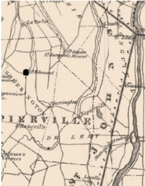
Localisation de Saint-Édouard d'après une carte de 1867 [ Eastern Township Gazetteer ]