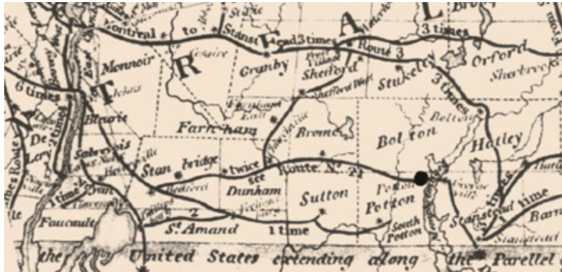
Carte préparée par T.A. Stayner en janvier 1839 situant le bureau de Potton sur la route postale no 21 entre Bedford et Stanstead [BAC, NMC-117401]

Le hameau de Potton est situé au nord-est du canton de Potton. Dans les années 1830, ce lieu s'appelle Knowlton Landing tandis que le bureau de poste prend le nom de Potton. Il est situé à cinq milles en face de Georgeville localisé sur l'autre rive du lac Memphrémagog dans les Cantons de l'Est.