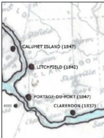
Carte des environs de Portage-du-Fort [Dessin de l'auteur]

Les premiers véritables Portageurs – gentilé qui rappelle la période des voyageurs sur l'Outaouais – s'installent en 1844, et dès 1860, Portage-du-Fort constitue un important centre du Pontiac avec ses moulins, sa gare, son terminus pour les bateaux à vapeur qui transportent du grain et du bois. Cette prospérité devait entraîner la création de la municipalité en 1863, qui prend le nom du bureau de poste (1847), après son détachement de la municipalité du canton de Litchfield 2 .