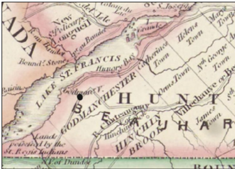
Carte de 1846 situant le village de La Guerre ou Godmanchester [Samuel Holland 2 ]

Le village de La Guerre ou Godmanchester est situé dans le canton de Godmanchester, à 8 milles de Huntingdon. Le village fut fondé durant les années 1820. En 1830 le village compte 82 habitants répartis de part et d'autre des deux branches de la rivière La Guerre 1 .