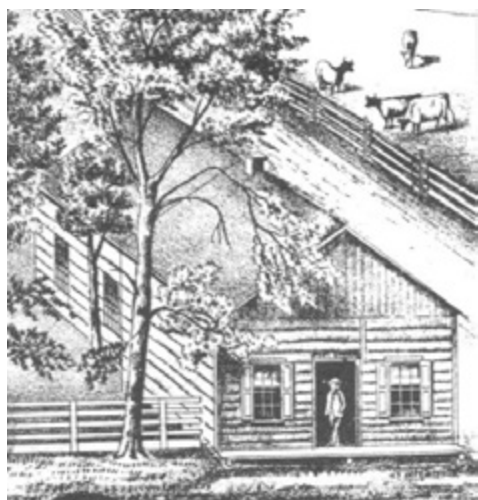
En bas à droite de l'illustration principale, on remarque le magasin général MacDonald combiné au bureau de poste [H. Belden & Co. 4 ]