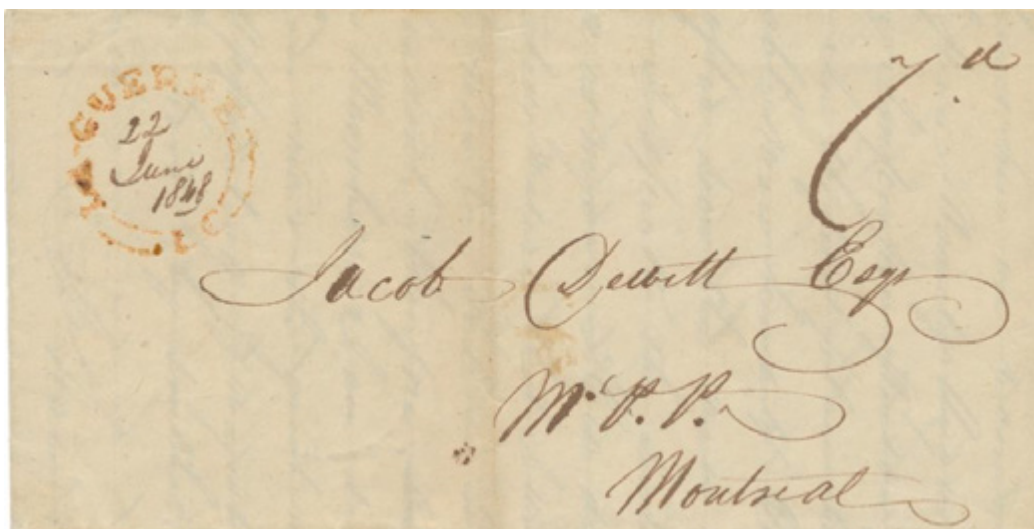
Lettre postée à La Guerre utilisant la marque double cercle interrompu à empattements datée du 22 juin 1848