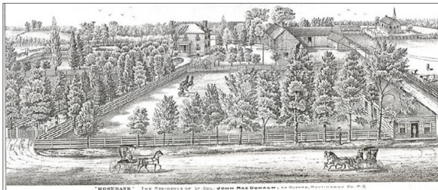
Le domaine Rosebank tel que représenté dans l'Atlas Belden de 1881 [H. Belden & Co. 4 ]

Guerre est vraiment un petit bureau de poste. En 1851, le salaire du maître de poste est de 2£ 13 8 1/2d 7 .