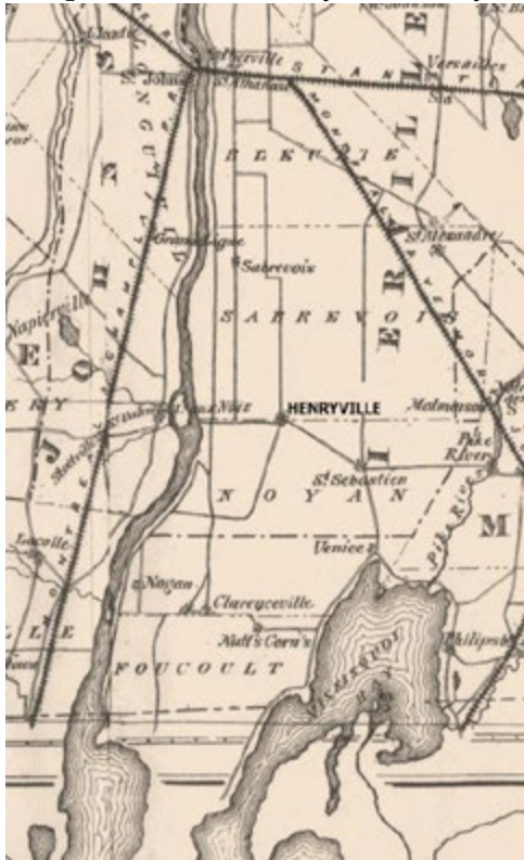
Localisation de Henryville d'après une carte de 1867 [Eastern Township Gazetteer]

Les pionniers, des Loyalistes, s'y installent vers 1784 et seront rejoints par un contingent