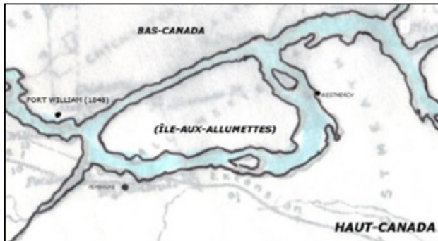
Carte des environs de Fort William