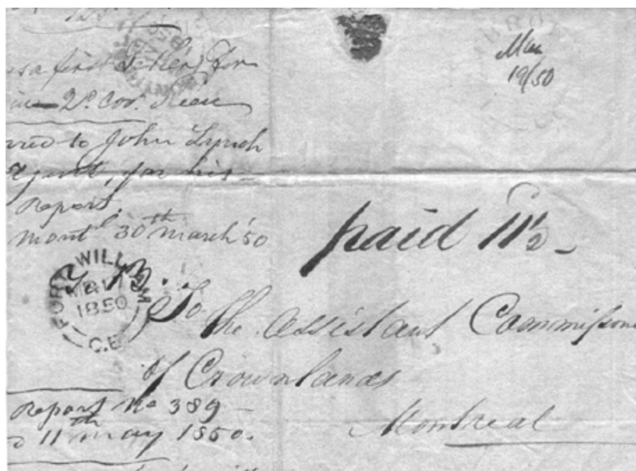
Lettre postée à Fort William le 17 mars 1850 et envoyée à Montréal en utilisant la route postale de Pembroke - Bytown (« PEMBROKE U.C. Mar 19 1850; BYTOWN U.C. MAR 21 1850 »)

Pour l'année d'opération 1851-1852, le salaire de McKenzie est de 8£ 3s 2 ½ d. 8 .