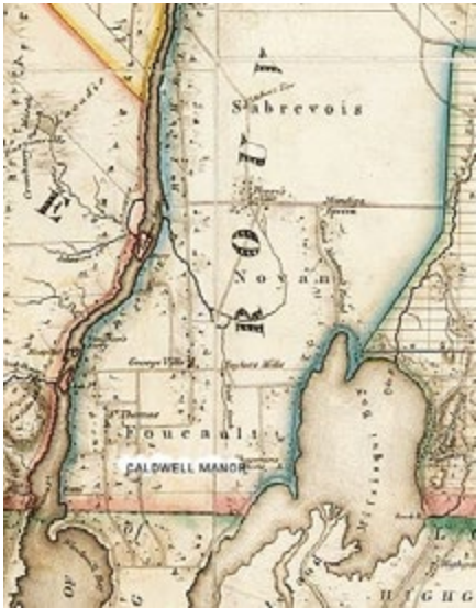
Caldwell Manor (près de la seigneurie de Foucault) est bornée par la baie Missisquoi et la rivière Richelieu. Situé près de Clarenceville à la frontière du Vermont