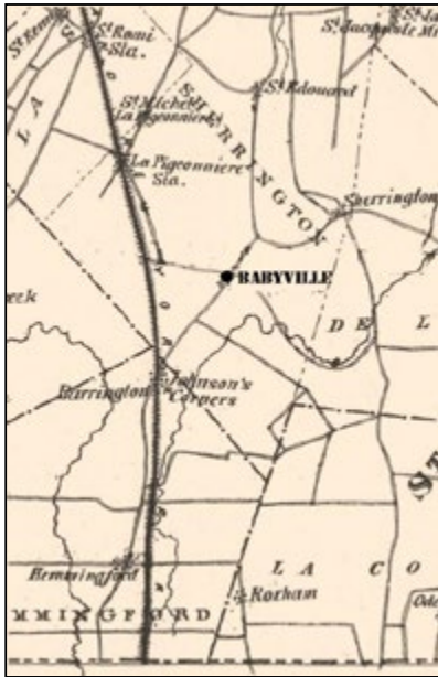
Localisation de Babyville d'après une carte de 1867

Le 7 mars 1831, T.A. Stayner est interrogé par un comité chargé de faire enquête sur la poste.