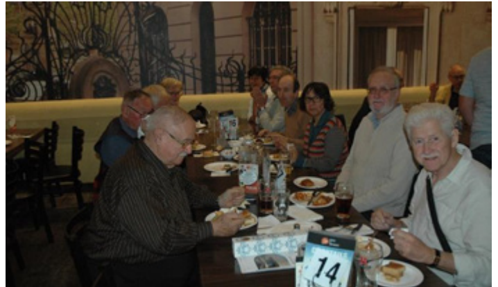
Ill. 11 Souper au restaurant à Gatineau.