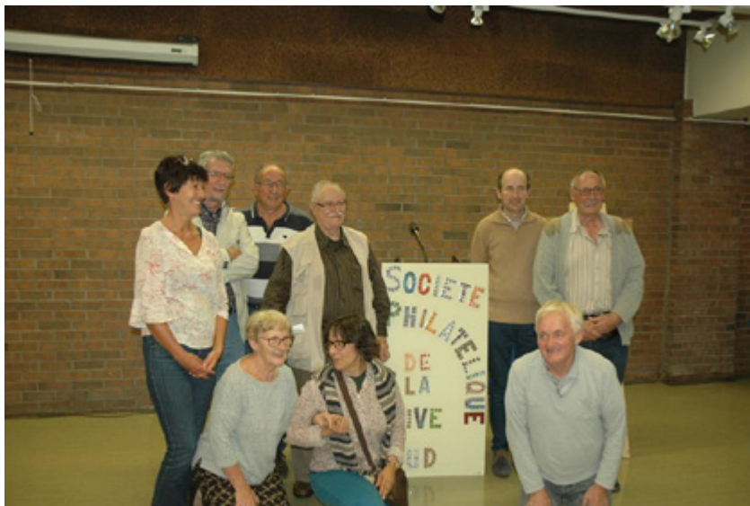
Ill. 4 Les Bourguignons (es) quelques heures après leur arrivée à la rencontre sociale.