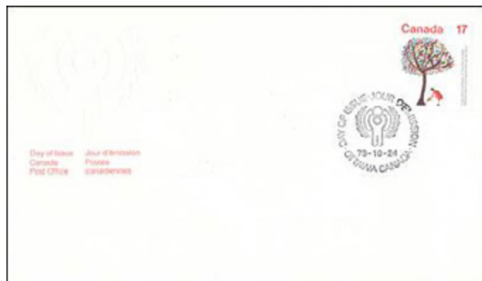
Ill. 1 Timbre intitulé « L'arbre de vie ». Le timbre a été réalisé à partir d'un dessin de l'artiste et primé par l'UNICEF.

remémorer de très beaux souvenirs avant leur départ. Lundi après-midi, les hébergeants ont reconduit les Bourguignons (es) à l'aéroport Pierre-Elliott Trudeau.