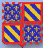
Saint-Apollinaire Varois et Chaignot