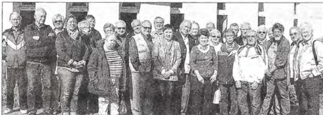
Les cousins québécois ont présenté une grande exposition pour fêter les quinze ans de jumelage.

L'amitié qui lie la France à ses cousins canadiens est loin de se tarir. Pour preuve, les relations excellentes entre Varois et Longueuil, au Québec pour les quinze ans de jumelage.