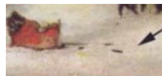
Billot dans la neige