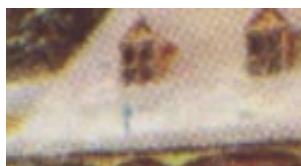
Glace bleue sur le toit

Considérons alors les erreurs d'impression. La plus courante et aussi la plus constante est la variété dite «l'encadrement brisé» qui se retrouve sur tous les timbres de la quatrième colonne et sur toutes les feuilles.