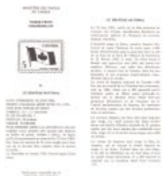
PS-14 annonçant l'émission du timbre de 5 cents sur le drapeau national le 30 juin 1965.

C'est au milieu des années '60 que je me suis abonné auprès du Ministère des postes du Canada pour recevoir gratuitement les notices philatéliques qui donnaient la date d'émission, le format, les couleurs et le tirage. Ces notices unilingues, du format 8½x11 pliées en 3, donnaient également la date limite pour que les philatélistes envoient leurs plis pour les faire oblitérer du cachet du premier jour. Le Ministère ne fournissait pas d'enveloppes illustrées. Les premières notices étaient imprimées bien simplement en noir avec un bon de commande attaché.