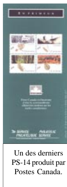
Un des derniers PS-14 produit par Postes Canada.

Pour en revenir à l'ancêtre, c'est en naviguant sur eBay à la recherche de timbres que j'ai découvert ces pages d'un format inhabituel de 8 pouces de largeur par 13 pouces de hauteur, imprimées en noir sur papier légèrement glacé, en anglais seulement. Celles que j'ai obtenues présentaient des timbres émis entre 1955 et 1957. Une courte description du sujet, de la couleur, du designer et parfois de l'imprimeur accompagnent la date d'émission.