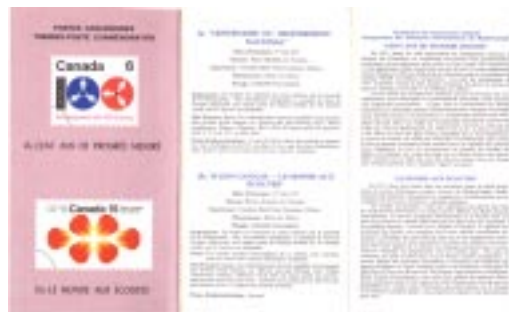
Feuillet de 1971 annonçant les timbres dans leurs couleurs.

Quelques années plus tard, la couleur a commencé à s'introduire et le timbre est maintenant présenté dans ses propres couleurs. D'un format 10½x6½ imprimé d'un seul côté il est plié en 3.