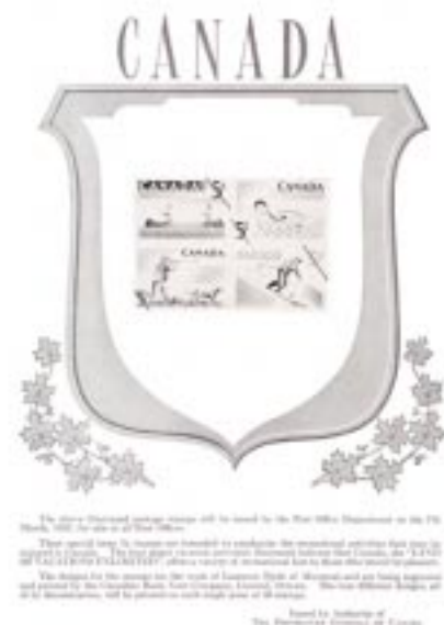
Feuille de présentation des premiers timbres canadiens se tenant émis en 1957.