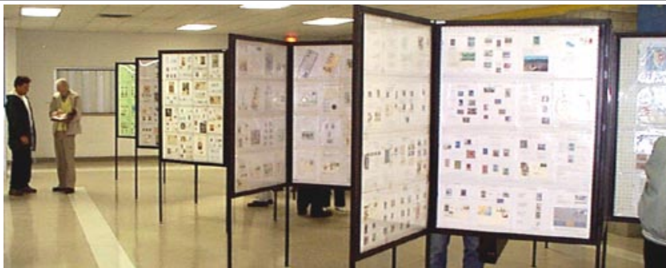
Vue d'ensemble des quelques 600 pages de timbres