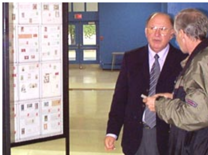
L'exposition a attiré de nombreux visiteurs